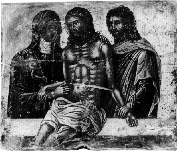
Εικ. 9. Αθήνα, Βυζαντινό και Χριστιανικό Μουσείο. Η Άκρα Ταπείνωση. Εικόνα (Τ 231).