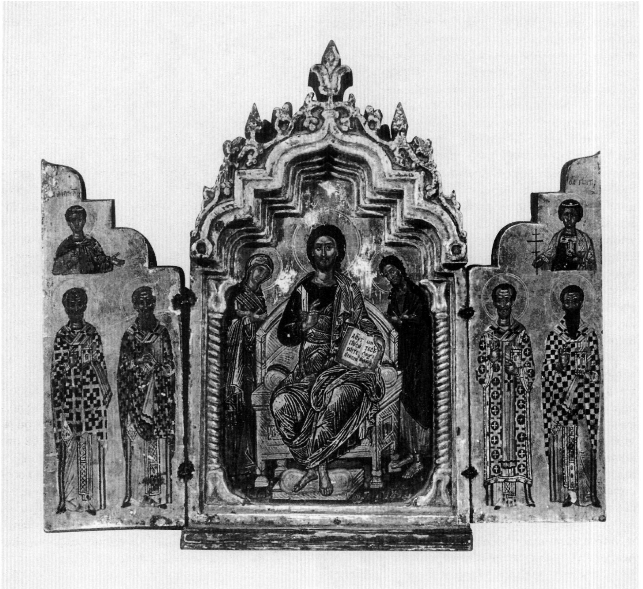
Εικ. 4. Αθήνα, Βυζαντινό και Χριστιανικό Μουσείο. Κρητικό τρίπτυχο (T 2842). Ανοιχτό, εσωτερική όψη: Η Δέηση και άγιοι.

γιεβο 15 . Ο άγιος Ονούφριος παριστάνεται σύμφωνα με τον καθιερωμένο στην κρητική ζωγραφική εικονογραφικό τύπο, που απαντά στις τοιχογραφίες του ναού των