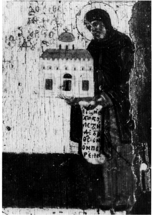
Εικ. 2. Κρητικό τρίπτυχο. Ο όσιος Χριστόδουλος. Λεπτομέρεια της Εικ. 1.

Όταν το τρίπτυχο είναι κλειστό, τα πλάγια δίζωνα φύλλα κοσμοούνται πάνω με την Αγία Τριάδα και κάτω με τους αρχαγγέλους Μιχαήλ και Γαβριήλ (Εικ. 3). Από την παράσταση της Αγίας Τριάδας, η οποία έχει καταστραφεί στο μεγαλύτερό της μέρος, διακρίνονται καθιστοί σε νεφέλες αριστερά ο Πατήρ, κρατώντας στο αριστερό την ένσταυρη σφαίρα του κόσμου, και δεξιά ο Υιός, επίσης με όμοια σφαίρα και ένσταυρο φωτιστέφανο. Φορούν βαθυπόρφυρο χιτώνα και πράσινο σμαραγδί λευκοφωτισμένο ιμάτιο. Δεν σώζεται η μορφή του Αγίου Πνεύματος, που θα εικονιζόταν ψηλά στο μέσον της παράστασης. Κάτω παριστάνονται όρθιοι, ολόσωμοι, μετωπικοί σε χρυσό κάμπο δύο αρχάγγελοι με δίχρωμες, καστανόχρυσες και γκριζογάλανες φτερούγες. Αριστερά Ο ΑΡΧΩΝ ΜΙΧΑΗΛ πατεί νεαρό άνδρα, που εικονίζεται νεκρός σε μαρμαρίνη ανοιχτή σαρκοφάγο. Φορεί κόκκινο χειριδωτό χιτώνα, ριγμένο στους ώμους μανδύα από ροδοπόρφυρη λάκα και περίτεχνο, καστανόχρυσο με γαλαζοπράσινο διάκοσμο, φολιδωτό θώρακα. Ο ψυχοπομπός άγγελος κρατεί με το