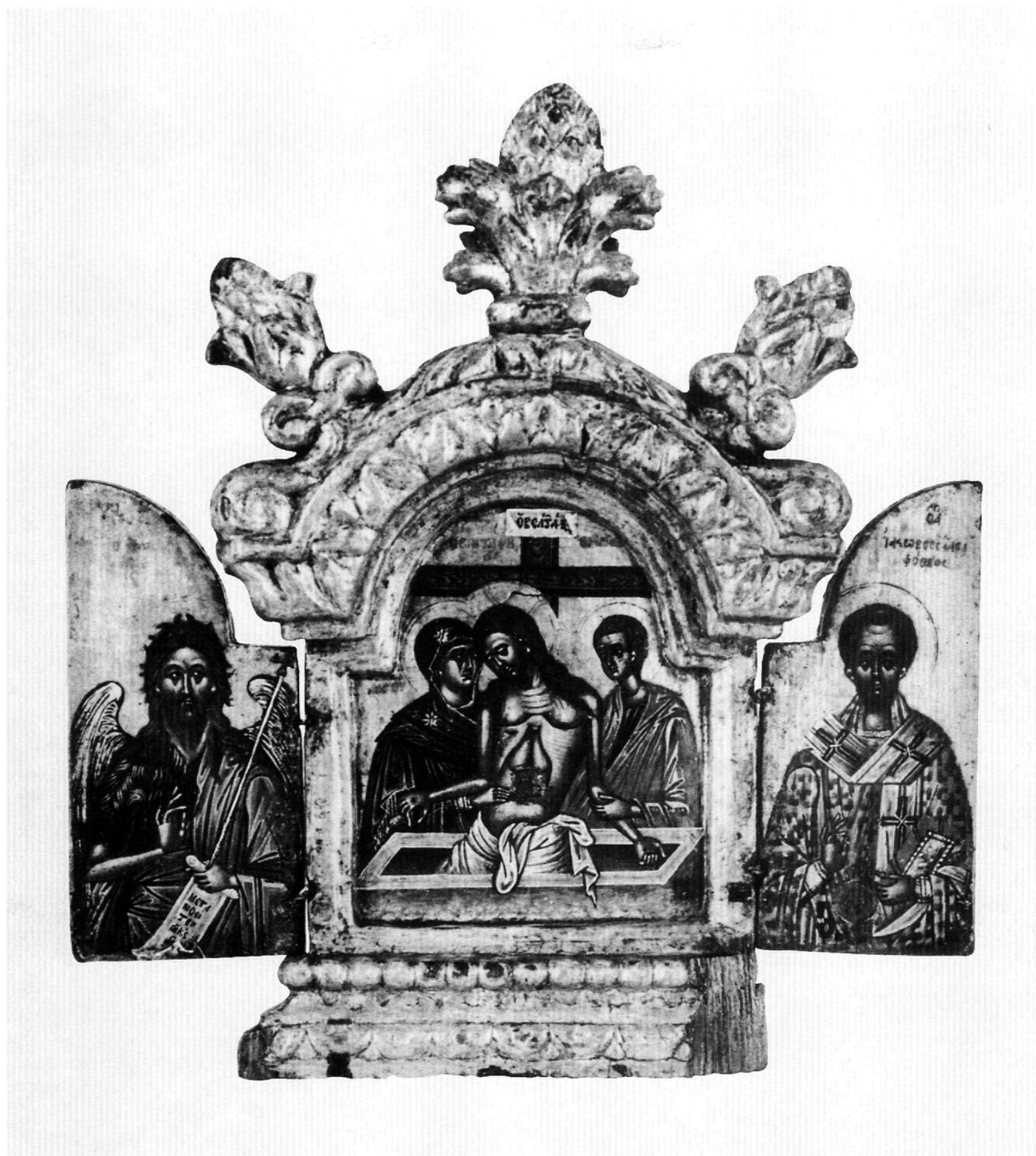
Εικ. 6. Αθήνα, Βυζαντινό και Χριστιανικό Μουσείο. Κρητικό τρίπτυχο με ξυλόγλυπτη επίστεψη (T2851). Ανοιχτό, εσωτερική όψη: Η Άκρα Ταπείνωση και άγιοι.