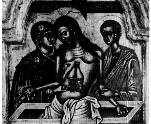
Εικ. 10. Η Άκρα Ταπείνωση. Λεπτομέρεια της Εικ. 6.

να σχήματα των κρητικών τριπτύχων του 16ου αιώνα, όπως δείχνει η πληθώρα των γνωστών παραδειγμάτων. Το ίδιο σχήμα χρησιμοποιεί ο Δομήνικος Θεοτοκόπουλος για το τρίπτυχο της Modena και ο Γεώργιος Κλόντζας σε πολλά έργα του, όπως σε έργα της συλλογής Spada και της Πάτμου 32 . Από τα πολλά αδημοσίευτα παραδείγματα του είδους άξια αναφοράς είναι δύο μεσαία φύλλα τριπτύχων στο Βυζαντινό Μουσείο, που κοσμούνται αντίστοιχα με την παράσταση της Σταύρωσης (Τ 398α) 33 και της Δέησης (Τ 2025) (Εικ. 8).