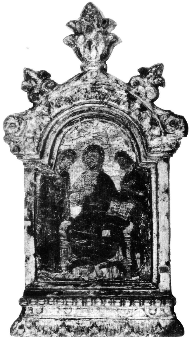
Εικ. 8. Αθήνα, Βυζαντινό και Χριστιανικό Μουσείο. Μεσαίο φύλλο κρητικού τριπτύχου με ξυλόγλυπτη επίστεψη (Τ 2025). Η Δέηση.

Όταν τα φύλλα είναι κλειστά (Εικ. 7), απεικονίζονται ολόσωμοι στραμμένοι προς το κέντρο αριστερά ο συγγραφέας της Αποκάλυψης, Ο ΑΓΙΟΣ ΙΩΑΝΝΗΣ Ο ΘΕΟΛΟΓΟΣ , κρατώντας με τα δύο του χέρια χρυσόδετο πολύτιμο κώδικα, και δεξιά Ο ΟΣΙΟΣ ΧΡΙΣΤΟΔΟΥΛΟΣ , κτήτορας της μονής της Πάτμου, με μοναχικό σχήμα, κρατώντας στο δεξιό του χέρι ομοίωμα από το καθολικό της μονής και στο κατεβασμένο αριστερό ανοιχτό ειλητάριο με την αρχή της επιγραφής Ο ΟΝ/Η ΓΑΤ/ΗΡ ΤΑ/ΠΙΝΟΥ/ΤΑΙ ( ἐν βρώμασι καὶ πόμασι, τοσοῦτον ὑγεία σώματος καὶ καθαρότης ψυχῆς προτανεύεται ). Ο Θεολόγος φορεί χιτώνα πράσινο και ιμάτιο ρόδινο με πράσινες μεταλλικές ανταύγειες. Ο μεγαλόσημος μοναχός Χριστόδουλος φορεί κουκούλιο πράσινο-κυπαρισσί, μανδύα σε χρώμα βυσσινί-κόκκινο και καββάδι καστανό-λαδί. Οι φωτοστέφανοι των μορφών ορίζονται από