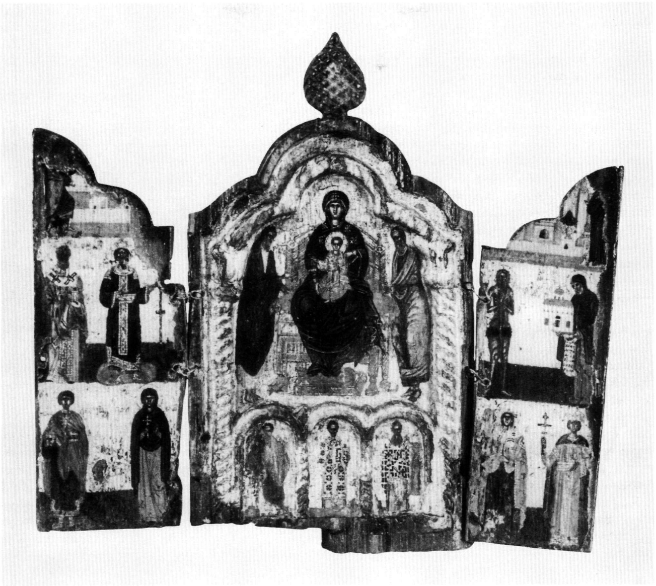
Εικ. 1. Αθήνα, Βυζαντινό και Χριστιανικό Μουσείο. Κρητικό τρίπτυχο (T 2857). Ανοιχτό, εσωτερική όψη: Η Παναγία ένθρονη βρεφοκρατούσα, ο Ευαγγελισμός, ιεράρχες και άγιοι.

αριστερό τον Τίμιο Σταυρό του μαρτυρίου, συμβολική και συνοπτική απόδοση της Εύρεσης 9 . Στην κάτω ζώνη εικονίζονται ολόσωμοι, μετωπικοί, αριστερά Ο ΑΓΙΟΣ ΠΑΝΤΕΛΕΗΜΩΝ και δεξιά Η ΑΓΙΑ ΠΑΡΑΣΚΕΥΗ . Ο