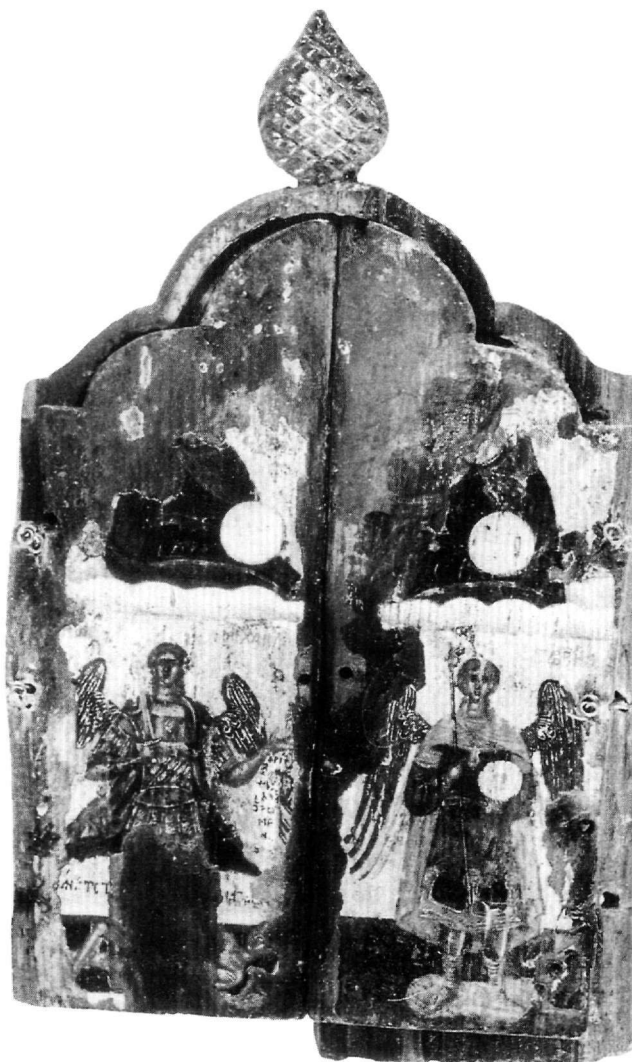
Εικ. 3. Αθήνα, Βυζαντινό και Χριστιανικό Μουσείο. Κρητικό τρίπτυχο (T 2857). Κλειστό: Η Αγία Τριάδα, οι αρχάγγελοι Μιχαήλ και Γαβριήλ.

1507 14 . Οι μορφές των ιεραρχών στην κάτω ζώνη του μεσαίου φύλλου παρουσιάζουν επίσης μεγάλες αναλογίες με τις αντίστοιχες στο περιθώριο της μεγάλης εικόνας με τη Δέηση, έργο του Νικολάου Ρίτζου, στο Σερά-