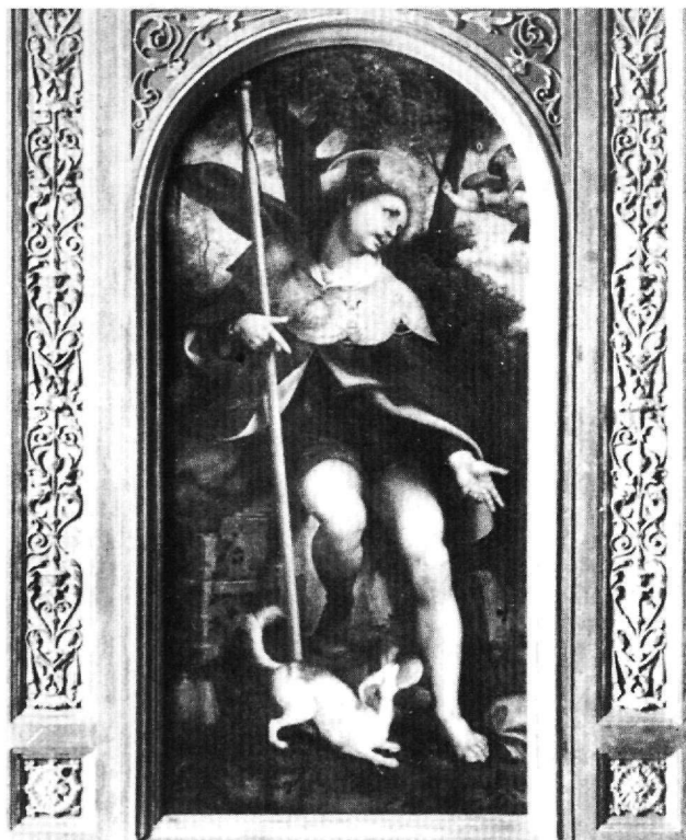
Εικ. 6. Μιλάνο, Castello Sforzesco. Ο άγιος Ρόκκος. Λεπτομέρεια πολυτύχου.

Μαρτυρίες για περιπτώσεις λοιμού στα Κύθηρα είναι γνωστές τα έτη 1719-1720 35 . Γνωρίζουμε ακόμη ότι η λατρεία του αγίου ήταν και εδώ διαδεδομένη, όπως αποδεικνύεται από την εικόνα των αγίων Ρόκκου και Θεοδώρου, επίσης του 18ου αιώνα, στο Κάστρο Κυθήρων (Εικ. 5). Ο παραγγελειοδότης ανέθεσε σε ένα ζωγράφο την κάλυψη της πίσω πλευράς με μία νέα, διαφορετική εικονογράφηση του αγίου. Στο στενό πλέον περιβάλλον των Κυθήρων με τα περιορισμένα καλλιτεχνικά ερεθίσματα, ο ζωγράφος αποδίδει τώρα τον άγιο Ρόκκο στο πνεύμα της παραδοσιακής ζωγραφικής. Σύμφωνα με την επιγραφή αυτής της πλευράς ο ζωγράφος αναφέρεται ως ψάλτης. Δεν γνωρίζουμε όμως αν ήταν το επώνυμό του ή ήταν ψάλτης σε κάποιο ναό. Η παράσταση αυτής της πλευράς παρέμεινε από τότε και η κύρια όψη της εικόνας δεδομένου ότι καλύφθηκε με αργυρή επένδυση, όπως αποδεικνύεται από τις οπές στην πάνω και την κάτω πλευρά της. Η κάλυψή της με