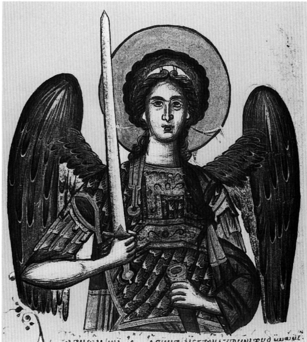
Εἰκ. 4. Ὁ ἀρχάγγελος Μιχαήλ (φ. 77ν).

λ.χ. τόν Θωμᾶ τῆς Μεγάλης Δεήσεως στόν Ταξιάρχη Κερκύρας, πού ἀποδίδεται στόν Μιχαήλ Δαμασκηνό, ὅπου ὁμως ὁ ἅγιος εὐλογεῖ ἐνώνοντας τόν παράμεσο καί τόν μικρό δάκτυλο μέ τόν ἀντίχειρα, καί κρατεῖ πιά κομφά, διαγωνίως, τό εἰλητάριο 42 .