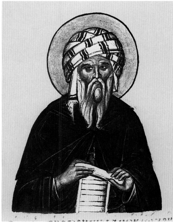
Είκ. 7. Ὁ ἅγιος Ἰωάννης ὁ Δαμασκηνός (φ. 131v).