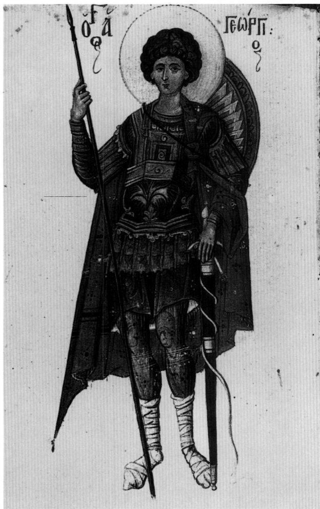
Εἰκ. 14. Ὁ ἅγιος Γεώργιος (φ. 300ν).

Ἡ κομψή μορφή τοῦ ἀρματωμένου ἁγίου Γεωργίου (φ. 300ν, Εἰκ. 14) θυμίζει στρατιωτικούς ἁγίους τῶν χρόνων τῶν Παλαιολόγων 98 , τοὺς ὁποίους μιμήθηκαν οἱ