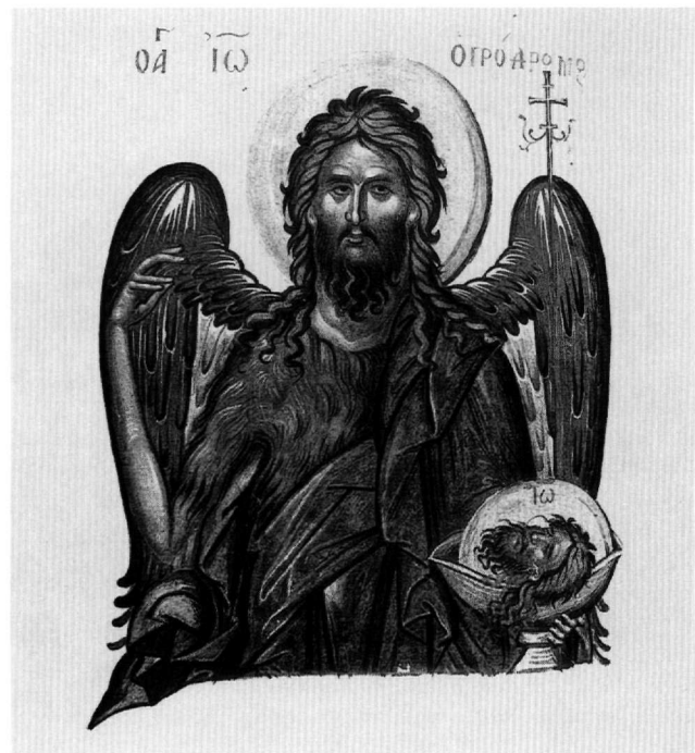
Εἰκ. 17. Ὁ ἅγιος Ἰωάννης ὁ Προδρόμος (φ. 429ν).