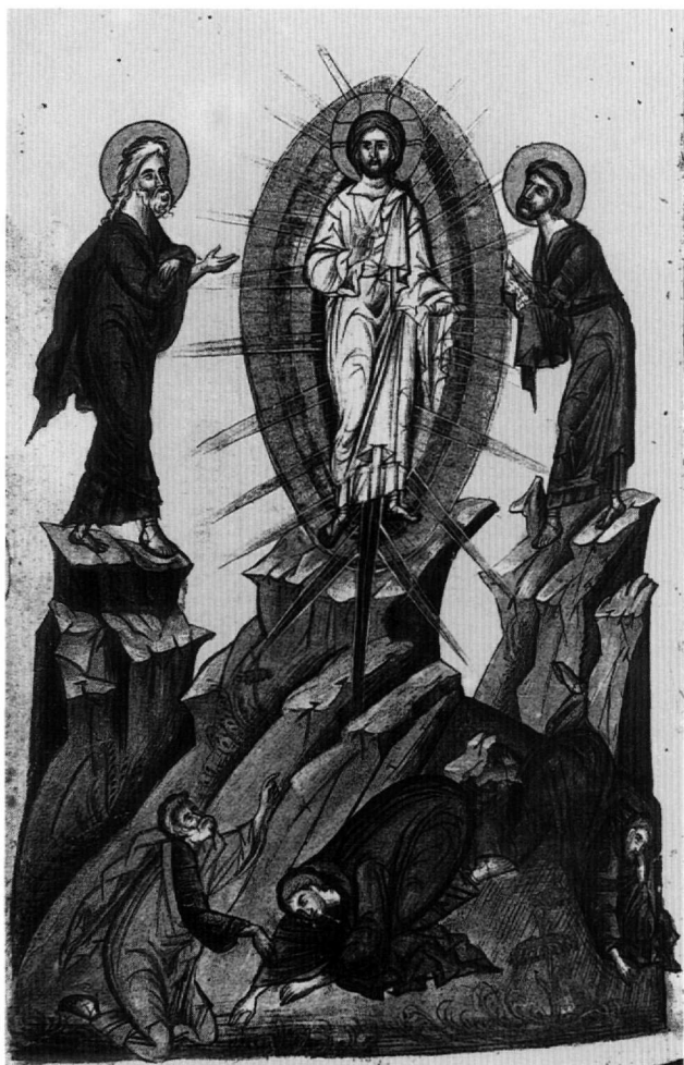
Εἰκ. 18. Ἡ Μεταμόρφωση (φ. 400ν).