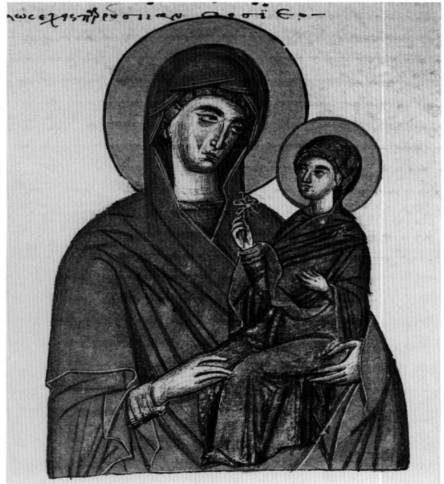
Εἰκ. 5. Ἡ ἁγία Ἄννα μέ τήν Θεοτόκο (φ. 103ν).

κη 44 . Ὁ μανδύας δένεται ἐκεῖ στό μέσον τοῦ στέρνου καί καλύπτει ὁλόκληρο τό ἀριστερό χέρι· τό κεφάλι εἶναι ἐλαφρά γυρισμένο δεξιά. Ἡ κρητική παραλλαγή ἀποκρυσταλλώνεται τόν 15ο αἰῶνα. Σέ εἰκόνα τῆς Σηλιᾶς Κισσάμου, πού ὁ Μπορμπουδάκης χρονολογεῖ στήν δεύτερη πεντηκονταετία τοῦ 15ου αἰῶνα καί συσχετίζει μέ τόν Ἄνδρέα Ρίτζο, ἐνῶ κατά τήν γνώμη μου εἶναι λίγο μεταγενέστερη, τό περιλαίμιο εἶναι κρυμμένο ἀπό τό σπαθί, οἱ πτεροῦγες εἶναι λιγώτερο ἀπλωμένες καί ὁ μανδύας καλύπτει μέ φυσικότητα τό ἀριστερό χέρι 45 . τό ἴδιο σέ εἰκόνα τοῦ Ἰωάννου Ἀπακᾶ στήν Μονή Κρυρα τοῦ Μαυροβουνίου καί σέ εἰκόνες τοῦ Ἁγίου Χαραλάμπου στίς Πλάκες Μήλου, τοῦ 17ου αἰῶνα, καί τῆς Μητροπόλεως Ρόδου, τήν ὁποία θά τοποθετοῦσα στίς ἀρχές τοῦ 17ου αἰῶνα 46 . Σέ σερβικά χαρακτηριστικά τοῦ 16ου αἰῶνα, πού ἀντιγράφουν κρητικές παραστάσεις,