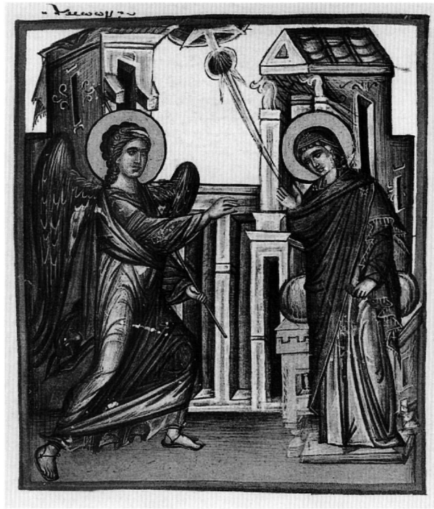
Εἰκ. 13. Ὁ Εὐαγγελισμός (φ. 284v).

εἰκονίδιο στό Recklinghausen 93 καί φύλλο τριπτύχου τῆς Temple Gallery 94 , ἀλλά καί ὁψιμότερα, ὅπως ἡ εἰκόνα τοῦ Ἰωάννου Κυπρίου στό Μουσεῖο Μπενάκη 95 καί εἰκόνα στήν Μονή τῆς Πάτμου 96 . Ἡ βαθμιαία ἀλλαγὴ τοῦ τόνου τοῦ διαπέδου, πού εἶναι πιό σκοῦρο στό βάθος, δηλώνεται μέ λεπτές σκοῦρες πινελιές, ὅπως καί σέ σύγχρονες εἰκόνες 97 .