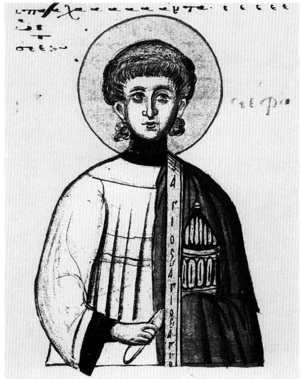
Εἰκ. 9. Ὁ ἅγιος Στέφανος (φ. 193).

Στήν Βάπτιση τοῦ φ. 204ν (Εἰκ. 10) ὁ Χριστός εἰκονίζεται γυμνός, ὅπως συνηθίζεται κατὰ τήν μέση βυζαντινή περίοδο, ἐνῶ στά παλαιολόγια παραδείγματα φορεῖ συνήθως περιζώμα 69 . Τά νερά τοῦ ποταμοῦ δέν σκεπάζουν τό κατώτερο μέρος τοῦ σώματός του. Ἡ ὀγκώδης, στατική μορφή τοῦ Προδρόμου κατάγεται ἀπό τήν ὀγκηρή τεχνοτροπία τοῦ τέλους τοῦ 13ου αἰῶνα 70 . Δεξιά στέκονται σέ μία σειρά τρεῖς ἄγγελοι, ἐνῶ στά μεσοβυζαντινά παραδείγματα εἶναι συνήθως μόνο δύο, καί στά πόδια τοῦ Χριστοῦ εἰκονίζεται ὁ Ἰορδάνης, μέ τήν συνήθη μορφή γέροντα πού κρατεῖ ἄγγεῖο. Ἀπό ἀβλεψία προφανῶς δέν σχεδιάσθηκε ἡ δεξιά ὄχθη τοῦ ποταμοῦ. Ὅμοιότητες μέ τήν μικρογραφία τοῦ στιχηραρίου μας παρουσιάζουν διάφορες μεταβυζαντινές παραστάσεις τῆς Βαπτίσεως. Τήν ὀγκώδη μορφή τοῦ Βαπτιστή σέ ἔντονη πρόκυψη ξαναβρίσκομε λ.χ. στήν τοιχογραφία τοῦ Σκλαβεροχωρίου στήν Κρήτη 71 , στήν εἰκόνα τοῦ Νικολάου Ρίτζου στό Σεράγεβο 72 , σέ εἰκόνα τοῦ Βυζαντινοῦ Μουσείου πού ἔχει ἀποδοθεῖ στόν 15ο αἰῶνα (Τ 542) 73 , στήν εἰκόνα Δωδεκαῶρου τῆς Μεγίστης Λαύρας