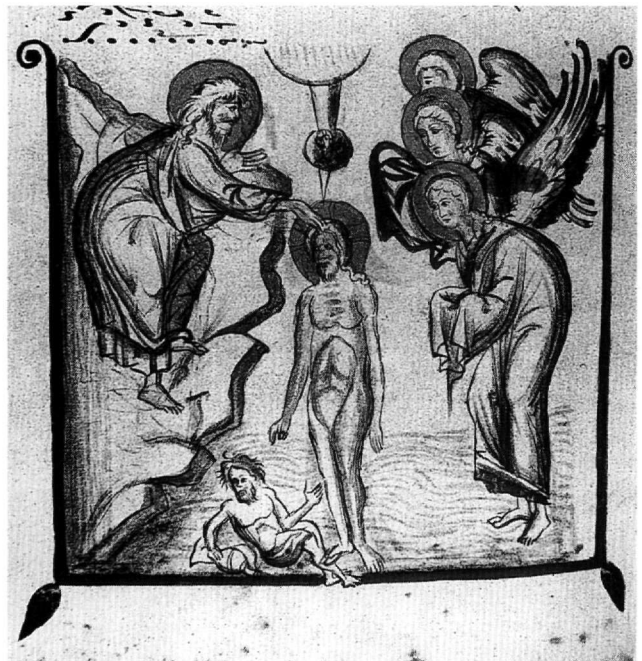
Εἰκ. 10. Ἡ Βάπτιση (φ. 204ν).