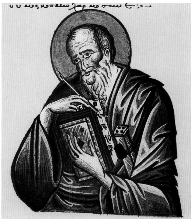
Εἰκ. 2. Ὁ ἅγιος Ἰωάννης ὁ Θεολόγος (φ. 35v).

Ξένου Διγενῆ στὰ Ἀπάνω Φλώρια Σελίνου (1470) 23 καὶ στὴν Κάτω Μερόπη τοῦ Πωγωνίου 24 , καὶ τοῦ καθολικοῦ τῆς Μονῆς Δοχειαρίου (1567) 25 καὶ πρὸς ξυλογραφία πού κοσμεῖ σερβικό μνηαῖο τυπωμένο στὴν Βενετία