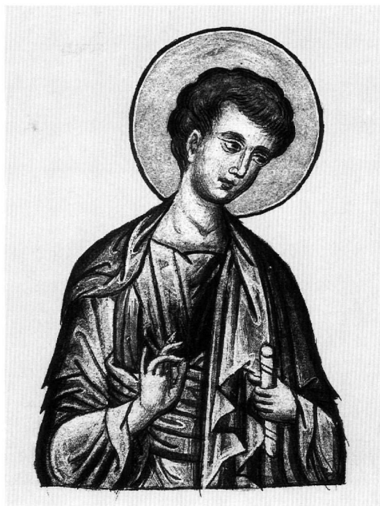
Εικ. 3. Ο άπόστολος Θωμάς (φ. 48).

Ο άπόστολος Θωμάς, στηθαίος, έλαφρά στραμμένος δεξιά, μέ τό κεφάλι γερμένο, εύλογεί, ενώ κρατεί στό άριστερό χέρι κλειστό εύλητάριο (φ. 48, Εικ. 3). Ο τύπος χρησιμοποιήθηκε τόν 16ο και τόν 17ο αιώνα σέ παραστάσεις άποστόλων για Μεγάλες Δείσεις τέμπλων· βλ.