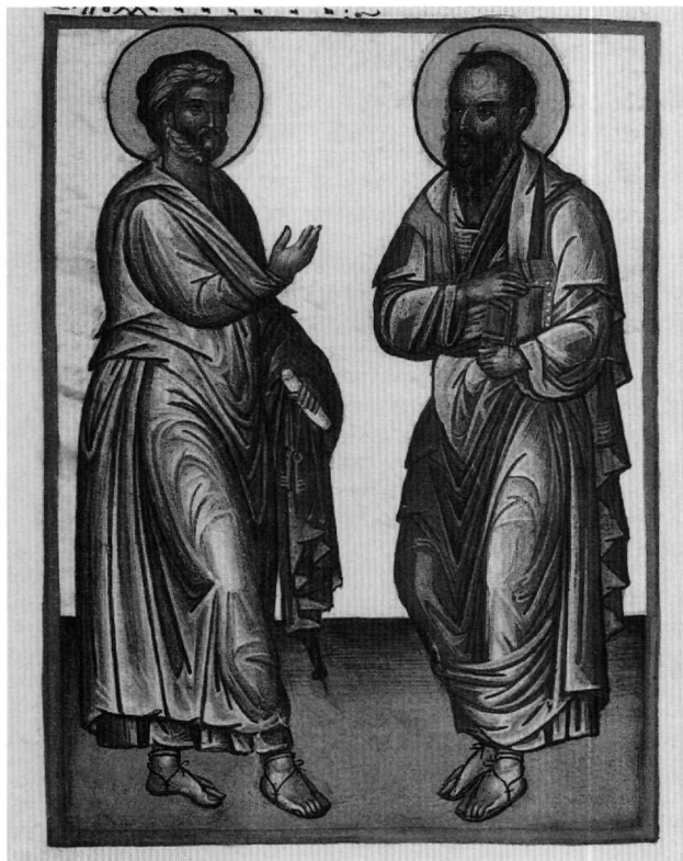
Εἰκ. 15. Οἱ ἅγιοι Πέτρος καὶ Παῦλος (φ. 348ν).

κρητικοὶ ζωγράφοι, ὅπως ὁ Θεοφάνης 99 . Ἡ χρυσογραφία ὁμως στὸν θώρακα καὶ ἡ ταινία μέ ψευδοαραβικά γράμματα κάτω ἀπὸ τὰ γόνατα φανερώνουν ἐπίδραση τοῦ ἰταλικοῦ Trecento 100 .