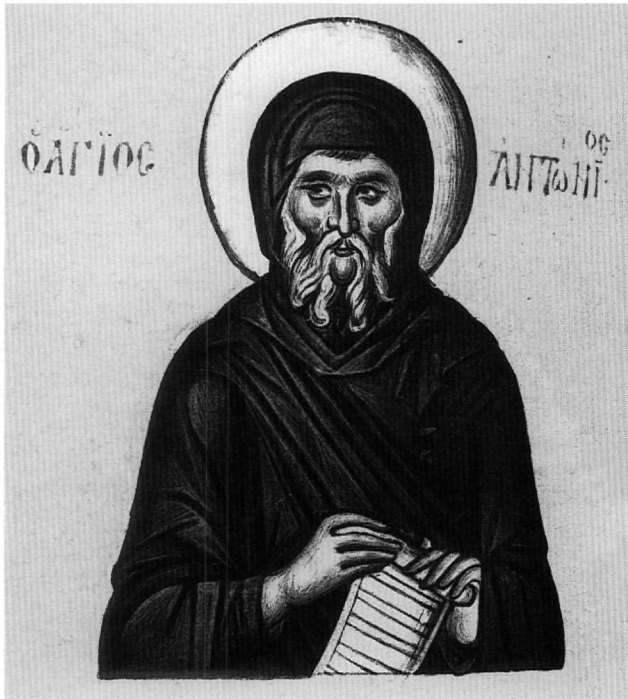
Εἰκ. 11. Ὁ ἅγιος Ἀντώνιος (φ. 239ν).

πού ἀποδίδεται στον Θεοφάνη 74 καί σέ δύο εἰκόνες τοῦ 17ου αἰώνα στήν Κέρκυρα, ἡ μία ἀπό τίς ὁποῖες εἶναι ἔργο τοῦ Ἑμμανουήλ Τζάνε 75 . Τήν ἴδια στάση ἔχει ὁ γυμνός Χριστός στίς εἰκόνες τοῦ Βυζαντινοῦ Μουσείου καί τῆς Μεγίστης Λαύρας, ἐνῶ τρεῖς ἢ τέσσερις ἄγγελοι εἰκονίζονται στοιχηδόν σέ κρητικές τοιχογραφίες τοῦ 15ου αἰώνα 76 καί στίς εἰκόνες τοῦ Βυζαντινοῦ Μουσείου, τῆς Μεγίστης Λαύρας, τῆς Κερκύρας. Στήν εἰκόνα τῶν Ἀθηνῶν, στήν μία ἀπό τίς κερκυραϊκές εἰκόνες καί στό ἀνθίβολο ὁ πρῶτος ἄγγελος ἔχει τήν μία φτερούγα σηκωμένη, ὅπως στήν μικρογραφία μας. Ἡ προσωποποίηση τοῦ Ἰορδάνη ἀπαντᾷ σέ ὅλες αὐτές τίς παραστάσεις. Ὁ ἅγιος Ἀντώνιος εἰκονίζεται στό φ. 239ν (Εἰκ. 11) κρατώντας ἀνεπτυγμένο εἰλητάριο, ὅπως συμβαίνει