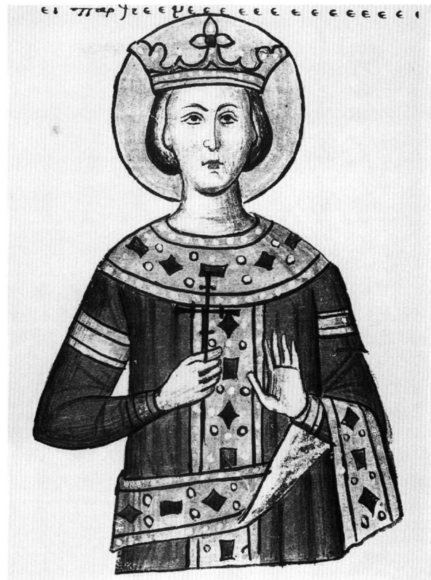
Εἰκ. 6. Ἡ ἅγια Αἰκατερίνη (φ. 123ν).

Στό φ. 103ν εἶναι ζωγραφισμένη σέ προτομή ἡ ἅγια Ἄννα (Εἰκ. 5), πού βαστά μέ τό αριστερό χέρι τήν μικρή Παναγία, ἡ ὁποία μέ τήν σειρά της κρατεῖ ἕνα ἄνθος, πού προφανῶς συμβολίζει τόν Χριστό 50 : Στόν κανόνα πού ψάλλεται στήν ἀκολουθία τοῦ Ἀκαθίστου ὕμνου διαβάζομε: Χαῖρε Θεόννυμφε, ἡ ράβδος ἡ μυστική, ἄνθος τό ἀμάραντον ἡ ἐξανθήσασα, καί Ρόδον τό ἀμάραντον χαῖρε ἡ μόνη βλαστήσασα 51 . Ἡ σύνθεση συναντᾶται στήν Κρήτη ἤδη τόν 14ο αἰώνα στήν Παναγία τήν Λαμπηνή 52 , ἀποκρυσταλλώνεται ὁμως σέ ἔργα τῆς κρητικῆς σχολῆς. Σέ εἰκόνες καί στόν τύπο ἀκριβῶς τῆς μικρογραφίας μας τήν συναντοῦμε στήν γνωστή εἰκόνα τοῦ 15ου αἰώνα τοῦ Μουσείου Μπενάκη μέ τήν πλαστή ὑπογραφή τοῦ Ἑμμανουήλ Τζάνε καί τήν ἐπίσης πλαστή χρονολογία 1637 53 , σέ εἰκόνα τῆς Συλλογῆς Οἰκονομοπούλου πού ἡ Χρ. Μπαλτογιάννη χρονολογεῖ στά τέλη τοῦ 16ου αἰώνα 54 , σέ εἰκόνα τοῦ σπηλαίου τῆς Ἀποκαλύψεως στήν Πάτμο, τήν ὁποία ὁ Χατζηδάκης τοποθετεῖ γύρω στό 1620 55 , καί σέ ἀδημοσίευστα ἔργα: εἰκόνα τοῦ 16ου αἰώνα πού κατεστράφη κατά τούς σεισμούς τοῦ 1953 στήν Ζάκυνθο 56 , εἰκόνα τῶν ἀρχῶν τοῦ 17ου αἰώνα στήν Μονή Σινᾶ 57 καί ναξιακή εἰκόνα, πού κατά τήν κυρία Μπαλτογιάννη ἀνάγεται στά τέλη τοῦ 17ου αἰώνα 58 . Ἡ μικρογραφία μας μοιάζει στήν πτυχολογία τῶν μαφοριῶν μέ τίς εἰκόνες τοῦ Μουσείου Μπενάκη καί τῆς Συλλογῆς Οἰκονομοπούλου, ἡ ἅγια Ἄννα