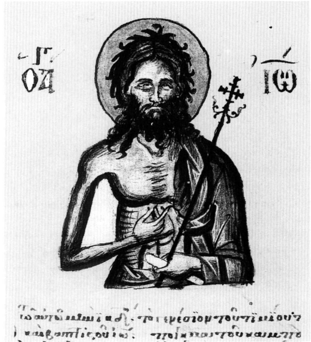
Εἰκ. 16. Ὁ ἅγιος Ἰωάννης ὁ Προδρόμος (φ. 340).

Οἱ κορυφαῖοι ἀπόστολοι Πέτρος καί Παῦλος (φ. 348ν, Εἰκ. 15) ἀπαντοῦν σέ δύο τύπους πού συναντῶνται συχνά σέ ἔργα κρητῶν ζωγράφων. Ὁ Πέτρος, μέ τό δεξι πόδι προτεταμένο, κρατεῖ κλειστό εἰλητάριο καί κλειδιά, καί ὑψώνει τό τυλιγμένο στό ἱμάτιο δεξι χέρι σέ χειρονομία λόγου. Τό πίσω μέρος τοῦ ἱματίου προεξέχει ἀφύσικα ἀπό τήν μέση καί κάτω. Ὁ Παῦλος κρατεῖ σφιχτά πάνω στό στήθος ὄρθιο κλειστό βιβλίον. Τόσο ὁ Πέτρος, τοῦ ὁποῦ ἡ μορφή πλαταίνει χαμηλά, ὅσο καί ὁ Παῦλος, τοῦ ὁποῦ τό περίγραμμα πλαταίνει τοῦναντίον στά ἰσχία καί στενεύει στά πόδια, ἔχουν παλαιολόγειες καταβολές 103 . Οἱ τύποι, πού ἀποκρυσταλλώθηκαν ἤδη στίς ἀρχές τοῦ 15ου αἰώνα, ἀπαντοῦν συχνά σέ κρητικά βημόθυρα, ἐπειδή οἱ κορυφαῖοι ἀπόστολοι εἶναι τά θεμέλια τῆς Ἐκκλησίας. Ἀπό τά ἀρχαιότερα παραδείγματα, μέ πιά ραδινές ὁμως ἀναλογίες, εἶναι τά βημόθυρα τῆς Συλλογῆς Οἰκονομοπούλου, τῆς πρώτης πεντηκονταετίας τοῦ 15ου αἰώνα 104 , καί ὁ ἅγιος Πέτρος στό βημόθυρο τοῦ Ἁγίου Γεωργίου τῶν Ἀπορθιανῶν ἢ τῆς Δημαρχίας στήν Πάτμο, πού ὁ Χατζηδάκης συσχετίζει μέ τόν Ἄνδρέα Ρίτζο 105 . στούς ἴδιους τύπους παριστάνονται οἱ κορυφαῖοι ἀπόστολοι τῶν βημοθύρων τοῦ Μιχαήλ Δαμασκηνοῦ στό σιναΐτικό μετόχι τῆς Ζακύν-