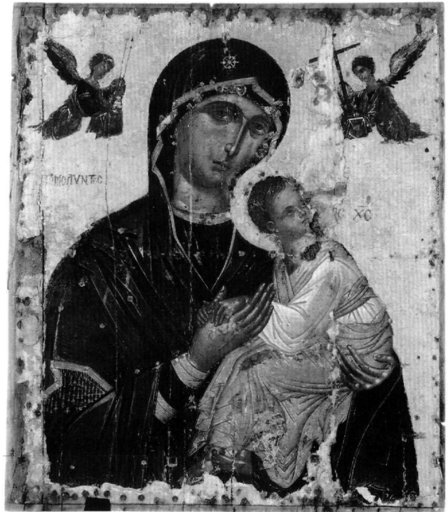
Εικ. 6. Μουσείο Ζακύνθου. Η Παναγία του Πάθους.

Η Παναγία εικονίζεται σε προτομή, με πορφυρό μαφόρι και βαθυπράσινο φόρεμα. Με έκφραση βαθιάς θλίψης γέρνει ελαφρά το κεφάλι προς το Βρέφος, που κάθεται άνετα στο αριστερό της χέρι. Φορεί λευκόφαιο χιτώνα, σταρόχρωμο μιάτιο με χρυσοκονδυλιές και κόκκινη ζώνη και κρατεί με τα δυο του χέρια το δεξί της μητέρας του. Τα πόδια του είναι σταυρωμένα, το δεξί πέλμα ανεστραμμένο, με λυμένο το σανδάλι. Το κεφάλι του στρέφεται ζωηρά και κοιτάζει με φόβο τον αρχάγγελο Γαβριήλ, που εικονίζεται στην πάνω δεξιά γωνία κρατώντας, με τα χέρια καλυμμένα από το μιάτιο, σταυρό. Στην αριστερή γωνία ο αρχάγγελος Μιχαήλ φέρει με όμοιο τρόπο σκεύος με το ξίδι και τη χολή, το σπόγγο και τη λόγχη. Στο χρυσό κάμπο της εικόνας, δεξιά, διακρίνονται ίχνη από το πεντάστιχο επίγραμμα, που κατά κανόνα συνοδεύει την παράσταση και συνδέει τον Ευαγγελισμό με το μελλοντικό Πάθος του Κυρίου, ενώ οι επιγραφές ΗΜΟΛΥΝΤΟC και ΙC ΧC είναι μεταγενέστερες προσθήκες.