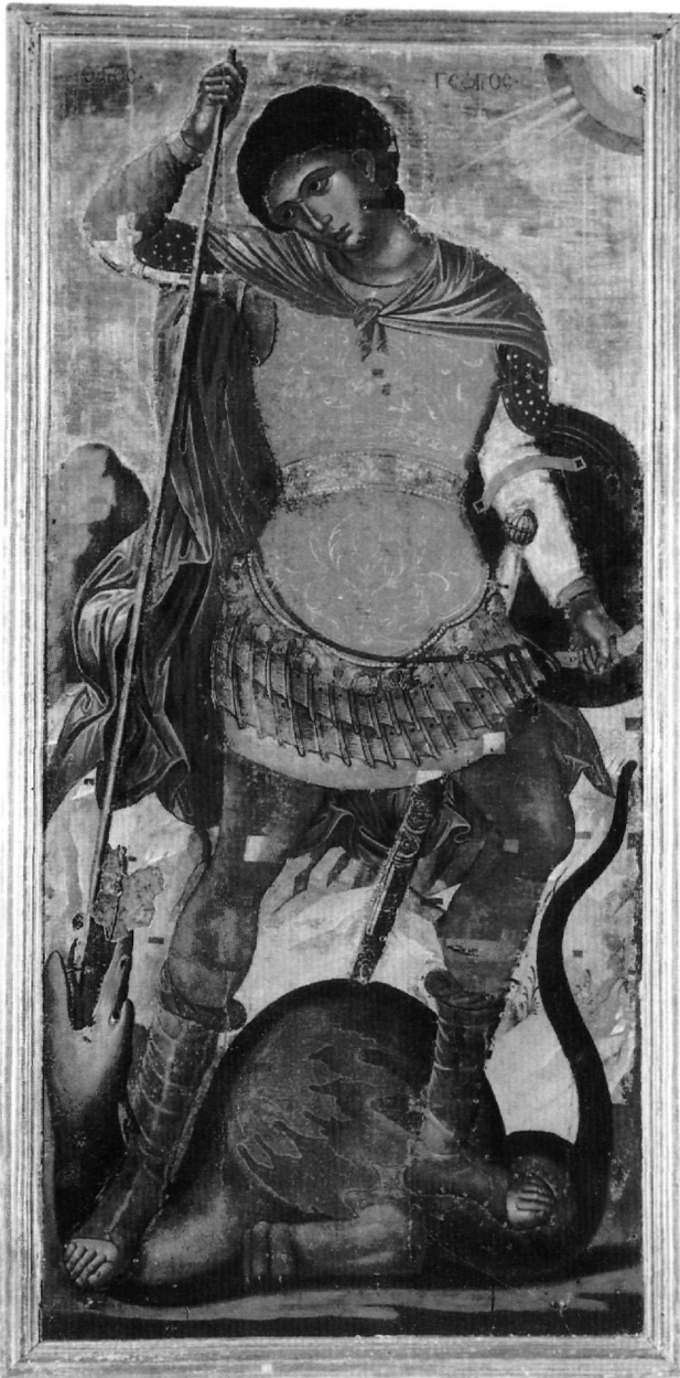
Εικ. 2. Μουσείο Ζακύνθου. Ο άγιος Γεώργιος δρακοντοκτόνος.

Ο άγιος εικονίζεται ολόσωμος, πεζός, κατά μέτωπο, αλλά με ζωηρή κίνηση. Πατεί και με τα δύο πόδια πάνω στο δράκο, καθώς βυθίζει το δόρυ στο ανοιχτό του στόμα. Η σκηνή διαδραματίζεται σε ορεινό, βραχώδες τοπίο, ενώ στην πάνω δεξιά γωνία, μέσα από τμήμα του ουράνιου κύκλου και πάνω στο χρυσό κάμπο τρεις φω-