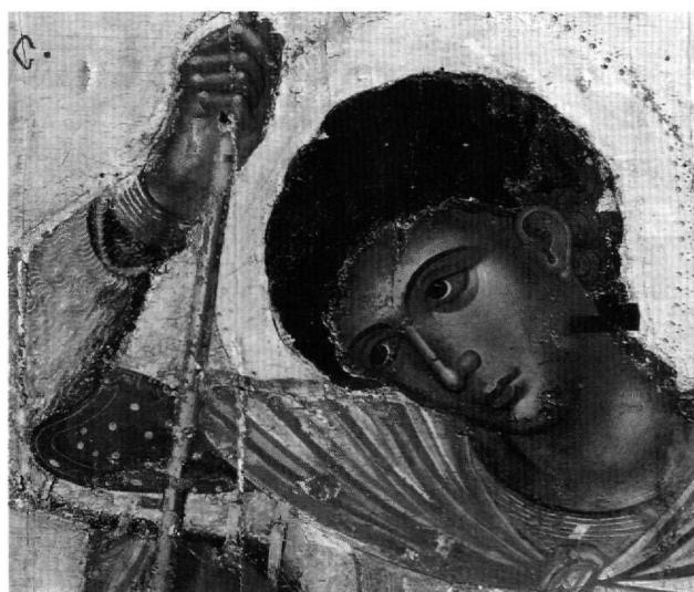
Εικ. 4. Μουσείο Ζακύνθου. Ο άγιος Γεώργιος. Λεπτομέρεια.

ματιού διατηρεί την ανάμνηση της βυζαντινής πτυχολογίας. Μία ακόμη διαφορά από την εικόνα της Πάτμου εντοπίζεται στη διακόσμηση της πανοπλίας· ενώ τα φυτικά θέματα είναι τα ίδια, παραλείπονται τα γεωμετρικά μοτίβα, πλην των ρόμβων της ζώνης, και οι πινελιές είναι πιο ελεύθερες, χωρίς τα γεμίματα και τις παχύρρευστες στιγμές 51 .