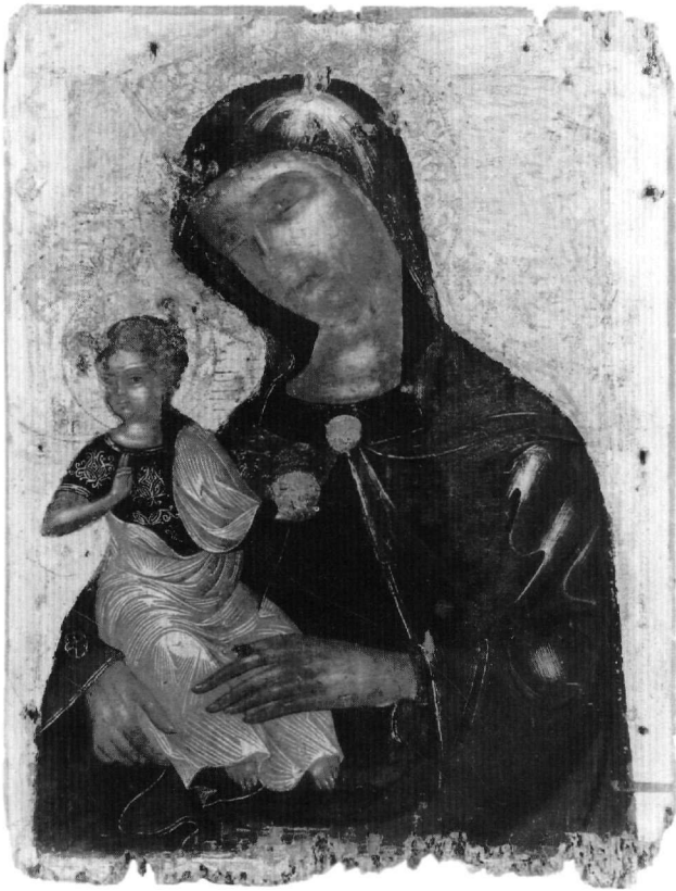
Εικ. 7. Μουσείο Ζακύνθου. Η Παναγία Madre della Consolazione .

νίζεται σε προτομή, κρατώντας στα δεξιά της το μικρό Χριστό στον προσφιλή σε καθολικούς και ορθόδοξους κύκλους τύπο της Madre della Consolazione 74 . Κύρια χαρακτηριστικά του τύπου είναι η αντικίνηση στο σώμα του παιδιού, καθώς με το αριστερό χέρι κρατεί χρυσή σφαίρα και με το δεξί ευλογεί στρέφοντας το κεφάλι προς το θεατή. Καθολικού τύπου το μαβί μαφόρι της Θεοτόκου πάνω από τη διάφανη καλύπτρα, κλείνει με δισκόμορφη χρυσή πόρπη ψηλά στο στήθος. Το χρώμα και ο τρόπος απόδοσης των πτυχώσεων παραπέμπουν στην υστερογοτθική τέχνη. Ο μαύρος χιτώνας του Χρι-