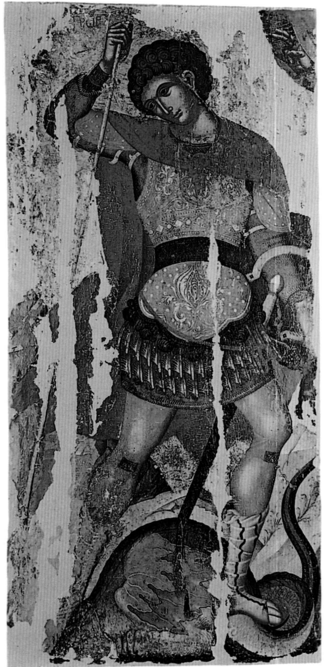
Εικ. 3. Πάτμος. Σκευοφυλάκιο μονής Αγίου Ιωάννη του Θεολόγου. Ο άγιος Γεώργιος δρακοντοκτόνος.

σκοτώσει το δράκο 38 . Εντούτοις δεν υπάρχουν πολλά παραδείγματα αυτής της εικονογραφίας, καθόσον από το 12ο αιώνα και μετά προτιμάται η σύνθεση του έφιππου δρακοντοκτόνου. Η παράσταση, που συμβολίζει το θρίαμβο του καλού εναντίον του κακού και κατάγεται από τη ρωμαϊκή εικονογραφία του πολεμιστή που ποδοπατά τον ηττημένο εχθρό του, χρησιμοποιείται στην παλαιοχριστιανική τέχνη 39 , αλλά και σε μεσοβυζαντινά χειρόγραφα σε απεικονίσεις του αρχαγγέλου Μιχαήλ 40 , του αγίου Θεοδώρου 41 και άλλων 42 , φαίνεται να αναβιώνει στη δυτική τέχνη το 14ο και το 15ο αιώνα 43 . Στη μεταβυζαντινή ζωγραφική τρεις ακόμη εικόνες, που χρονολογούνται στο 15ο αιώνα, παρουσιάζουν τον άγιο Γεώργιο πεζό δρακοντοκτόνο· η πρώτη βρίσκεται στο σκευοφυλάκιο της μονής του Θεολόγου στην Πάτμο 44 (Εικ. 3), η δεύτερη, που έχει αποδοθεί στον Άγγελο, στο Μουσείο Μπενάκη 45 και η τρίτη, που αποτελεί πιθανώς φύλλο διπτύχου, στη Συλλογή Λάτση 46 , όπου δίπλα στο Γεώργιο με ανάλογη στάση εικονίζεται ο άγιος Μερκούριος φονεύων τον Ιουλιανό τον Παραβάτη. Δύο ακόμη παραδείγματα, του 17ου αιώνα στο Ιστορικό Μουσείο στην Κρήτη 47 και του 18ου στο