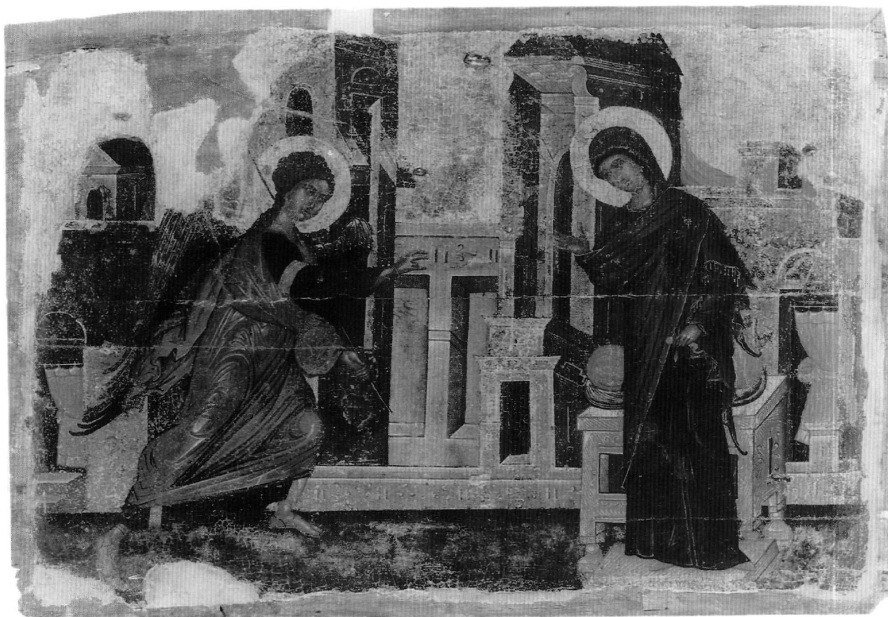
Εικ. 1. Μουσείο Ζακύνθου. Ο Ευαγγελισμός της Θεοτόκου.

του αρχιτεκτονικού βάθους. Πίσω από την Παναγία υπάρχει ψηλό κτίριο με αετωματική στέγη και προστώο, που προεκτείνεται μπροστά, σε χαμηλότερο ύψος, με ορθογώνια κόγχη. Από πίσω προβάλλει πυργόσχημο οικοδόμημα, από το οποίο κρέμονται κόκκινα υφάσματα, ενώ βήλα κλείνουν το τοξωτό θύρωμα στο άκρο. Με αντίθετη προοπτική πίσω από τον άγγελο αποδίδεται άλλο ψηλό κτίριο και προς το άκρο κτίσμα με αετωματική στέγη. Τα δύο κτιριακά συγκροτήματα, με έντονες φωτοσκιάσεις στις ορθογώνιες ή τοξωτές εσοχές, συνδέονται από χαμηλότερου ύψους τοίχο σε φωτεινότερο χρώμα, στον οποίο διαγράφονται ψηλές ορθογώνιες κόγχες. Όλα τα οικοδομήματα έχουν σε