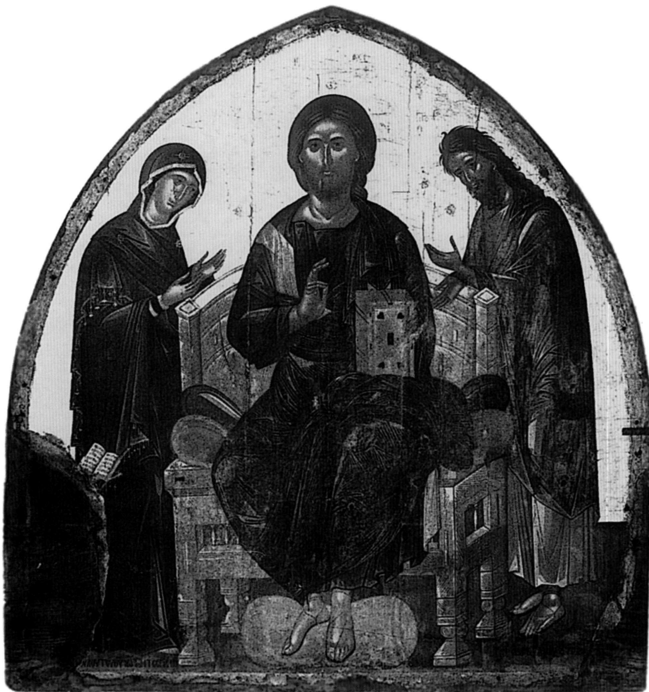
Εικ. 1. Κέρκυρα, Μουσείο Αντιβοννιώτισσας. Εικόνα Δέησης, έργο του Νικολάου Τζαφούρη.