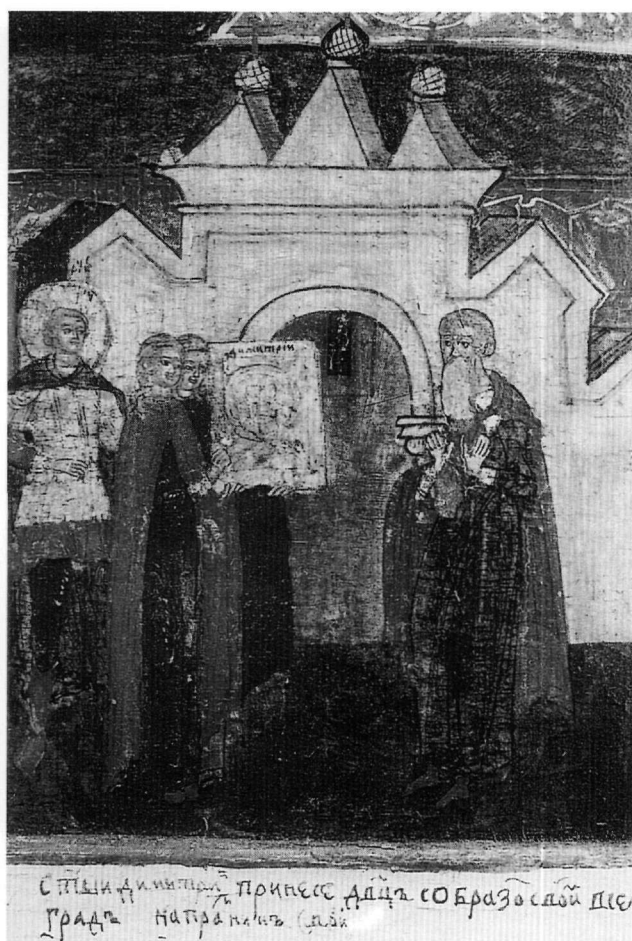
Fig. 6. Deux vierges et saint Démètre dans la basilique saint-Démètre. Détail de la même icône (Fig. 5).

du musée de l'Ermitage 14 . Sur la première (Fig. 5) les brodeuses sont assises et se penchent sur le métier où figure le dessin au trait du buste de saint Démètre rappelant le Christ Emmanuel. Leur pose – une main sous le visage l'autre main tenant le métier – exprime l'affliction. En dessous, on lit l'inscription suivante : « Les jeunes vierges ont brodé l'image de saint Démètre sur l'instance du chef militaire, elles ont pleuré et se sont endormies ». Sur la deuxième (Fig. 6) la basilique de Thessalonique est figurée sous une forme stylisée ;