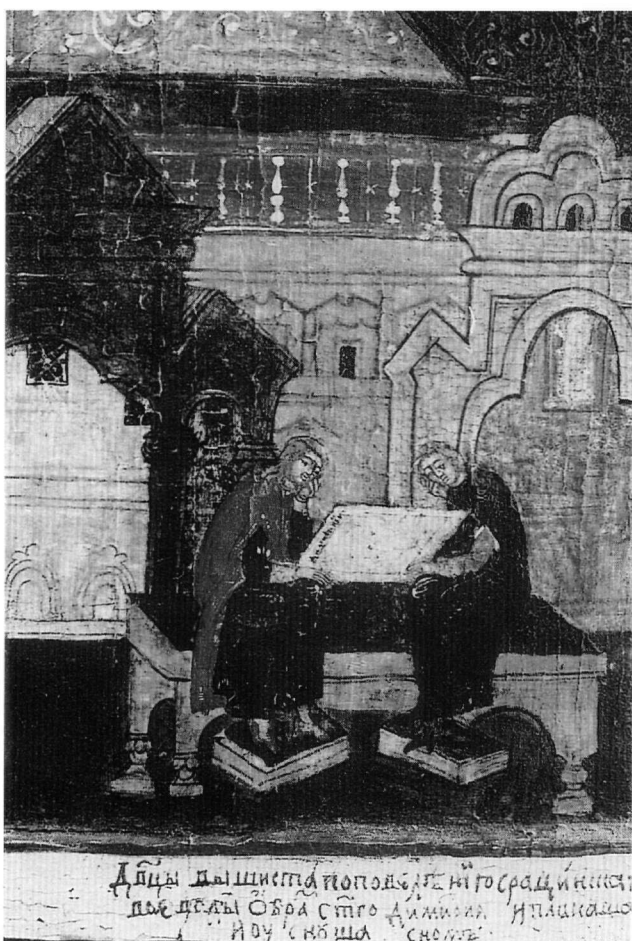
Fig. 5. Deux vierges brodeuses pleurent après avoir terminé leur travail de broderie. Détail d'une icône de Russie du Nord. Début du XVIIIe siècle. Saint-Pétersbourg, Ermitage.

du musée de l'Ermitage 14 . Sur la première (Fig. 5) les brodeuses sont assises et se penchent sur le métier où figure le dessin au trait du buste de saint Démètre rappelant le Christ Emmanuel. Leur pose – une main sous le visage l'autre main tenant le métier – exprime l'affliction. En dessous, on lit l'inscription suivante : « Les jeunes vierges ont brodé l'image de saint Démètre sur l'instance du chef militaire, elles ont pleuré et se sont endormies ». Sur la deuxième (Fig. 6) la basilique de Thessalonique est figurée sous une forme stylisée ;