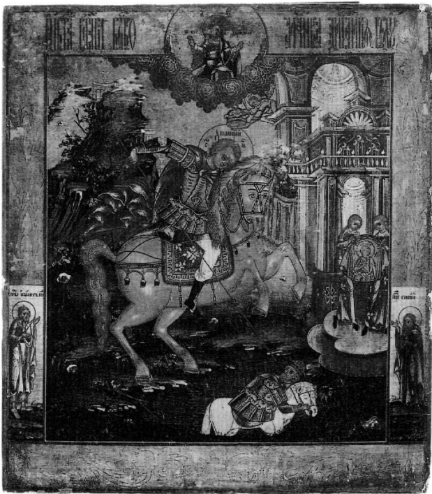
Fig. 8. Saint Démètre terrassant Mamaï. A droite, deux vierges portant la toile miraculeuse. Icône de la fin du XVIIIe-début du XIXe siècle. Vicenza, collection de la banque « Intesa » (Galerie du Palazzo Leoni Montanari).

tion des réalités d'une des plus grandes villes du monde orthodoxe, Thessalonique.