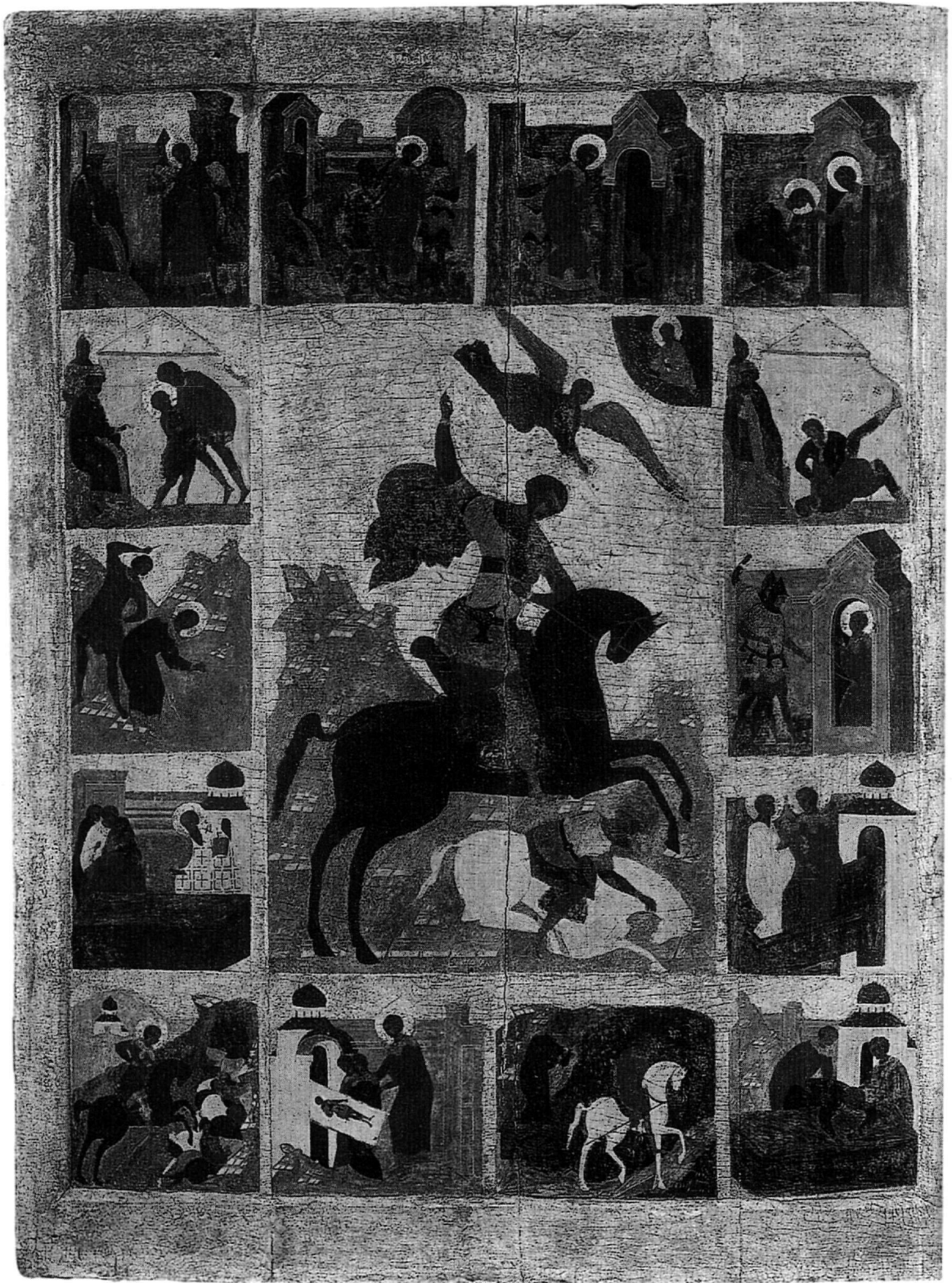
Fig. 3. Saint Démètre à cheval, encadré de scènes de sa vie et de ses miracles. Première moitié du XVIe siècle. Musée de Nijni Novgorod.