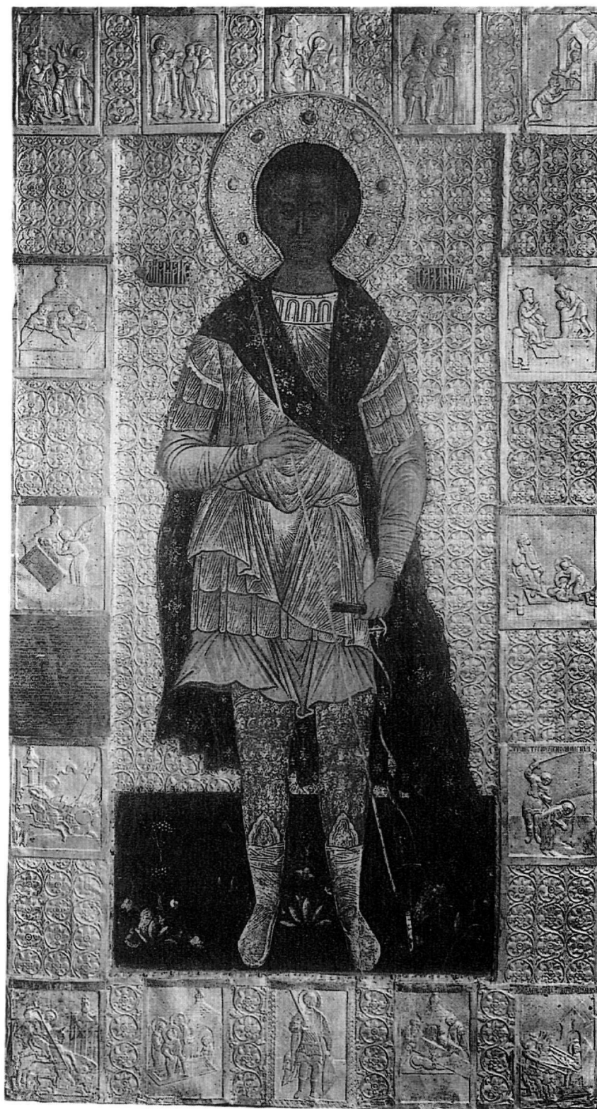
Fig. 1. Saint Démètre : scènes de sa vie et de ses miracles. 1586. Icône commandée par le boyard Dimitri Godounov. Moscou, monastère de Novodevitchij.