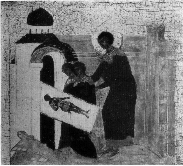
Fig. 4. Le miracle de deux vierges de Salonique. Détail de l'icône du Fig. 3.

en boucles sur les épaules. Saint Démètre, dont les pans de la tunique volent au vent comme s'il venait de se poser sur terre, soutient l'une d'elles. Au second plan, apparaît une église coiffée d'une petite coupole, symbolisant la basilique Saint-Démètre à Thessalonique. L'encadrement en argent s'étant dégradé au fil du temps, la partie inférieure de la composition a été remplacée par une plaque lissée, également en argent. La représentation de l'icône brodée par les deux vierges, gravée sur une mince plaque d'argent, a été fixée ultérieurement par quatre petits clous. Une inscription court sur la partie supérieure: « Saint Démètre a sauvé les vierges des Sarrasins ».