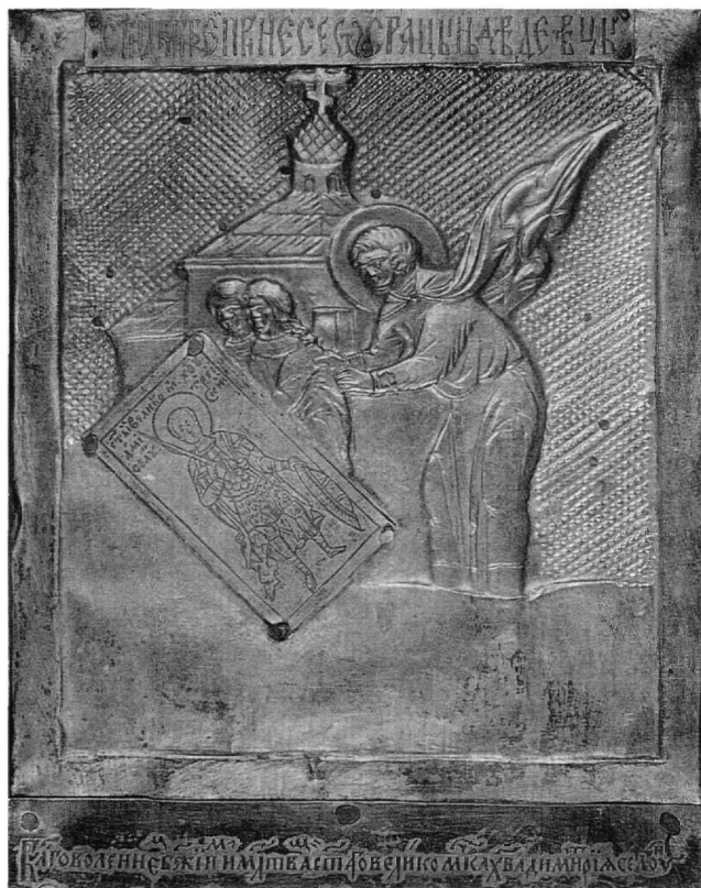
Fig. 2. Le miracle de deux vierges. Détail de l'icône du Fig. 1.

Le fait que le Ménologe (Čtj Minéi) l'évoque a contribué à sa popularité. Une « toile miraculeuse » de saint Démètre fut rapportée du Mont Athos à Moscou en 1628 il s'agit vraisemblablement, d'une copie de l'icône brodée du saint 4 . Aux