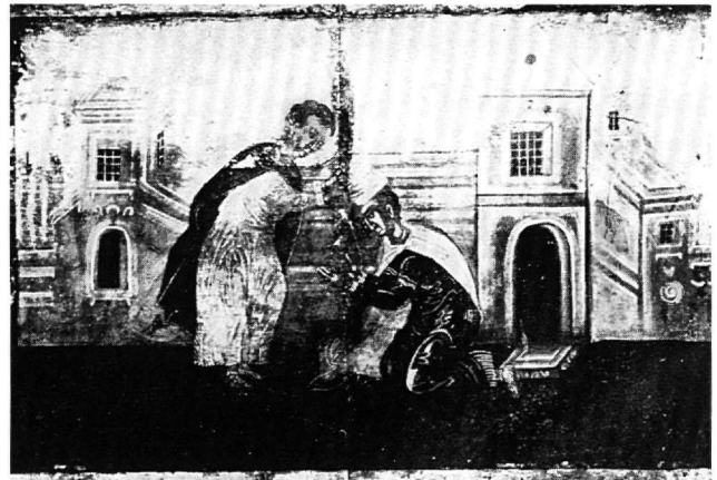
Εικ. 7. Εικόνα στο ναό της Αγίας Ελένης, κάστρο Χώρας Μυκόνου. Η σκηνή της ευλογίας του αγίου Νέστορος (Ξυγούπουλος, πίν. VI).

Ωστόσο, η περιγραφή της συγκεκριμένης σκηνής από τον Διονύσιο τον εκ Φουρνά στην Ερμηνεία της ζωγραφικής τέχνης είναι διαφορετική: Ὁ ἅγιος Νέστωρ γονατιστός, ἔχων ὑψωμένα τὰ χέρια κι ἔμπρὸς αὐτοῦ λουτρὸν καὶ ἀπὸ τὸ παράθυρον τοῦ λουτροῦ ὀλίγο φαινόμενος ὁ ἅγιος Δημήτριος εὐλογεῖ αὐτόν 12 . Ασφα-