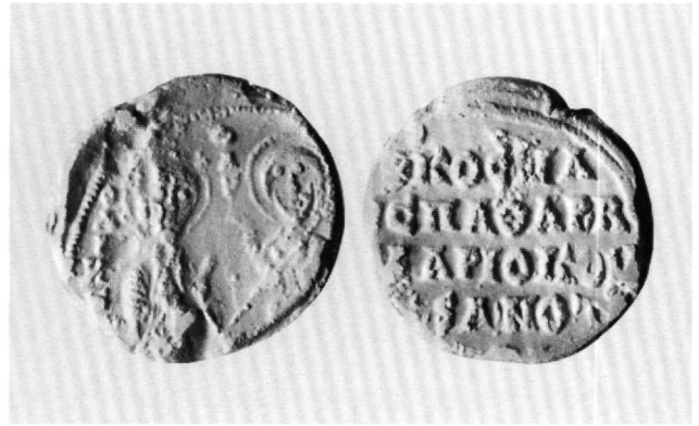
Εικ. 3. Εκμαγείο από το μολυβδόβουλλο του Κοσμά, σπαθαροκουβικουλαρίου, κοιτωνίτη (;) και πρωτονοταρίου. Αθήνα, Νομισματικό Μουσείο (ΑΗ10/1931).