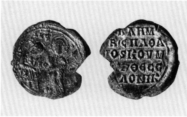
Εικ. 1. Μολυβδόβουλλο του Κλήμεντος, βασιλικού σπαθαρίου και κομμερκαρίου Θεσσαλονίκης. Dumbarton Oaks Collection, Fogg 1775 (DOSeals, 1, αριθ. 18.37).