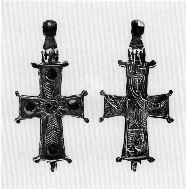
Εικ. 4. Σταυρός-λειψανοθήκη. Α' όψη: Σταυρός από φύλλα φοίνικος. Β' όψη: Άγιος.