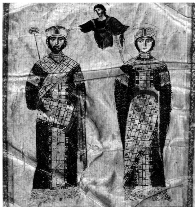
Εικ. 6. Μικρογραφία με την παράσταση της στέψης-εulογίας του Μιχαήλ Ζ Δούκα και της Μαρίας της Αλανίας. Κώδικας Coislin 79, φ. 1ν (1077-1078). Παρίσι, Εθνική Βιβλιοθήκη.

κίδιο αυτό, μαζί με άλλα τέσσερα σμάλτα που έχουν επίσης τοποθετηθεί στο τρίπτυχο του Khakhuli, προέρχεται από ένα έργο τέχνης, πιθανότατα ένα στέμμα, που φιλοτεχνήθηκε στο διάστημα 1071-1078 και στάλθηκε ως δώρο στη Γεωργία, πατρίδα της Μαρίας 42 .