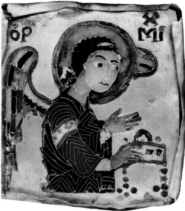
Εικ. 4. Πλακίδιο από σμάλτο με τη μορφή του αρχαγγέλου Μιχαήλ (1071-1078). Τρίπτυχο του Khakhuli, Τιφλίδα, Κρατικό Μουσείο Καλών Τεχνών.

καθαίρεσή του δόθηκε στον επόμενο αυτοκράτορα Νικηφόρο Βοτανειάτη. Οι τέσσερις μικρογραφίες του χειρογράφου με τη μορφή του προηγούμενου αυτοκράτορα δεν αντικαταστάθηκαν. Κρίθηκε αρκετό να αλλάχουν οι επιγραφές και να αλλοιωθούν τα χαρακτηριστικά του προσώπου του Μιχαήλ Δούκα, για να μεταμορφωθεί σε Νικηφόρο Βοτανειάτη 38 , με αποτέλεσμα, εκτός των άλλων, ο αρχάγγελος Μιχαήλ να φέρεται πλέον στη μικρογραφία ως φύλακας και προστάτης του νέου αυτοκράτορα. Αξίζει να σημειωθεί ότι ο σφετεριστής Βοτανειάτης κατά την πορεία του προς την Κωνσταντινούπολη τον Μάρτιο του 1078, με σκοπό την κα-