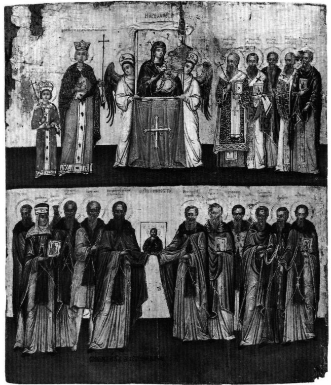
Εικ. 3. Εμμανουήλ Τζανφουρνάρη: Η Κυριακή της Ορθοδοξίας. Βενετία, Ελληνικό Ινστιτούτο.

1631) (Εικ. 3) 9 . Από τις δύο αυτές εικόνες, η πρώτη βρίσκεται πολύ κοντά στην εικόνα του Βρετανικού Μουσείου, σε βαθμό ώστε η Χατζηδάκη να υποστηρίξει τη χρήση κοινού αντιβόλου 10 . Αντίθετα, η εικόνα που φιλοτέχνησε ο Τζανφουρνάρης διακρίνεται για διαφορετικές επιλογές ως προς τους εικονιζόμενους και κατ' ακολουθίαν μόνον υποβοηθητικά μπορεί να αξιοποιηθεί 11 . Στην επάνω ζώνη της εικόνας του Βρετανικού Μουσείου και αριστερά της εικόνας της Θεοτόκου βρίσκονται