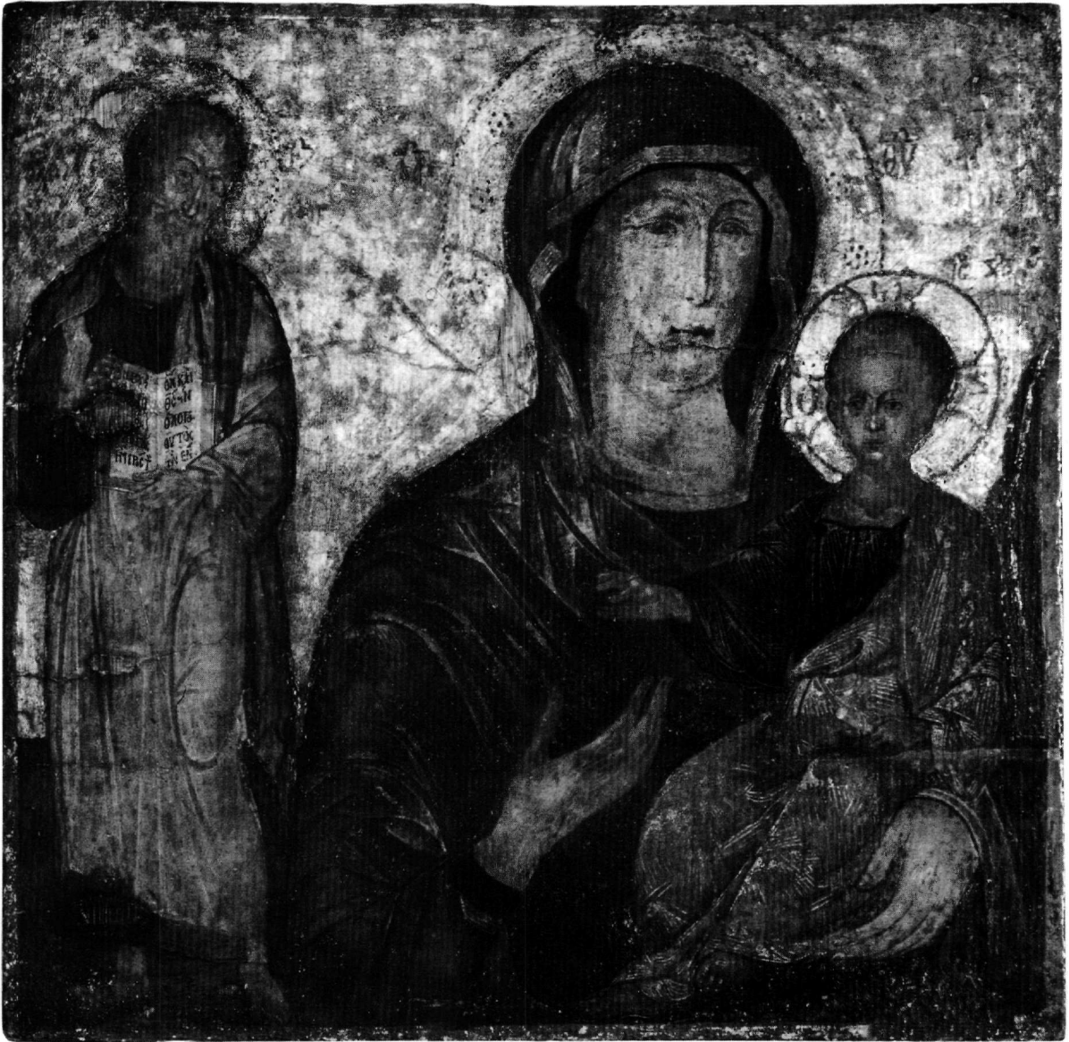
Εικ. 1. Εκκλησιαστικό Μουσείο Σερρών. Εικόνα της Παναγίας Οδηγήτριας με τον άγιο Ιωάννη τον Θεολόγο.

φρά, τα γραμμικά λευκά φώτα που πλάθουν και εξαίρουν τους όγκους των επιμέρους χαρακτηριστικών, η οργανική και ρέουσα πτυχολογία, όπως και οι πυκνές χρυσοκονδυλίες, συνεισφέρουν θετικά στη χρονολόγηση της εικόνας –παρά την παρουσία διάσπαρτων επιζωγραφήσεων– στα τέλη του 15ου-αρχές του 16ου αιώνα 6 .