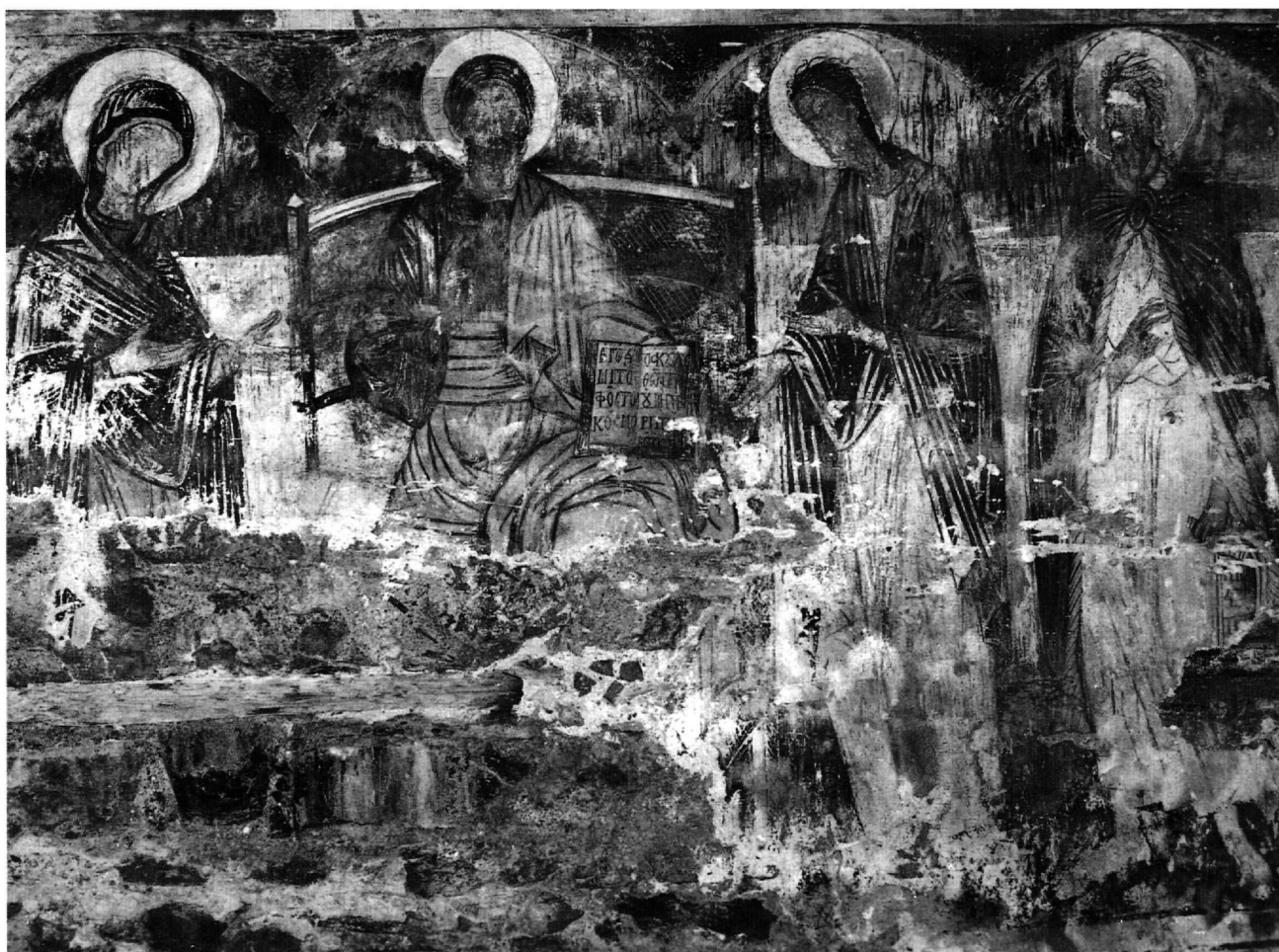
Εικ. 2. Η Δέηση.

σχετισθεί και η Μεταμόρφωση, η οποία εικονίζεται έξω από τη συνηθισμένη της θέση, ανάμεσα στη Βαΐοφόρο και το Μυστικό Δείπνο. Με τον τρόπο αυτό ο ζωγράφος αφενός τονίζει το δοξαστικό, αποκαλυπτικό περιεχόμενο της σκηνής 17 ξεφεύγοντας από την ιστορική διαδοχή των γεγονότων και αφετέρου την εξαιρεί τοποθετώντας την στο κέντρο της ενότητας των Παθών.