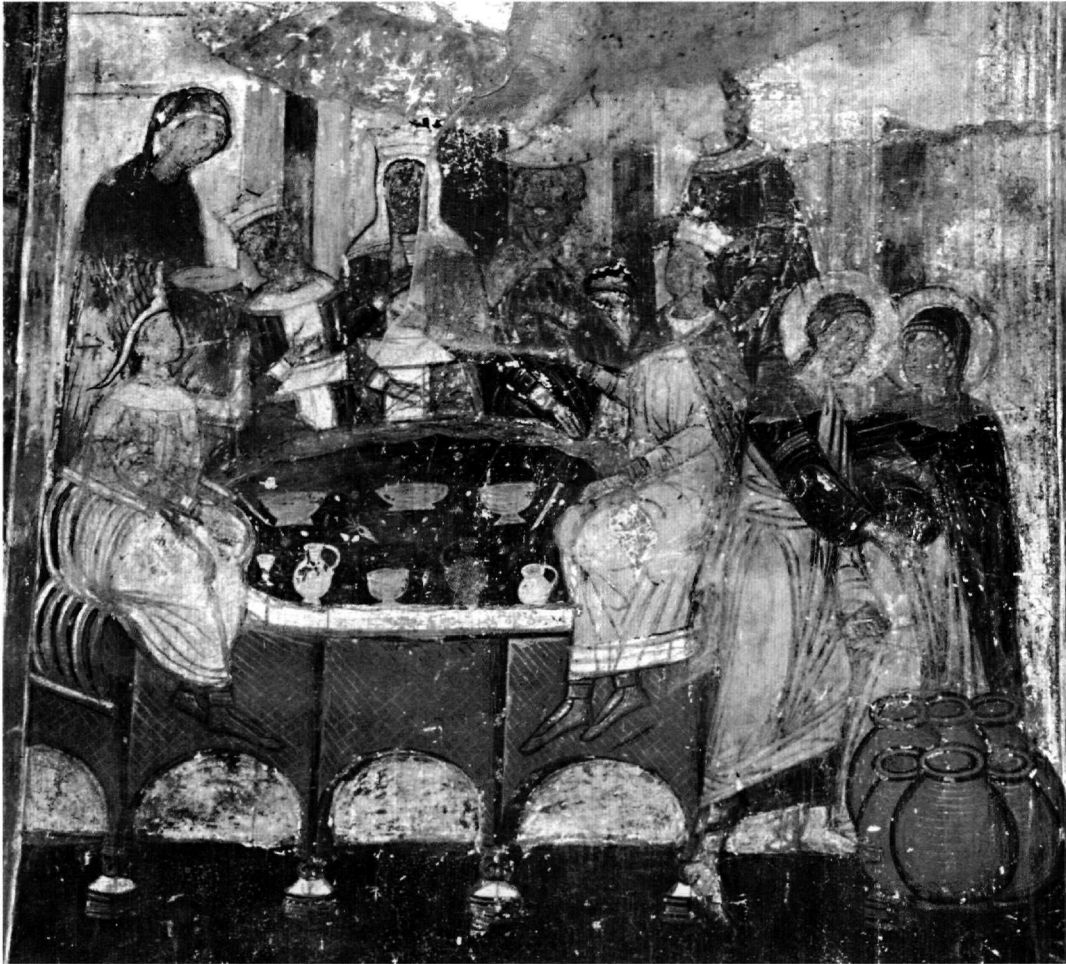
Εικ. 5. Ο εν Κανά Γάμος.

στάσεις όπου εκτυλίσσονται χωριστά τα δύο επεισόδια του δείπνου και του θαύματος, σύμφωνα με τα παλαιολόγια πρότυπα αλλά στη μεταβυζαντινή παραλλαγή τους, με απεικόνιση του Χριστού και της Θεοτόκου μόνο στο θαύμα και όχι στο δείπνο 27 . Η παραλλαγή αυτή, που θεωρήθηκε ότι πρωτοσυναντάται στη Δολίχη, σημαντικό θεσσαλικό μνημείο των αρχών του 16ου αιώνα (1512), συνηθίζεται στα μνημεία της σχολής της βορειοδυτικής