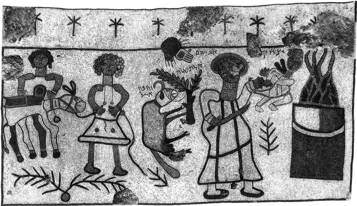
Εἰκ. 5. Ψηφιδωτό δαπέδου. Συναγωγή στό Beth Alpha.

κλειστικά σέ εἰκονογραφημένα χειρόγραφα. Σέ μιά μικρογραφία ἀπό τό ἀντίγραφο τῆς Χριστιανικῆς Τοπογραφίας τοῦ Κοσμᾶ τοῦ Ἰνδικοπλευστή (9ος αἰ.) ὁ κριός εἰκονίζεται στό κάτω ἀριστερό μέρος τῆς παράστασης, δεμένος μέ τενωμένο σχοινί σέ δέντρο πού μοιάζει μέ κυπαρίσσι (Εἰκ. 6) 15 . Ὁμοιότητες παρουσιάζει ἡ ἀπεικόνιση τοῦ κριοῦ καί στό εὐαγγέλιο τοῦ Ἐτοματισίν 16 (τέλη 10ου αἰ.). Τέλος, ἡ θυσία τοῦ Ἀβραάμ ἀπαντᾷ καί σέ μιά ομάδα ἀπό ὀκτατεύχους τοῦ 12ου αἰώνα 17 , στίς ὁποῖες τό θέμα ἀποδίδεται ἀφηγηματικά σέ τέσσερις ξεχωριστές μικρογραφίες, ὅπου ἀρχικά ἀπεικονίζονται ἡ σκηνή τῆς ἐτοιμασίας καί ἡ πορεία πρὸς τόν τόπο τῆς θυσίας. Στήν τρίτη κατά σειρά μικρο-