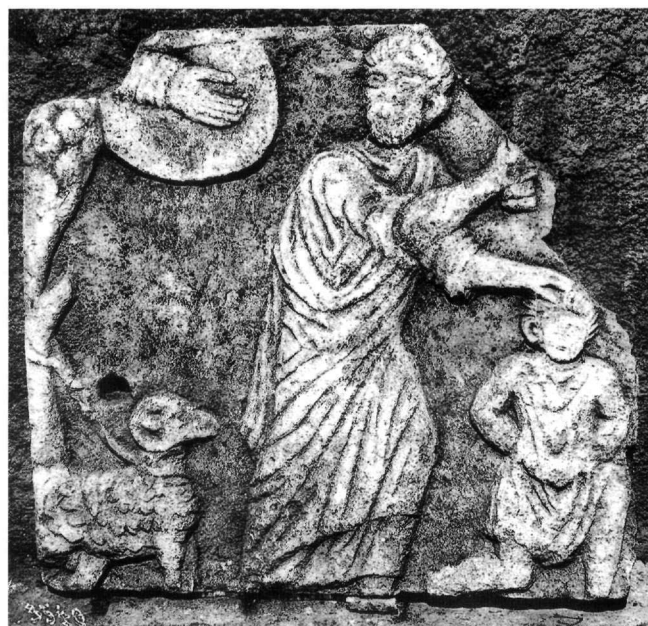
Εἰκ. 2. Τμήμα ψευδοσαρκοφάγου. Κωνσταντινούπολη, Ἀρχαιολογικὸ Μουσεῖο, ἀριθ. 4141.

ἀπόδοση τοῦ κριοῦ, παρουσιάζει καί ἡ παράσταση τῆς θυσίας στὴν τράπεζα τῆς μονῆς τοῦ Ἁγίου Ἱερεμία στὴ Σακκαρά, πού βρίσκεται σήμερα στό Μουσεῖο τοῦ Καΐρου 5 . Στὴν ἴδια περίπου ἐποχὴ (τέλη 4ου-ἀρχές 5ου αἰ.) χρονολογεῖται καί ἓνα φυλακτό στό Βρετανικὸ Μουσεῖο, πιθανότατα κυπριακῆς προέλευσης, πού στὸν ὀπισθότυπό του φέρει τὴν ἐπιγραφή: EIC ΘΕΟC ΕΝ ΟΥΡΑΝΩ 6 . Ἐπιπλέον, σέ μιά ομάδα σαρκοφάγων πού χρονολογοῦνται ὅλες στό πρῶτο μισό τοῦ 5ου αἰώνα, ὁ