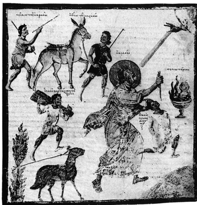
Εἰκ. 6. Μικρογραφία ἀπό ἀντίγραφο τῆς «Χριστιανικῆς Τοπογραφίας» τοῦ Κοσμᾶ τοῦ Ἰνδικοπλεύστη, Vat. gr. 699 , φ. 78r.

Ἐπιπλέον, τό ἐπιχείρημα πού ἀναφέρεται συχνά γιά τή συσχέτιση τῆς εἰκονογραφίας τοῦ κριοῦ μέ τίς ἑβραϊκές παραδόσεις, ὅτι δηλαδή ὁ νέος εἰκονογραφικός τύπος ἀπαντᾷ σέ πρῶμες ἑβραϊκές παραστάσεις τῆς θυσίας τοῦ Ἀβραάμ, πού πιθανόν νά ἐπηρεάσαν τήν ἀπόδοση τοῦ θέματος στή χριστιανική τέχνη, δέν εὐσταθεῖ 23 . Μετά ἀπό προσεκτική παρατήρηση προκύπτει ὅτι στήν τοιχογραφία τῆς συναγωγῆς τῆς Δούρας-Εὐρωποῦ ὁ κριός δέν ἀπεικονίζεται δεμένος σέ δέντρο 24 , ὅπως εἶχε διατυπωθεῖ παλαιότερα 25 . Ἀκόμη, τό ψηφιδωτό στή συναγωγή τοῦ Beth Alpha, ὅπου ἡ εἰκονογραφία τοῦ θέματος ἐμφανίζεται παραλλαγμένη σέ σχέση μέ τίς χριστιανικές παραστάσεις, χρονολογεῖται στόν 6ο αἰώνα, δηλαδή ἀποτελεῖ