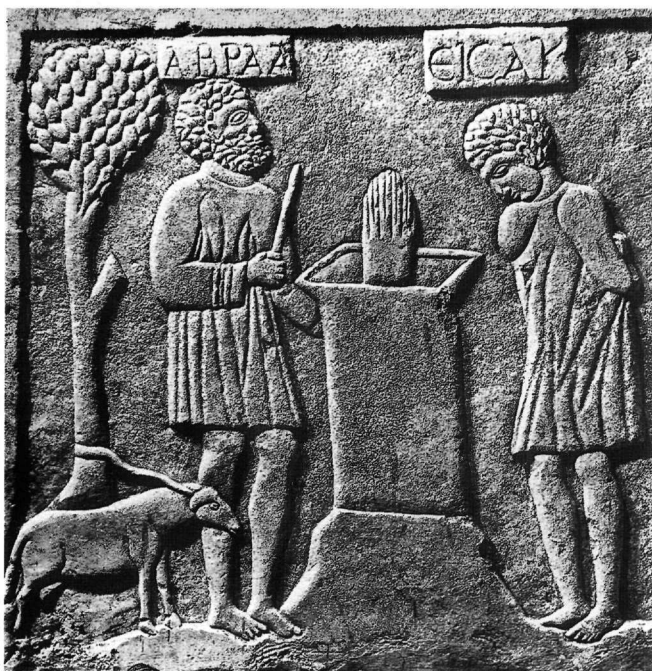
Εἰκ. 3. Τμήμα σαρκοφάγου. Esija, ναός Santa Cruz.