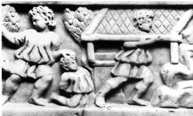
Εἰκ. 1. Λεπτομέρεια ἀπὸ κάλυμμα σαρκοφάγου. Le Mas d'Aire , ναὸς Sainte-Pierre , κρύπτη Sainte-Quitterie .