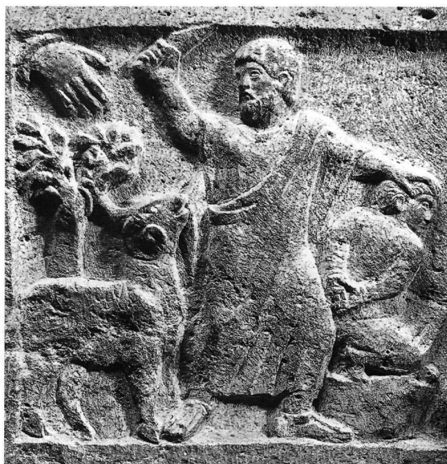
Εἰκ. 4. Τμήμα σαρκοφάγου. Μασσαλία, ναός Ἁγίου Βίκτωρος.

λυμμα τῆς ὁποίας ὑπῆρχε παράσταση τῆς θυσίας τοῦ Ἄβραάμ μέ τόν κριό δεμένο σέ δέντρο 11 .