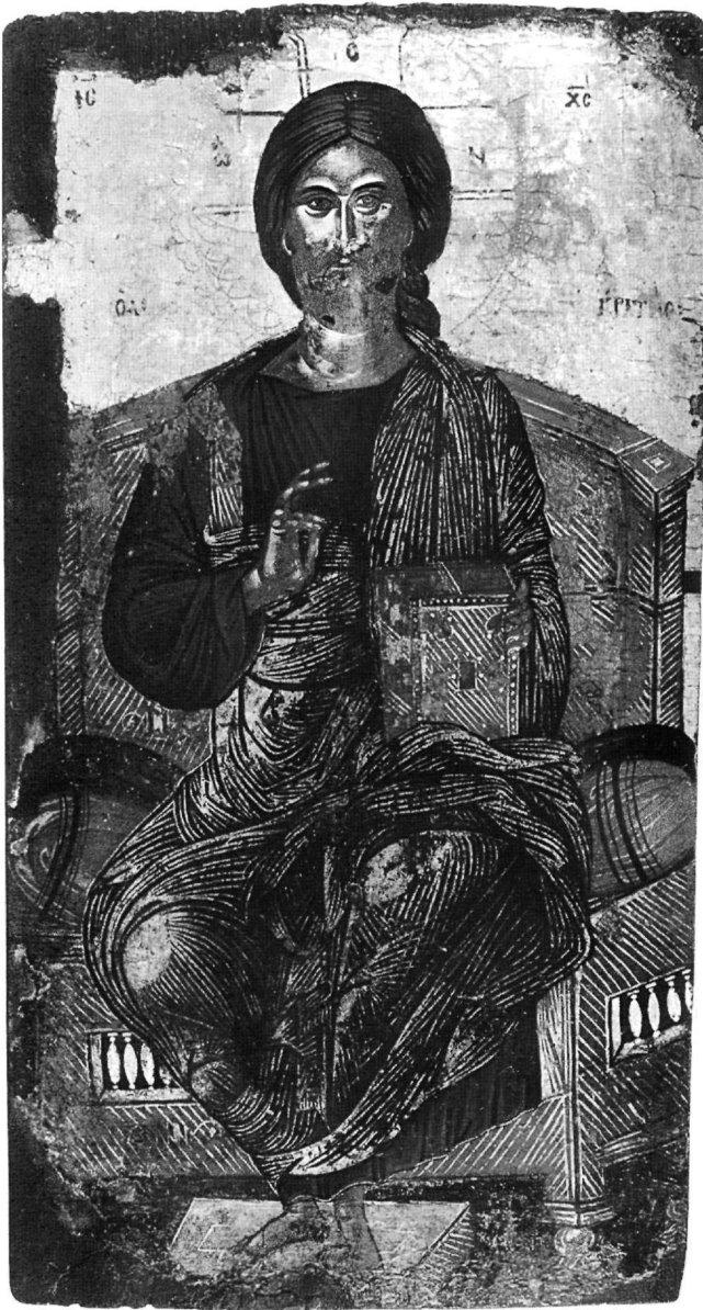
Εικ. 1. Ναός Αγίου Δημητρίου Αθύτου. Εικόνα του Χριστού Δίκαιου Κριτή.