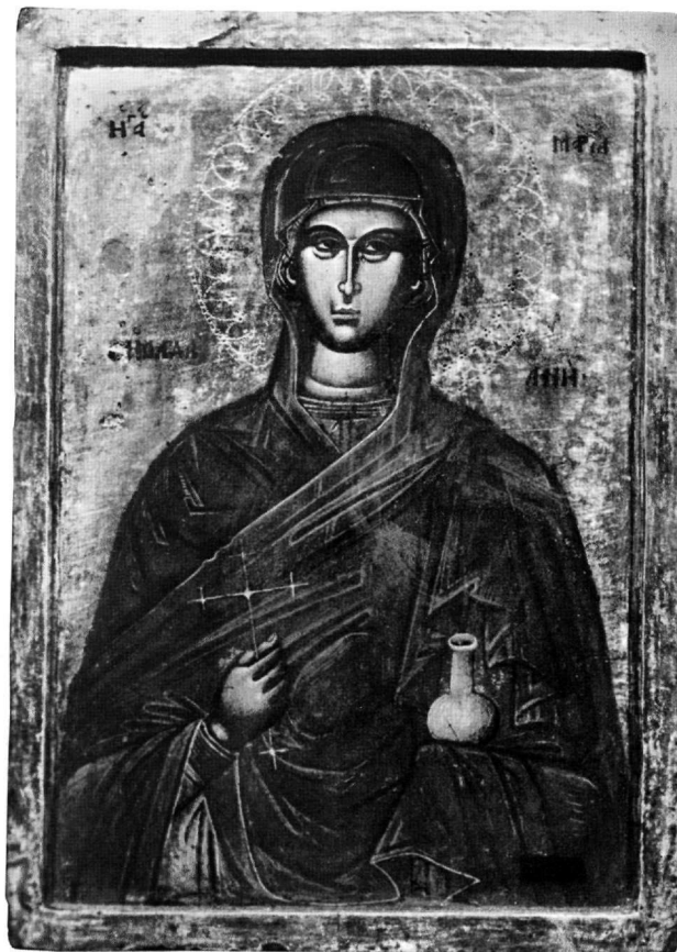
Εικ. 5. Μονή Διονυσίου Αγίου Όρους. Εικόνα της αγίας Μαρίας της Μαγδαληνής.

στην πίσω πλευρά της εικόνας ταυτίζει τη σκηνή με το σπάνιο εικονογραφικό θέμα της Μεσοπεντηκοστής 37 . Εδώ ο Χριστός καθισμένος σε ψηλό θρόνο και κάτω από κιονοστήριχο ρόδινο κιβώριο, σε ώριμη πλέον ηλικία, δεσπόζει στο κέντρο της σύνθεσης. Είναι ντυμένος με κόκκινο, στο χρώμα του κρασιού, χιτώνα και πράσινο μάτιο διανθισμένο με χρυσοκονδυλιές, έχει το δεξί χέρι υψωμένο σε θέση διδασκαλίας και κρατεί με το αριστερό ανοιχτό ειλητάριο με το ακόλουθο ευαγγελικό χωρίο: Ο ΔΙΨΩΝ / ΕΡΧΕΘΩ / ΠΡΟΣ ΜΕ / Κ(ΑΙ) ΠΙΝΕΤΩ (Ιω. ζ', 36). Πίσω από το χρυσομένο σύνθρονο παρατάσσονται οι μαθητές του Ιησού, χωρισμένοι σε