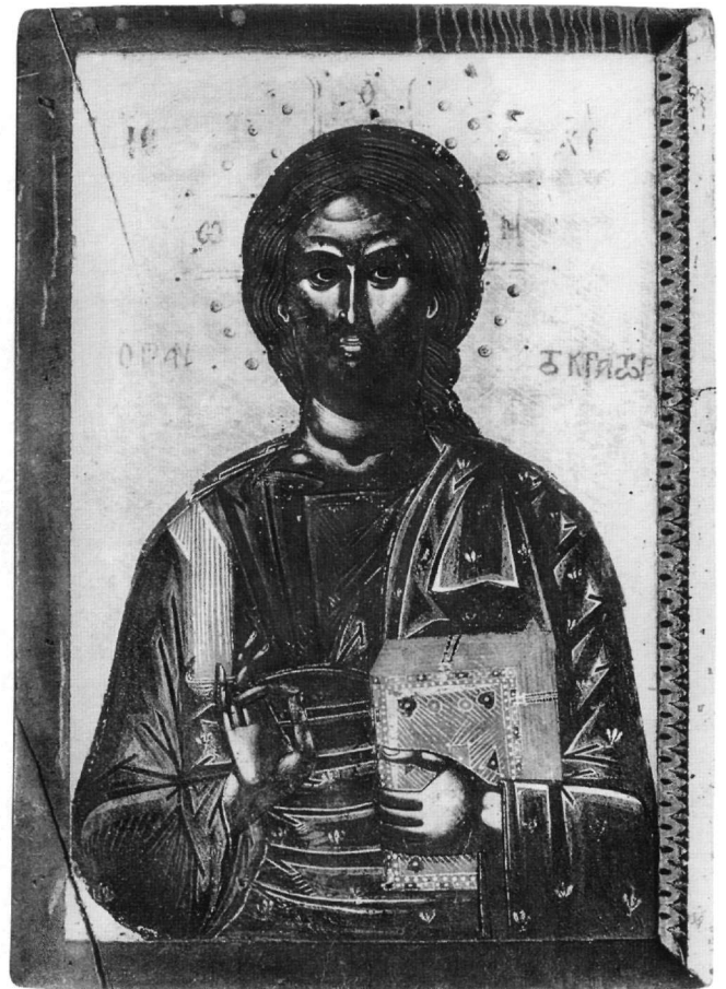
Εικ. 8. Μονή Κορώνης Αγράφων. Εικόνα του Χριστού Παντοκράτορος.

γάλη τεχνοτροπική συνάφεια και σχέση με τις τοιχογραφίες, ιδίως των παρεκκλησίων της μονής Διονυσίου 41 . Έτσι, το ιδιαίτερο πλάσιμο των προσώπων από τον Δανιήλ, γνωστό και από τις εικόνες του ναού του Αγίου Δημητρίου Αθύτου (Εικ. 1 και 2), με τα ελαφρά σηκωμένα προς τα έξω φρύδια, τις έντονες τοξωτές αυλακώσεις του μετώπου, τα λοξά αμυγδαλωτά μάτια και το κάπως αφηρημένο βλέμμα, τις έντονες σκιές στην άκρη του χείλους, τους σχετικά ευρείς κυλινδρικούς λαμμούς, την αρκετά επιτηδευμένη και σχηματοποιημένη τριχοφυΐα, απαντά επίσης και στις αγιορειτικές εικό-