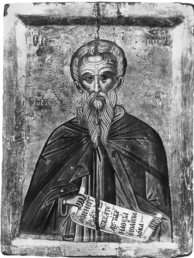
Εικ. 4. Μονή Διονυσίου Αγίου Όρους. Εικόνα του αγίου Μαξίμου του Ομολογητή.

ξί χέρι, καλυμμένο με το μαφόριο, στηρίζει μυροδόχο άωτο σφαιρικό αγγείο, όμοιο με αυτό που κρατούν οι ιαματικοί άγιοι 35 . Ο περίτεχνα διακοσμημένος χρυσός φωτοστέφανός της είναι παρόμοιος τόσο με του Χριστού Δίκαιου Κριτή (Εικ. 1) όσο και με του αγίου Μαξίμου του Ομολογητή (Εικ. 4).