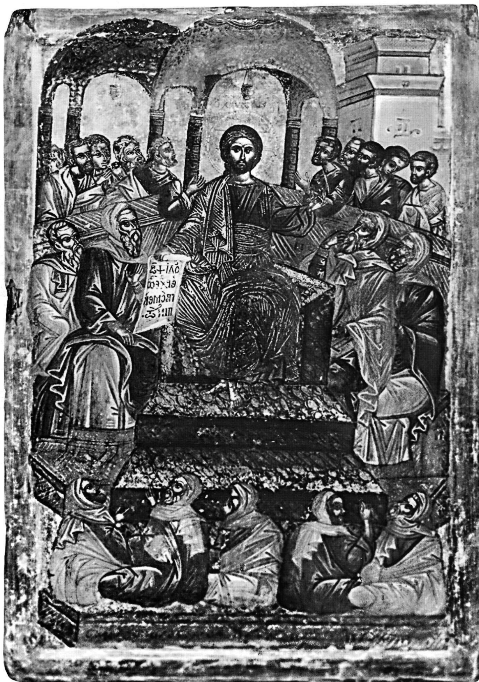
Εικ. 6. Μονή Διονυσίου Αγίου Όρους. Εικόνα της Μεσοπεντηκοστής.

δύο ομίλους, αριστερά πέντε και δεξιά τέσσερις. Το βάθος της σκηνής κλείνει τμήμα κτίσματος δεξιά και δεύτερο κιβώριο πράσινου χρώματος αριστερά. Στο μέσον, εκατέρωθεν του Χριστού και κάτω από αυτόν, κάθονται οι Εβραίοι της συναγωγής σε τέσσερις ομάδες από δύο και τρία άτομα. Το θέμα, σχετικά σπάνιο στα μετα-