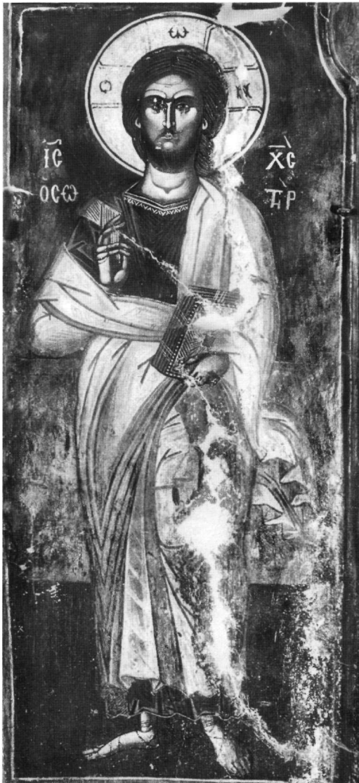
Εικ. 7. Μονή Κορώνης Αγράφων. Χριστός Σωτήρ.

πει να επηρέασε κατόπιν τόσο τη μνημειακή ζωγραφική 39 , όσο και τη ζωγραφική των φορητών εικόνων 40 . Η τελευταία έρευνα απέδωσε τις εικόνες αυτές –μαζί με κάποιες άλλες– με ασφάλεια στο χέρι του ζωγράφου Δανιήλ, όχι μόνο επειδή υπάρχει σχεδόν απόλυτη ομοιότητα και με τις ενυπόγραφες εικόνες του, αλλά και με-