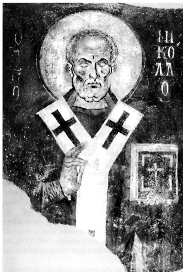
Fig. 2. Saint Nicolas de l'église à Koloucha, XIIIe siècle.

L'église, de dimensions modestes (10 m de long sur 8.70 m