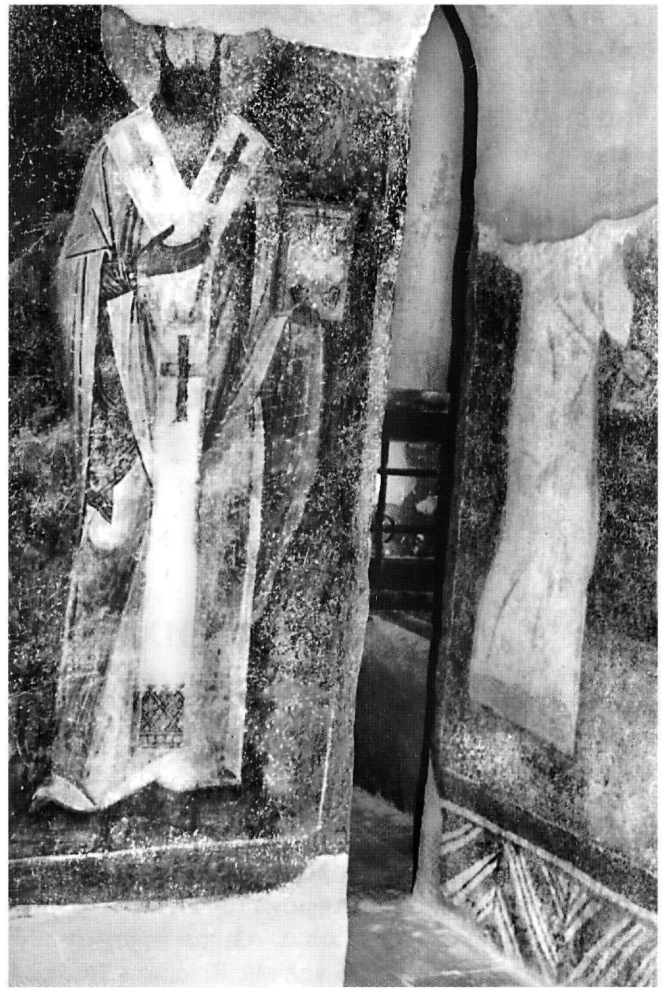
Fig. 3. Saint évêque et diacre, peinture dans le chœur de l'église à Koloucha, XIIe siècle.

Alexis I Comnène est réputé pour avoir lutté contre les hérésies 19 . C'est sous son règne qu'Euthyme Zégabène écrit sa Panoplie dogmatique , dirigée contre les Bogomiles, les Manichéens et les Pauliciens.