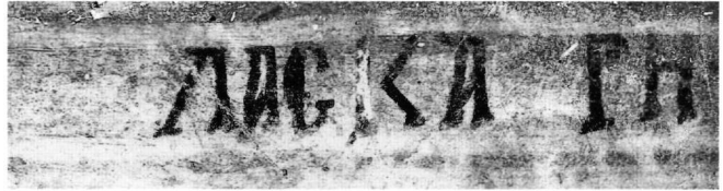
Fig. 12. Cemil, monastère dit de l'archange : inscription dédicatoire (détail). Suite du nom de l'empereur Théodore I er Laskaris (après traitement de l'image).

Une autre localité bien loin, il est vrai, de Cappadoce, pourrait correspondre au toponyme rapporté par l'inscription. Depuis longtemps, G. de Jerphanion avait démontré qu'au Moyen Âge un ἄστυ 14 ou un πολίχνιον 15 portant le nom de Σαμψών se dressait sur les ruines de l'antique cité de Priène 16 . Le savant français écrit ainsi : « ...en face de Milet, de l'autre côté de l'embouchure du Méandre, au delà de la plaine formée par les alluvions et qui, autrefois, était un golfe, se dresse la montagne que les Anciens appelaient le mont Mycale, et les Turcs d'aujourd'hui, le Samsoun Dag . Au pied du versant sud, tout près du cours actuel du Méandre, à seize kilomètres environ de Milet, sont les ruines de Priène et de son acropole. Le misérable village qui a succédé à la vieille cité s'appelle : Samsoun Qalè , c'est à dire la forteresse de Samsoun ».