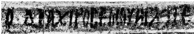
Fig. 6. Cemil, monastère dit de l'archange : inscription dédicatoire (détail). Le début de la signature du peintre Archigétas (après traitement de l'image).

Bartholomée et son frère, le diacre Léon, les fils de Michel de Sampso ; de ma main à moi, Archigétas le peintre, en l'an 6726 (= 1217/1218), indiction 6, sous l'empereur Théodore Laskaris.