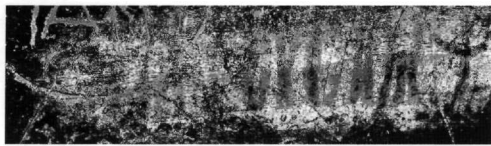
Fig. 5. Cemil, monastère dit de l'archange : inscription dédicatoire (détail). Le toponyme Sampso (après traitement de l'image).