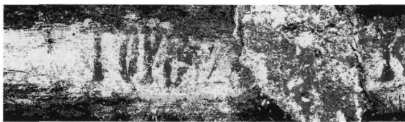
Fig. 9. Cemil, monastère dit de l'archange : inscription dédicatoire (détail). La date, ici l'année (après traitement de l'image).

peut lire à la l. 4, après un passage très délicat qu'il faudrait certainement reprendre : ...ἔτους ςψκϵ' (6725 = 1216/1217) ἔνδικτιῶνος ε', ἐπὶ βασιλέος [Θεοδώρου Λάσκαρι]. La persistance de la mention du nom de l'empereur de Nicée sur ces monuments de Cappadoce conduisit G. de Jerphanion 8 à imaginer une sorte d'enclave byzantine faisant partie de l'empire des Laskarides en plein territoire seldjoukide, mais l'hypothèse du grand savant, malgré une argumentation bien documentée, reste fragile.