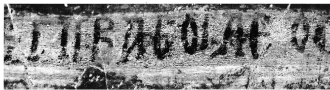
Fig. 10. Cemil, monastère dit de l'archange : inscription dédicatoire (détail). Sous le règne... (après traitement de l'image).

Force est de constater que ces textes sont exposés à des en-