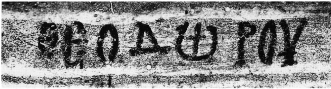
Fig. 11. Cemil, monastère dit de l'archange : inscription dédicatoire (détail). Le nom de l'empereur Théodore I er Laskaris (après traitement de l'image).