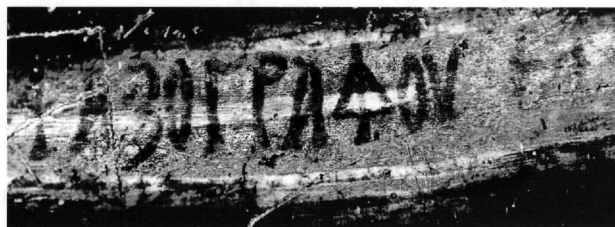
Fig. 8. Cemil, monastère dit de l'archange : inscription dédicatoire (détail). Signature du peintre (après traitement de l'image).

βασιλέοντος (sic) Θεοδόρου Λάσκαρη ἔτους ςψκ' (6720 = 1212) καὶ ἐνδ(ικτιῶνος) ιε' μ(η)νῆ ἀπριλίου ἡς τ(ὰς) κε'. La seconde inscription est également une dédicace, celle de l'église des Quarante Martyrs près de Souvech 7 où on