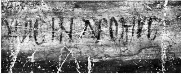
Fig. 2. Cemil, monastère dit de l'archange : inscription dédicatoire (détail).