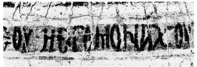
Fig. 4. Cemil, monastère dit de l'archange : inscription dédicatoire (détail). Le premier donateur, le hiéromoine (après traitement de l'image).

On observe également des intervalles vides entre plusieurs mots : elles ne sont pas accidentelles et je ne les signale pas dans ma transcription. Elles sont parfois indiquées sur la paroi par des points à mi-hauteur des mots et sont particulièrement visibles après : \kappa\acute{o}\pi\omicron\upsilon , \sigma\eta\nu\delta\rho\omicron\mu\tilde{\upsilon}\varsigma , \delta\omicron\upsilon\lambda\omicron\upsilon , \text{Βαρθολωμέου} , \eta\epsilon\rho\omicron\mu\omicron\nu\acute{\alpha}\chi\omicron\upsilon , \alpha\tilde{\upsilon}\tau\omicron\tilde{\upsilon} , \Lambda\epsilon\omicron\nu\tau\omicron\varsigma , \delta\eta\alpha\kappa\acute{o}\nu\omicron\upsilon , \Sigma\alpha\mu\eta\acute{o} , \acute{\epsilon}\nu(\delta\iota\kappa\tau\acute{\iota}\omicron\nu\varsigma) \varsigma , \beta\alpha\sigma\iota\sigma\iota\lambda\epsilon\omicron\varsigma , \Theta\epsilon\omicron\delta\acute{\omega}\rho\omicron\upsilon . Cer-