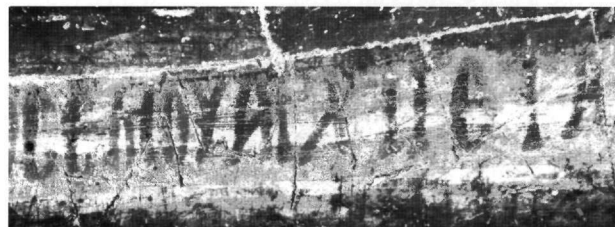
Fig. 7. Cemil, monastère dit de l'archange : inscription dédicatoire (détail). Le nom du peintre Archigétas (après traitement de l'image).

La première inscription est la dédicace de Qarche Kilissé près d'Arabsoun 6 . Le texte a beaucoup souffert, mais l'année et le nom de Théodore Laskaris sont conservés : ... ἐπι