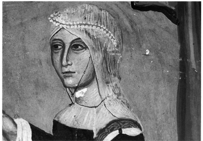
Fig. 7. Galata, église de Théotokos/Archangélos, 1514. Fresque dédicatoire, détail.

Enfin, dans le contexte chypriote, les chercheurs qui se sont penchés sur l'œuvre d'Axentis ont noté les liens iconogra-