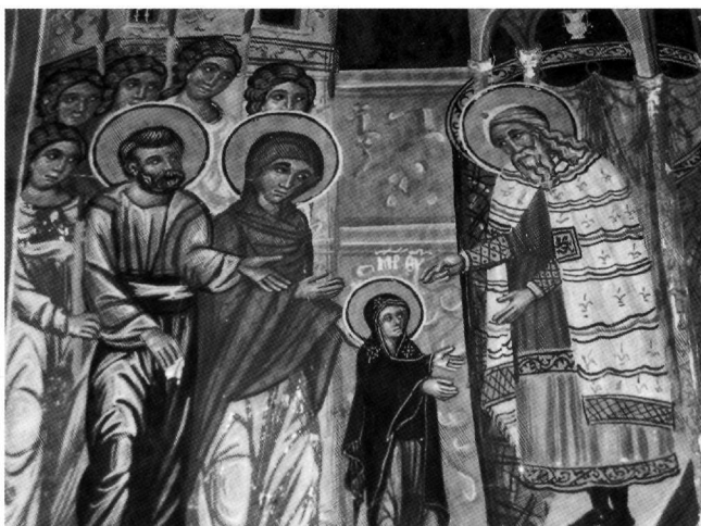
Fig. 4. Galata, église de Saint-Sozoméno, 1513. Présentation de la Vierge au Temple, détail.