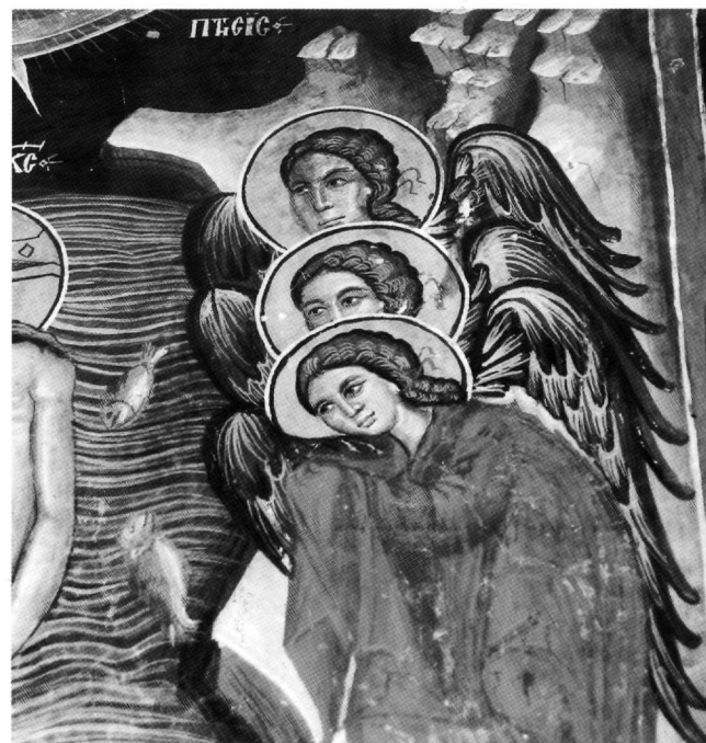
Fig. 6. Galata, église de Saint-Sozoméno, 1513. Baptême du Christ, détail.

Si les rapports notés dans cette recherche entre l'icône de Zanatzia et des fresques de Philippe Goul sont surtout iconographiques, les liens qu'on décèle avec Syméon Axentis sont plus profonds. Ils se situent dans le maniement du pinceau, dans la façon de dessiner les contours (les traits du visage de la Vierge et du Christ, les yeux de la Vierge), de modeler les volumes (avec p. ex. un triangle clair au-dessus de la lèvre, du côté éclairé du visage), de dessiner les sourcils avec quelques lignes. On retrouve cette façon de rendre les visages non seulement dans les traits de sainte Anne dans la Présentation de la Vierge au Temple, de saint Mamas, ou des anges dans le Baptême du Christ à Saint-Sozoméno en 1513 (Fig. 4, 5 et 6), mais aussi dans les portraits de Mandéléna et de ses enfants à Théotokos/Archangélos en 1514 (Fig. 7 et 8) 33 . Le geste rapide qui trace des lignes parallèles et qui laisse voir le mouvement de haut vers le bas, pour indiquer les parties éclairées des plis, se rencontre dans le maphorion de la Vierge de l'icône et dans l'habit de saint Jean-Baptiste dans l'image dédicatoire de Théotokos/Archangélos, pour ne mentionner qu'une seule fresque (Fig. 9).