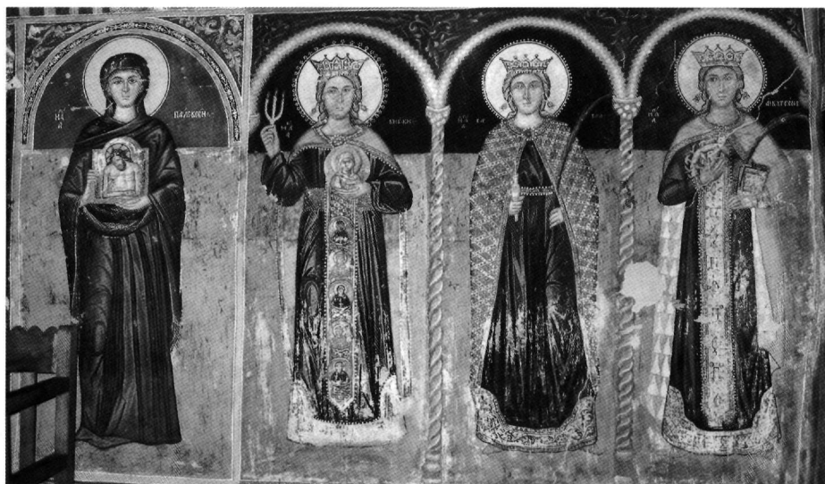
Fig. 3. Galata, église de Saint-Sozoménos, 1513. Frise inférieure, détail.

représenter aux commanditaires, qui ont des intérêts différents. Dans l'icône de Zanatzia le choix des saints pour les parties horizontales du cadre, des Pères de l'Église portant leurs habits sacerdotaux en haut et deux moines entourant saint Nicolas en bas, rappelle plutôt le programme iconographique d'une église, comme p. ex. à Stavros tou Agiasmati à Platanistassa, où les Pères officiant prennent place dans l'abside, alors que saint Nicolas se trouve entouré de moines et d'apôtres dans la nef 31 . Pierre et Paul se font face, comme dans maintes icônes, mais aussi dans l'église qui nous sert de point de repère. Saint Georges et saint Jean-Baptiste seraient les saints protecteurs des deux donateurs et les quatre évangélistes aux angles de l'icône seraient les piliers de l'enseignement du Christ.