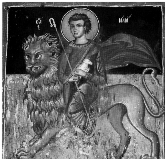
Fig. 5. Galata, église de Saint-Sozoméno, 1513. Saint Mamas.

Nous proposons d'attribuer à Syméon Axentis, ou à son atelier, certaines des fresques (à notre connaissance encore inédites) qui subsistent à l'église de Panagia à Érimi, près de Limassol, comme p. ex. les Pères dans l'abside et saint Damien.