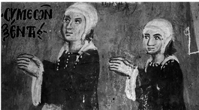
Fig. 8. Galata, église de Théotokos/Archangélos, 1514. Fresque dédicatoire, détail.

Ces rapports et cette continuité entre Philippe Goul et les peintres qui ont suivi dans un temps immédiat, ont été jusqu'à présent faussés par la datation en 1502 des fresques de Pa-