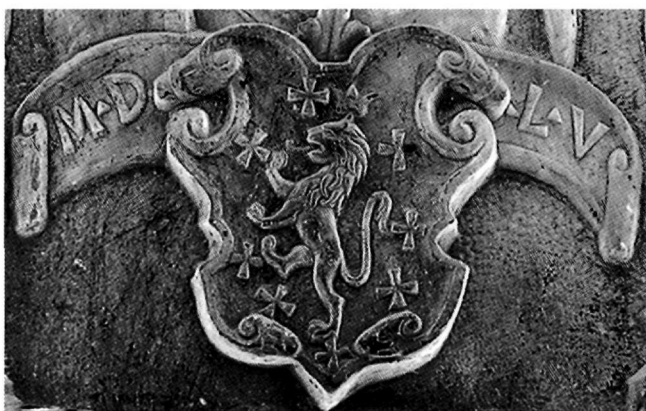
Fig. 2. Nicosie, église de Santa Croce. Relief de la Vierge à l'enfant, 1555. Armoiries, détail.

Les armoiries de l'icône de Zanatzia ne correspondent à aucune des armoiries ci-dessus. Correspondraient-elles à la description numéro du 182 : « lion sur champ crusillé » provenant de Nicosie et sans aucune autre indication 23 ? N'ayant pas à disposition une reproduction des armoiries décrites par le grand hérauldiste, nous ne pouvons pas vérifier. Nous pensons toutefois que Rüd't de Collenberg décrivait le blason sculpté (sans couleurs) du relief représentant la Vierge à l'enfant, conservé à l'église de Santa Croce à Nicosie, dont la famille n'a pas pu être identifiée : il est daté de quarante-cinq ans plus tard que l'icône de Manoel (M.D.L.V, c'est-à-dire 1555) et le lion y est couronné (Fig. 2).