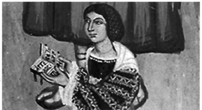
Fig. 9. Galata, église de Théotokos/Archangélos, 1514. Fresque dédicatoire, détail.