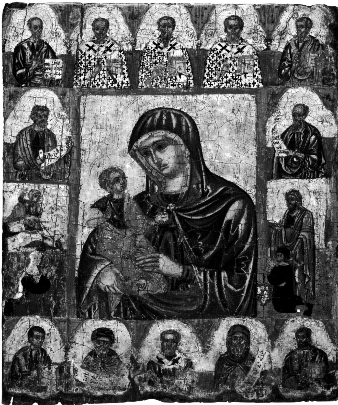
Fig. 1. Zanatzia, église de Panagia Éléousa. Madre della Consolazione, 1510. Icône attribuée à Syméon Axentis.