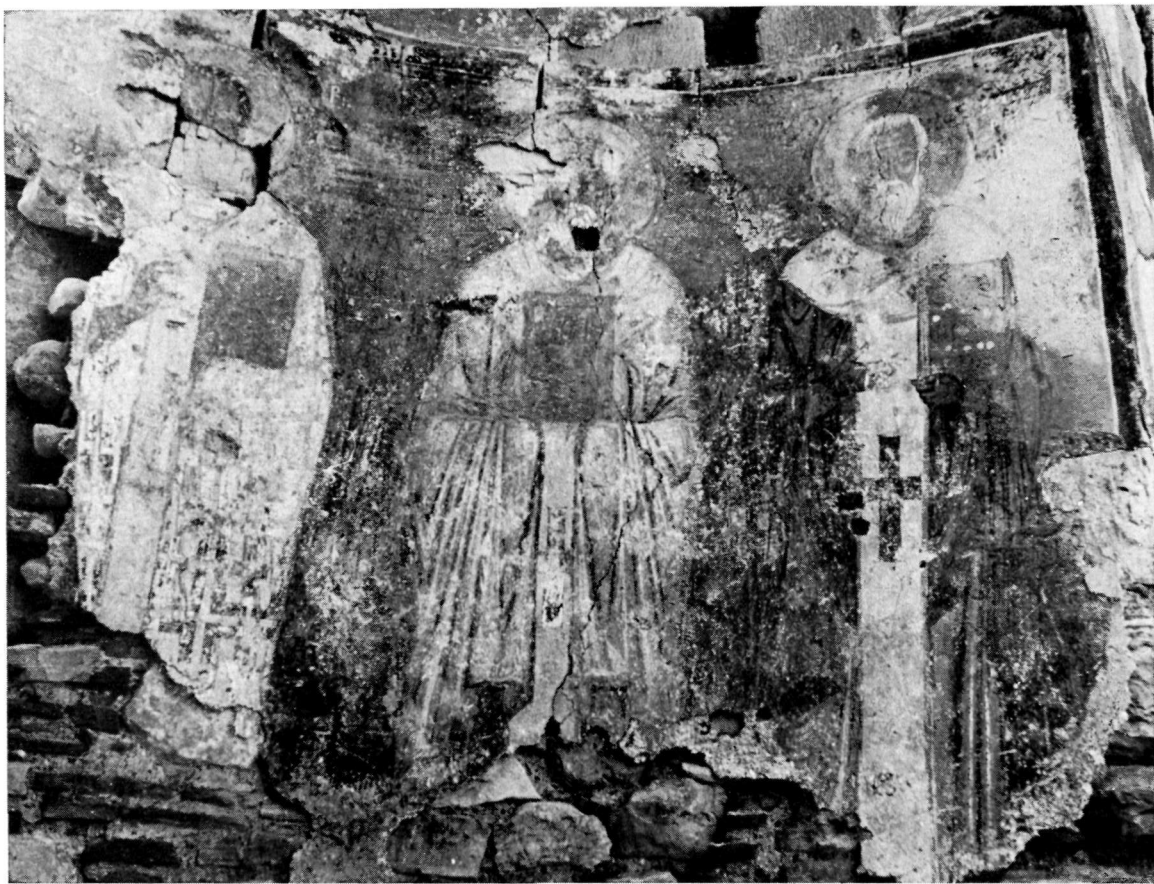
Τὸ Ν. τμήμα τῆς ἀψίδας, πρὶν ἀπὸ τὴν ἀποτείχιση. Οἱ ἅγιοι Βασίλειος, ἀδιάγνωστος καὶ Κλήμης.