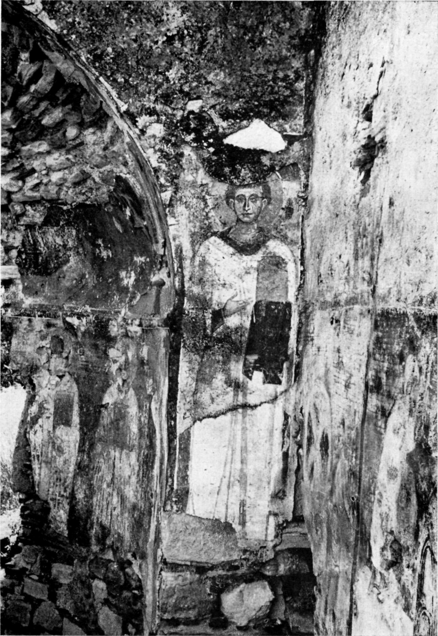
Ἡ Ν. παραστάδα τοῦ Βήματος. Ἅγιος διάκονος.