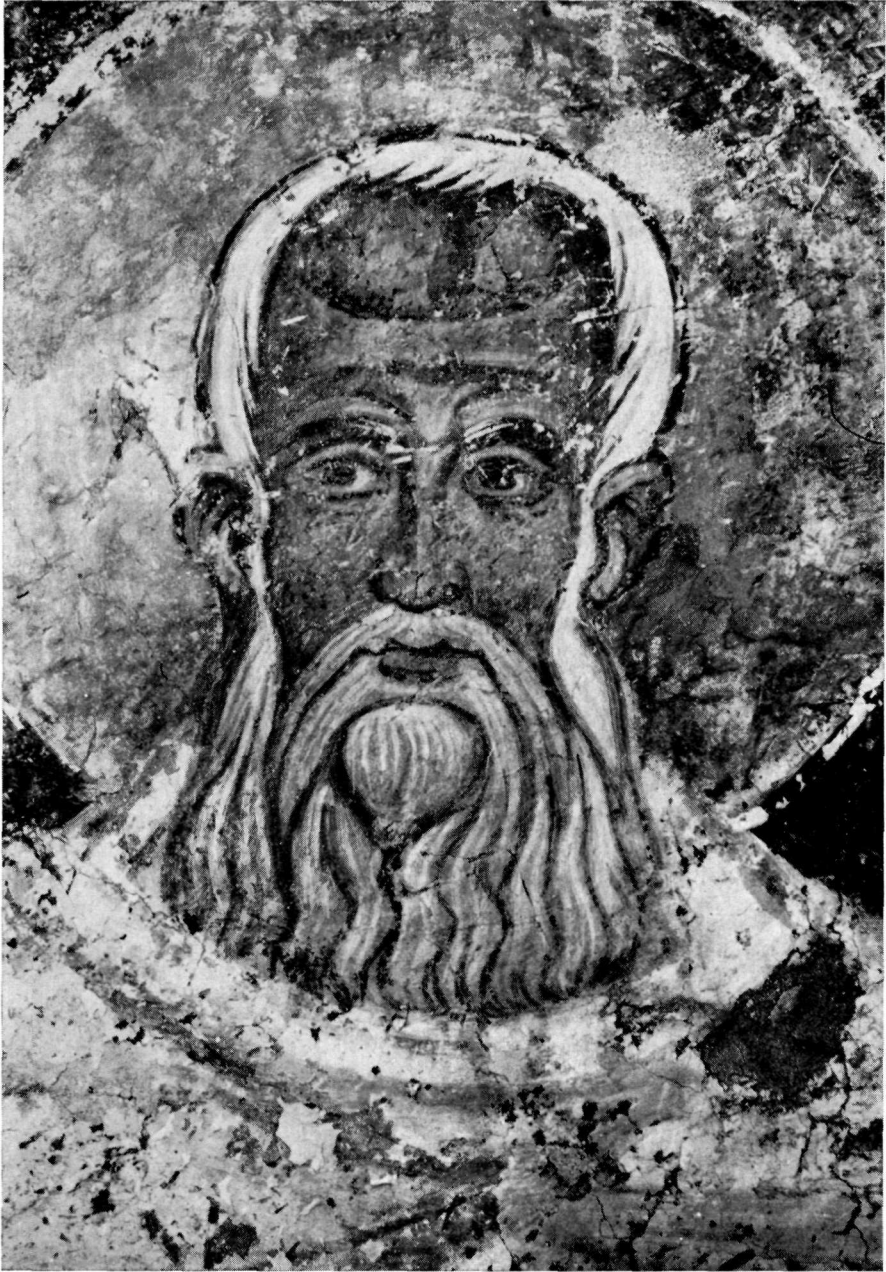
Ὁ Ἅγιος Γρηγόριος. (Λεπτομέρεια Πίν. 34).