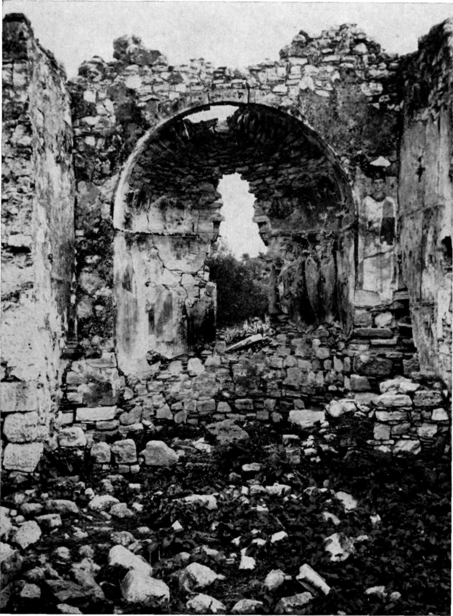
Ὀρτωπός. Τὰ ἔρειπια τοῦ Ἁγ. Γεωργίου. Ἡ ἀψίδα μετὸ διπλὸ στρωμα τοιχογραφιῶν.