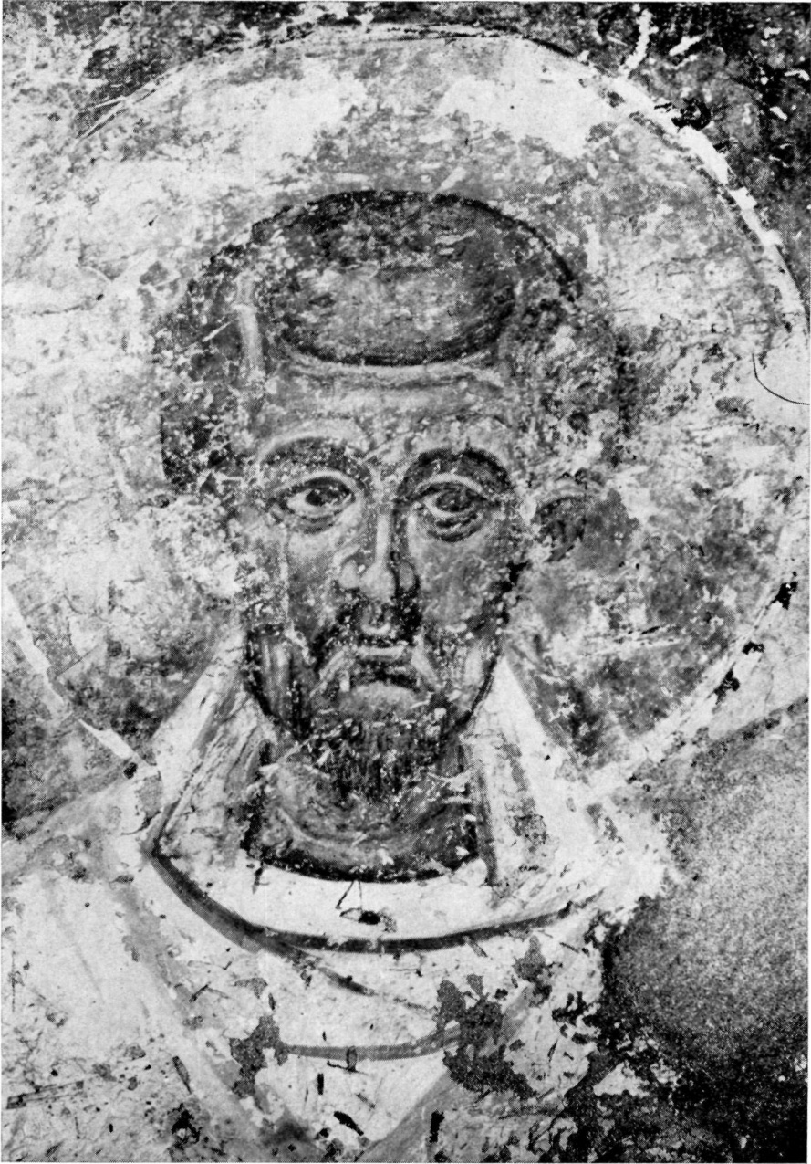
Ὁ Ἅγιος Ἰωάννης ὁ Χρυσόστομος. ( Λεπτομέρεια Πίν. 34 ).