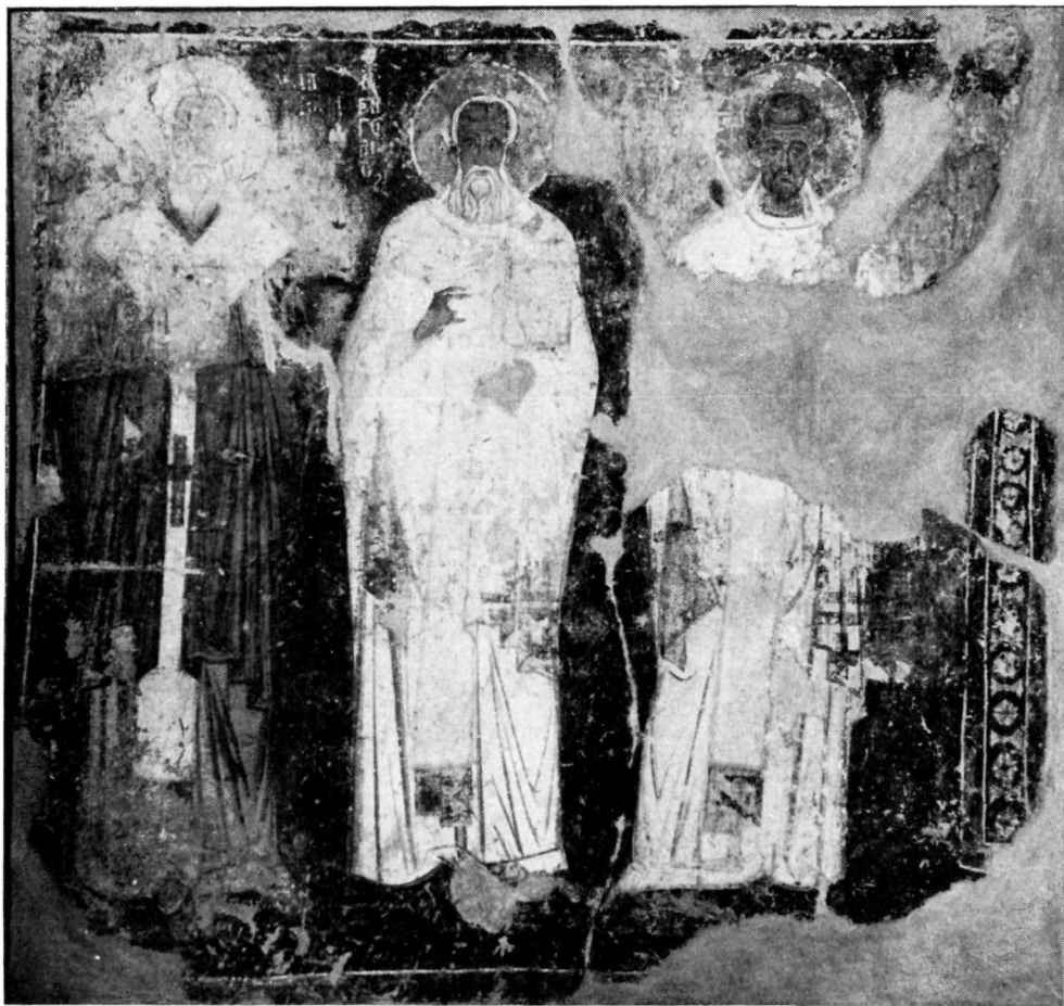
Ὁρωπός. Ἅγ. Γεώργιος. Τὸ Β. τμήμα τῆς ἀψίδας, μετὰ τοὺς ἱεράρχες Ἰγνάτιο, Γρηγόριο καὶ Χρυσόστομο, μετὰ τὴν ἀποτείχιση.