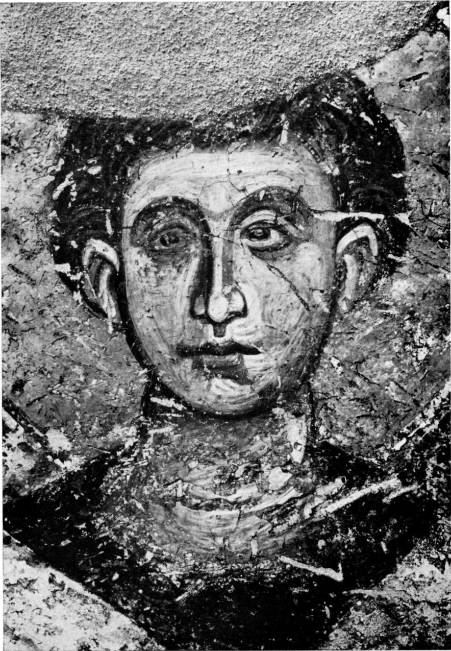
Ἅγιος διάκονος. (Λεπτομέρεια Πίν. 38).