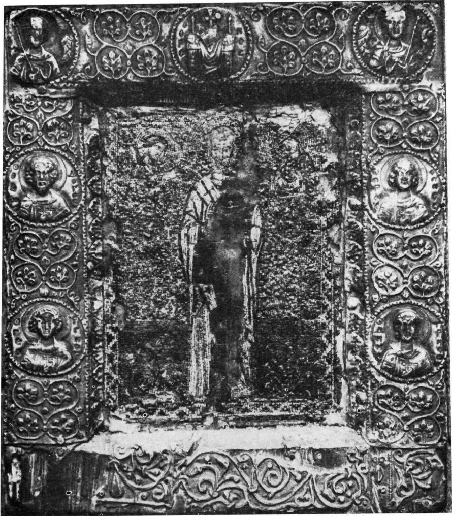
Ψηφιδωτή εικόνα τοῦ Ἁγίου Νικολάου. Μονή Ἁγίου Ἰωάννου τοῦ Θεολόγου τῆς Πάτμου.