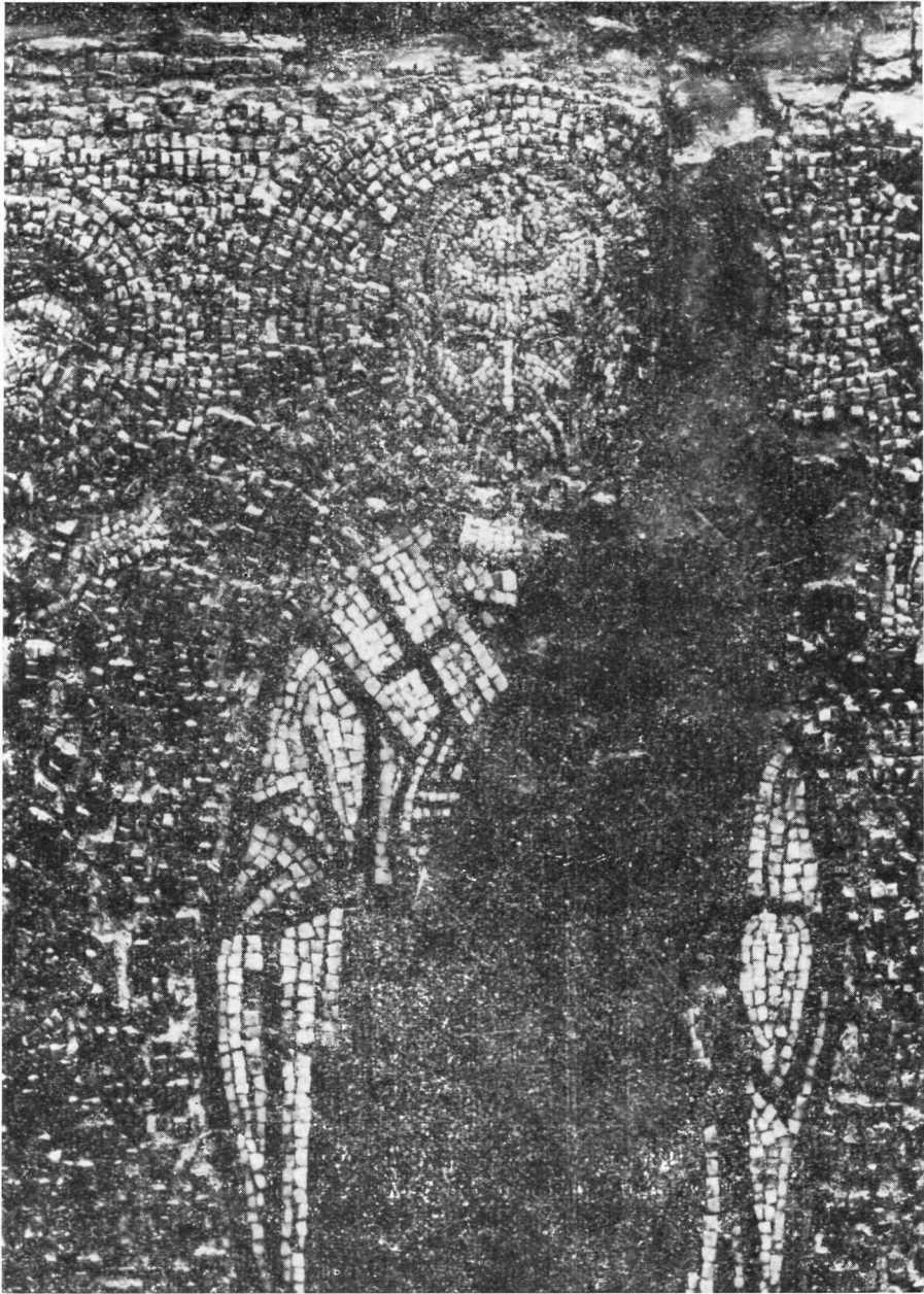
Ψηφιδωτή εικόνα τοῦ Ἁγίου Νικολάου. Λεπτομέρεια.