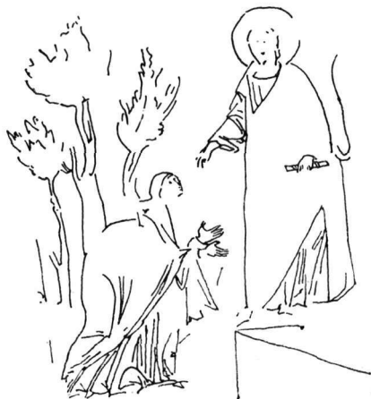
Εἰκ. 6. Τοιχογραφία Ἁγ. Γεωργίου Staro - Nagoričino.

τοιχογραφίες με τὴ σκηνὴ τοῦ « Μὴ μοῦ ἄπτου », δὲν φαίνεται νὰ ὑπάρχουν ἄλλες παραστάσεις τοῦ θέματος, ἐνῶ τὸ « Χαίρετε » ἐξακολουθεῖ νὰ εἶναι συχνὸ καὶ ἀγαπητὸ θέμα τοῦ κύκλου τῆς Ἀναστάσεως.