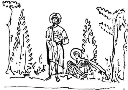
Εἰκ. 1. Μικρογραφία χειρογράφου Εὐαγγελίου (Par. Gr. 74).

Παράλληλα μπορούμε νὰ διαπιστώσουμε τὴν ἴδια συγγένεια με παλιότερα βυζαντινὰ πρότυπα, στὶς παραστάσεις τοῦ «Μὴ μοῦ ἅπτου» σὲ εἰλητάρια τοῦ Exultet τῆς Νοτίου Ἰταλίας, τοῦ 11ου καὶ τοῦ 12ου αἰώνα. 5 Ἀνεξάρτητα ἀπὸ τὸ θέμα μας, ἐνδιαφέρει αὐτὸ καὶ γενικώτερα, γιατί φαίνεται καθαρὰ πόση ἐπίδραση εἶχε σὲ ὀρισμένες περιπτώσεις ἢ βυζαντινὴ παράδοση στὴν εἰκονογράφηση τῶν Exultet, ἔστω καὶ ἂν τὰ κοινὰ στοιχεῖα δὲν εἶναι κατ' εὐθείαν παρμένα ἀπὸ τὶς πηγές 5 .