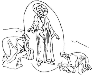
Εἰκ. 7. Τοιχογραφία Καθολικοῦ Μονῆς Χιλανδαρίου.

στο Χιλανδάρι, στην παράσταση του « Χαίρετε » 1 (εἰκ. 7). Στο Χιλανδάρι πάλι, στην ἴδια παράσταση, ξαναβρίσκουμε τὴ δόξα πού περιβάλλει τὸν Χριστὸ στὴν Γραδαπιά. Τέλος τὴν ἐλαφριά κλίση τοῦ κεφαλιοῦ τοῦ Χριστοῦ πρὸς τὸ μέρος τῆς Μαγδαληνῆς, ἐνῶ τὸ σῶμα του ἐξακολουθεῖ νὰ εἶναι κατὰ μέτωπο, συναντᾶμε πάλι στὸ Χιλανδάρι, ἀλλὰ κυρίως στὸν Ἅγιο Νικόλαο Ὁρφανὸ στὴ Θεσσαλονίκη, στὴν παράσταση τοῦ « Χαίρετε » 2 (Πίν. 61.2), ὅπου ἡ στάση τοῦ Χριστοῦ εἶναι κάθε ἄλλο παρὰ ἀπωθητικὴ καὶ προχωρεῖ πέρα ἀπὸ τὴν ἀπλὴ εὐλογία τοῦ Παρ. 74, σὲ μιὰ ἀνθρώπινη κατανόηση, μιὰ συγκρατημένη συγκίνηση, μιὰ ἀπόκοσμη ἐπαφή.