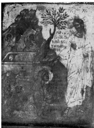
2. Εικόνα του ζωγράφου Χάννα. Βυζαντινό Μουσείο (άρ. 1620).