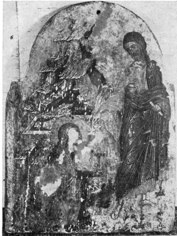
2. Εικόνα ( φύλλον τριπτύχου ) Μουσείου Μπενάκη.