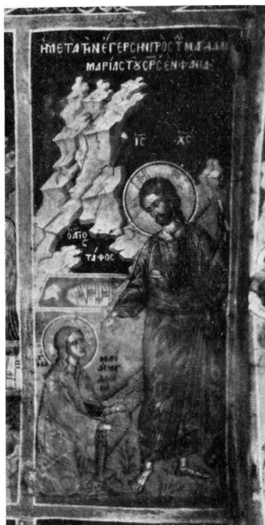
1. Τοιχογραφία Καθολικοῦ Μονῆς Μεταμορφώσεως Μετεώρων.