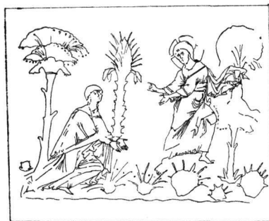
Εἰκ. 4. Μικρογραφία χειρογράφου Exultet (Βρετανικὸ Μουσεῖο, Add. 30337).

Ἔχει τὴν ἴδια ἤρεμη καὶ μετωπικὴ στάση τοῦ Χριστοῦ, μὲ τὸ δεξιὸ χέρι πού εὐλογεῖ τὴ Μαγδαληνή, τὸ δεξιὸ πόδι, στὸ ὁποῖο στηρίζεται τὸ σῶμα, ἐνῶ τὸ ἀριστερὸ ἀπλῶς ἀκουμπάει «ἀνετο» στὴ γῆ. Ἐδῶ ὁ Χριστὸς κρατᾷ τὸ εἰλητάριο στὸ ἀριστερὸ χέρι ὅπως σὲ ὅλες περίπου τὶς σύγχρονες παραστάσεις τοῦ «Χαίρετε» 3 , ὅπου ἐπίσης ἔχει τὴν ἴδια ἤρεμη καὶ μετωπικὴ στάση. Ἡ Μαγδαληνή, συγκρατημένη καὶ γονατισμένη σὲ κάποια ἀπόσταση ἀπὸ τὸν Χριστό, καθὼς καὶ τὰ δύο δέντρα πού πλαισιώνουν τὴ σκηνὴ εἶναι καὶ αὐτὰ εἰκονογραφικὰ στοιχεῖα πού ἐπαναλαμβάνονται κατὰ τὸν ἴδιο τρόπο καὶ σὲ παραστάσεις τοῦ «Χαίρετε» καὶ στὸ «Μὴ μοῦ ἄπτου» τοῦ Par. 74 καὶ στὴν παράσταση τοῦ Exultet τῆς Bibliothéque Mazarine.