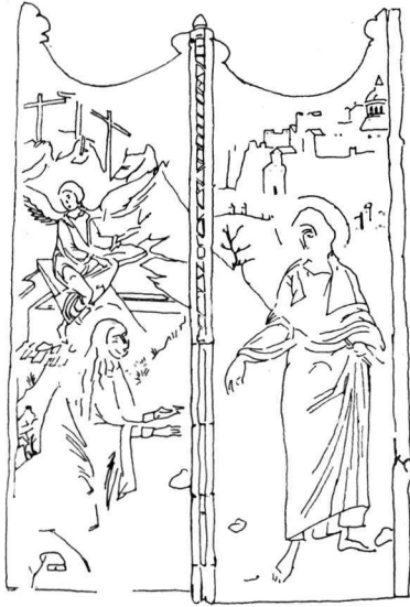
Εἰκ. 11. Βημόθυρο Ἐκκλησίας Ἁγ. Ἀθανασίου Μυλοποτάμου Κυθήρων.

Δυτικὲς τελείως εἶναι πρῶτα ἡ τοιχογραφία τοῦ ναοῦ τοῦ Θεολόγου τῆς Ἀρχιεπισκοπῆς Λευκωσίας 5 πού εἰκονίζει τὸν τάφο μέ τοὺς ἀγγέλους ὅπως τὸν εἶδαμε στὸν Ἅγιο Ἰωάννη τὸ Λαμπαδιστῆ καὶ κάτω τὸ «Μὴ μοῦ