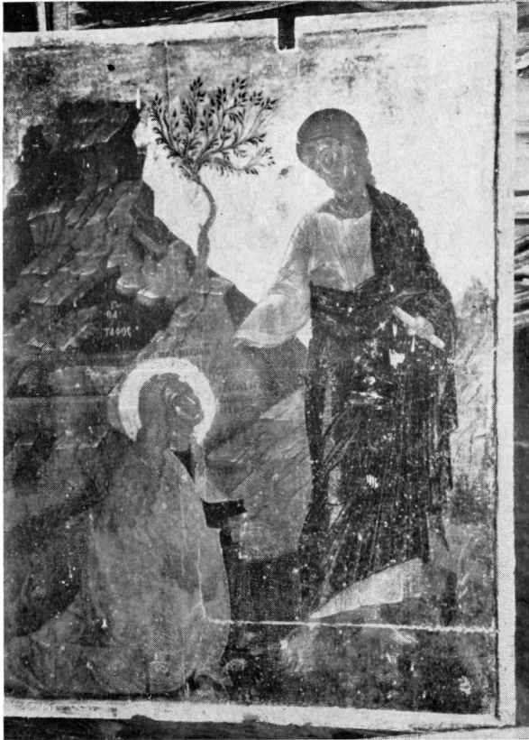
1. Εικόνα Παλαιού Μουσείου Ζακύνθου.