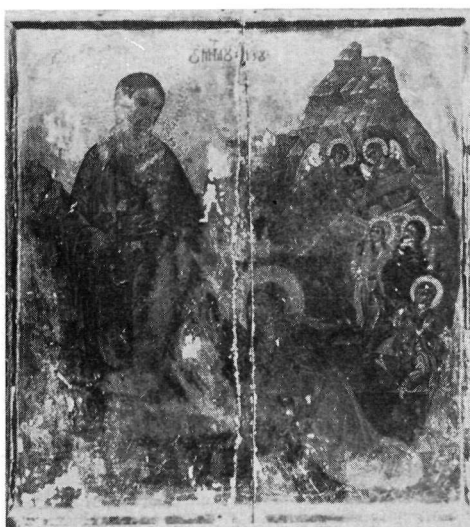
3. Τοιχογραφία εκκλησίας *Αγ. Μαγδαληνης. Μακρονίτσα. Πήλιον.