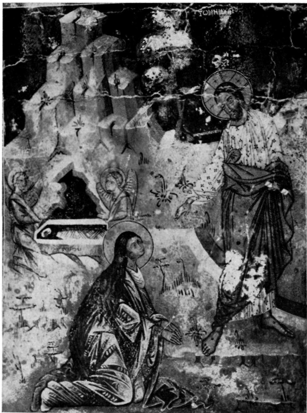
1. Τοιχογραφία ἐκκλησίας Ταξιαρχῶν. Θάρι Ρόδου.