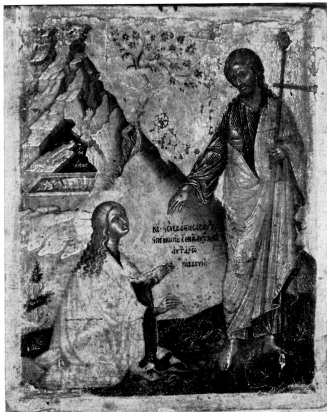
2. Εικόνα Μουσείου Ermitage, Leningrad.