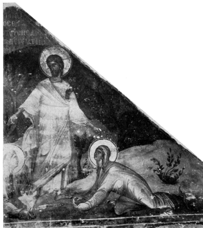
2. Τὸ «Χαίρετε τῶν Μυροφόρων». Τοιχογραφία Ἁγ. Νικολάου Ὁρφανοῦ, Θεσσαλονίκης.