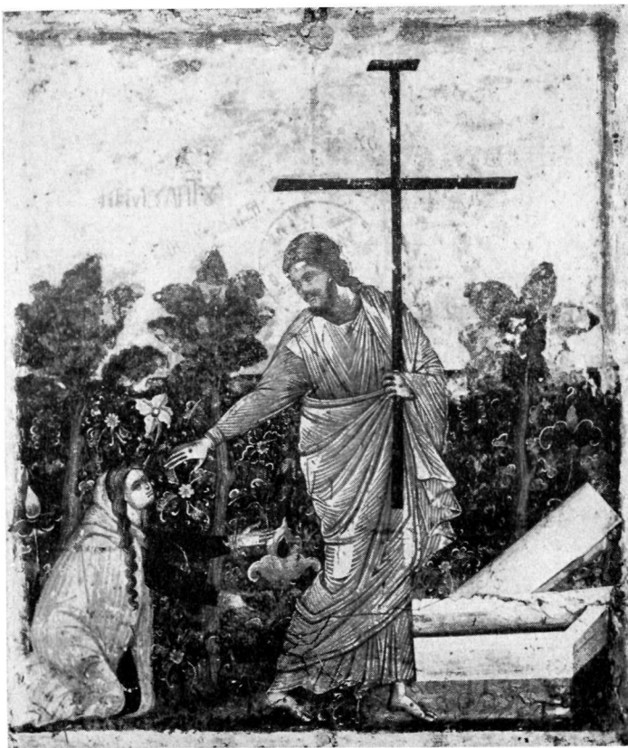
1. Εικόνα Βυζαντινού Μουσείου (άρ. 1635).