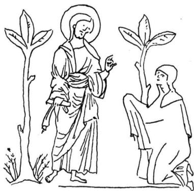
Εἰκ. 3. Μικρογραφία χειρογράφου Exultet (Bibl. Mazarine, Cod. 364).

Πάλι τὸν συμμετρικὸ τύπο τοῦ «Χαίρετε» ἔχει γιὰ πρότυπο ἡ παράσταση τοῦ «Μὴ μοῦ ἄπτου» στὸ Exultet Cod. 364 τῆς Bibliothéque Mazarine 1 , (εἰκ. 3) τοῦ 12 ου αἰώνα. Ἡ σκηνὴ ἀποδίδεται ὅπως στὸ Par. 74 2 .