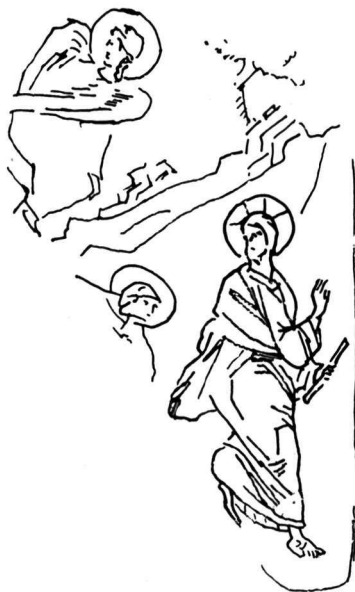
Εἰκ. 8. Τοιχογραφία Dečani.

Πραγματικά ἡ ἔντονη κίνηση φυγῆς τοῦ Χριστοῦ στο « Μὴ μοῦ ἄπτου » τοῦ Dečani 1 (εἰκ. 8) εἶναι ἀνάλογη μὲ τὴν κλίση τοῦ σώματος τοῦ Χριστοῦ στὶς δυτικὲς παραστάσεις τοῦ « Μὴ μοῦ ἄπτου » π.χ. στο Ἴσπανικὸ παρεκκλήσι τῆς Santa Maria Novella στὴ Φλωρεντία στὴ σύνθεση τοῦ Taddeo Gaddi 2 καὶ στὴ Maestà τοῦ Duccio 3 ,