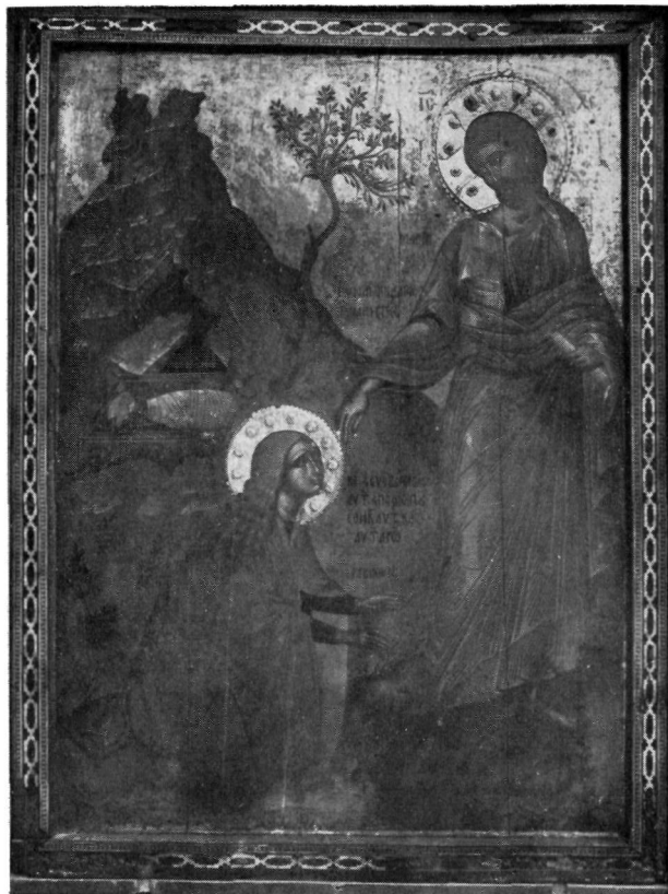
1. Εικόνα Πατριαρχείου Ἱεροσολύμων.