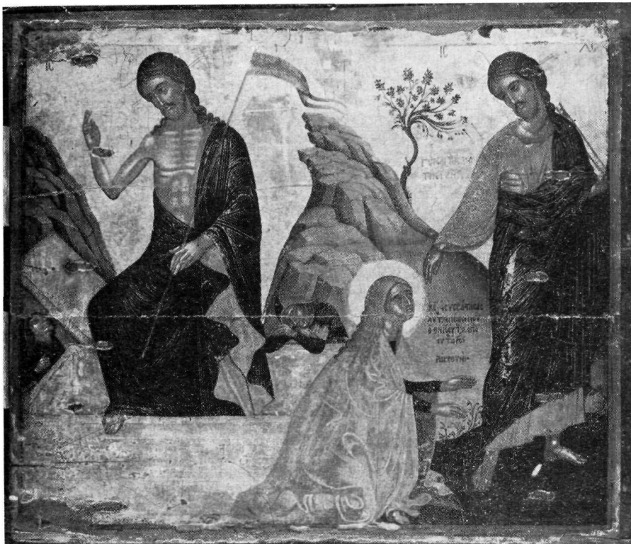
1. Εικόνα Μουσείου Ermitage. Leningrad.