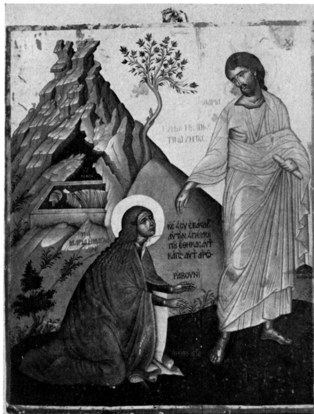
2. Εικόνα Ἐμμανουὴλ Τζάνε. Παναγία Ἀντιβουινιώτισσα Κερκύρας.