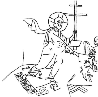
Εἰκ. 5. Ἡ εἰς Ἄδου Κάθοδος. Ψηφιδωτὸ Καθολικοῦ Νέας Μονῆς Χίου.

Σὲ ὅλον τὸν 13 ο αἰῶνα καὶ μέχρι τὸν 14 ο πὸν θὰ βροῦμε στὴ Σερβία