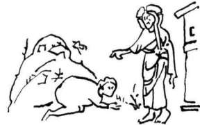
Εἰκ. 2. Μικρογραφία χειρογράφου Εὐαγγελίου (Laur. VI, 23).