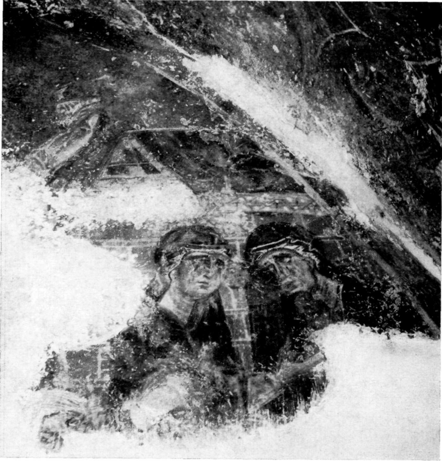
Αἱ Ἅγαι Γυναῖκες. Λεπτομέρεια τῆς Κοιμήσεως τῆς Θεοτόκου. Τοιχογραφία 11ου αἰῶνος τοῦ ναοῦ τοῦ Ἁγίου Νικολάου τῆς Στέγης.