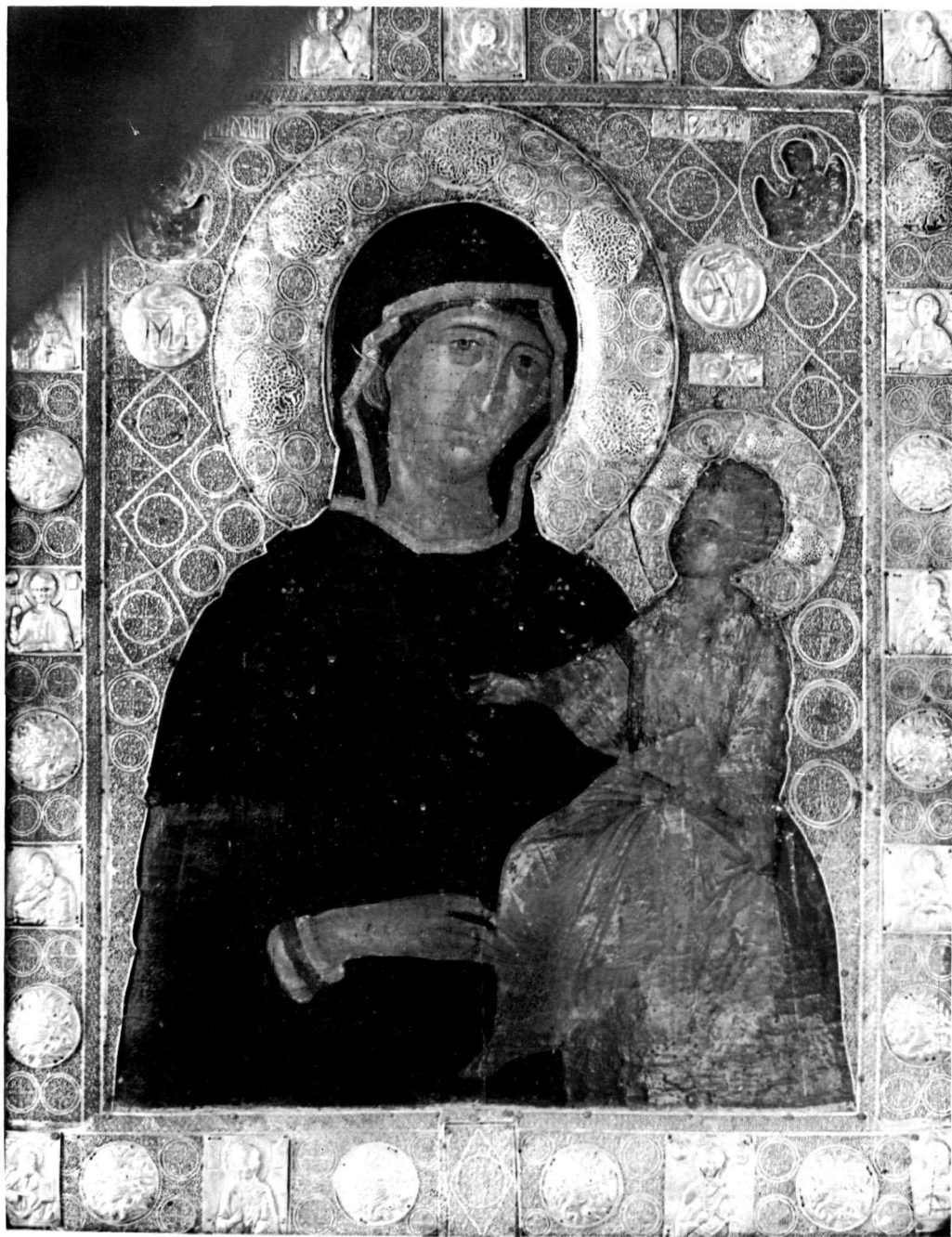
Εικόνα τής Παναγίας σὲ προσκνητάρι τοῦ Καθολικοῦ τής Μ. Βατοπεδίου.