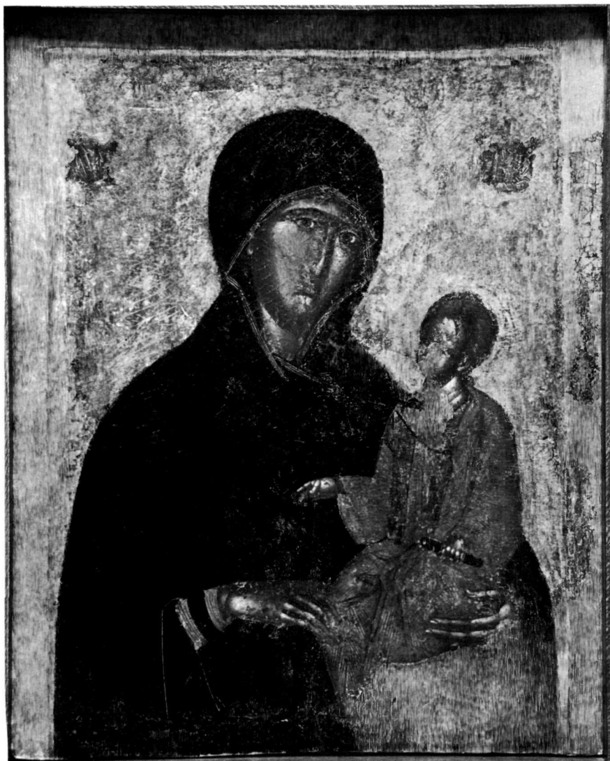
Παναγία τῆς ἀμφιπρόσωπης εἰκόνας ἀρ. 169 τοῦ Βυζ. Μουσείου Ἀθηνῶν.