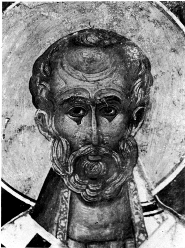
α. Μονή Μυρτιάς. Ὁ Ἅγιος Νικόλαος (λεπτομέρεια). Τοιχογραφία τοῦ Ξένου Διγενῆ, 1491. (Φωτ. Γ. Μαίλη).