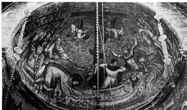
1. Τοιχογραφία Ἀγ. Κλήμεντα Ἀχρίδας.