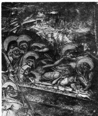
2. Τοιχογραφία ἐξωνάρθηκα Βατοπεδίου.