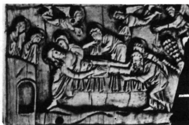
5. Ἐλεφαντοστό Μουσείου Rosgarten Κωνσταντίας.