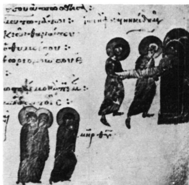
3. Ψαλτήρι Θεοδώρου, Βρεταννικοῦ Μουσείου, Add. 19352, φ. 116.