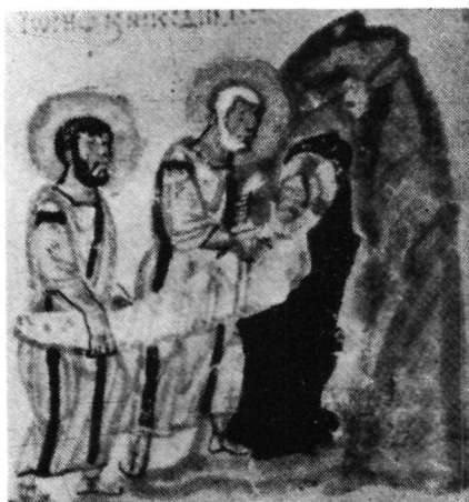
1. Ψαλτήρι Chludov, Add. 129, φ. 87.