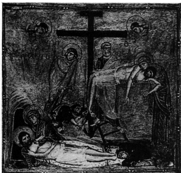
1. Εὐαγγέλιο Morgan 639, φ. 280.