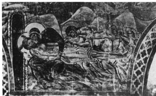
4. Τοιχογραφία 'Αγ. 'Αναργύρων Καστοριάς.