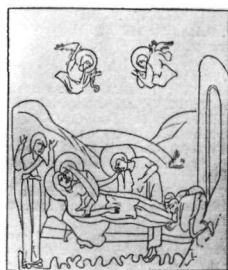
4. Εὐαγγέλιο Μονῆς Gelati.