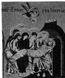
4. Ψηφιδωτὸ Monreale.