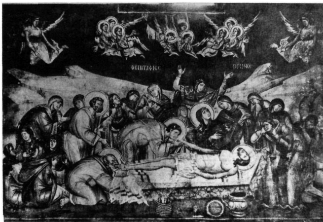
3. Τοιχογραφία Καθολικοῦ Βατοπεδίου.