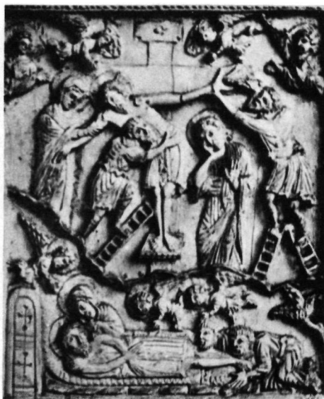
2. Ἐλεφαντοστό Μουσείου Victoria and Albert.