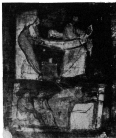
2. Εὐαγγέλιο Petropol. 21, φ. 8v.