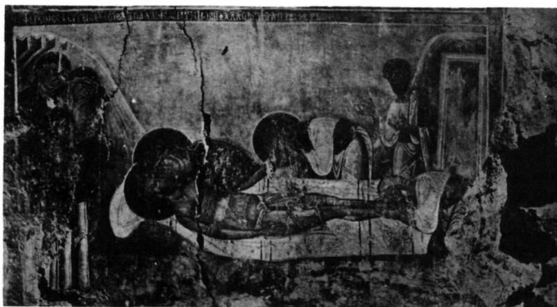
3. Τοιχογραφία ἐρειπωμένου ναοῦ Πάφου Κύπρου.