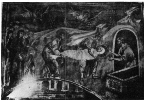
5. Τοιχογραφία Nogorizino.