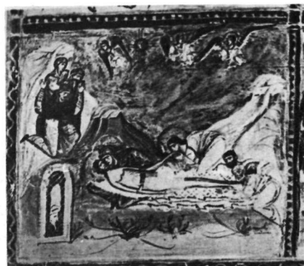
2. Μικρογραφία Vat. Gr. 1156, φ. 194v.