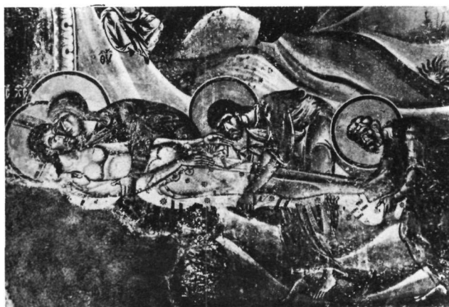
3. Τοιχογραφία Kurbinovo.