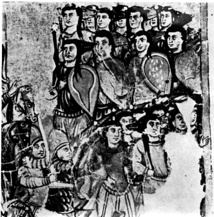
α. Κίεβον. Ἁγία Σοφία. Τοιχογραφία εἰς τὸ κλιμακοστάσιον. β. Ὁ Μ. Ἀλέξανδρος καὶ οἱ Κυνοκέφαλοι. Λεπτομέρεια ἀπὸ τὴν μικρογραφίαν τοῦ μυθιστορήματος τοῦ Μ. Ἀλεξάνδρου εἰς τὸν κώδικα τοῦ Ἑλληνικοῦ Ἰνστιτούτου Βενετίας.