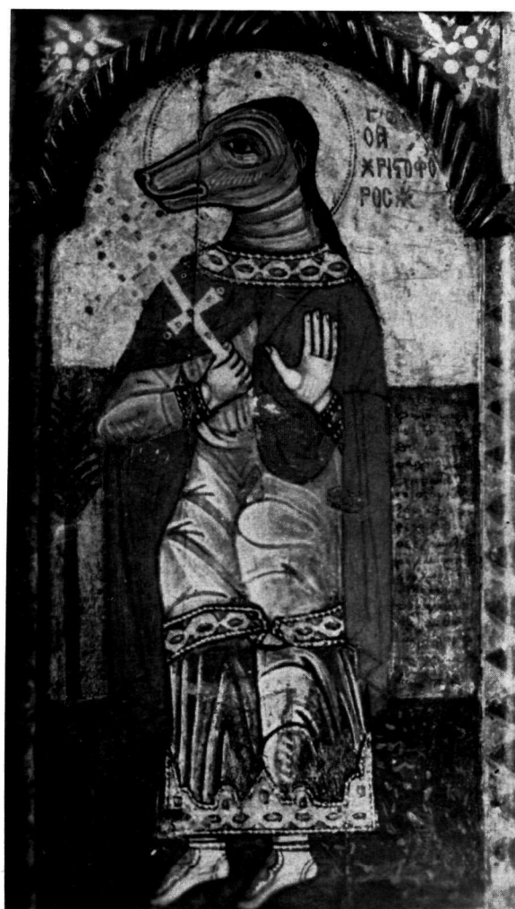
α. Ἀθήναι. Βυζαντινὸν Μουσεῖον. Λαϊκὴ εἰκὼν τοῦ Χριστοφόρου. 18ος αἰὼν (;