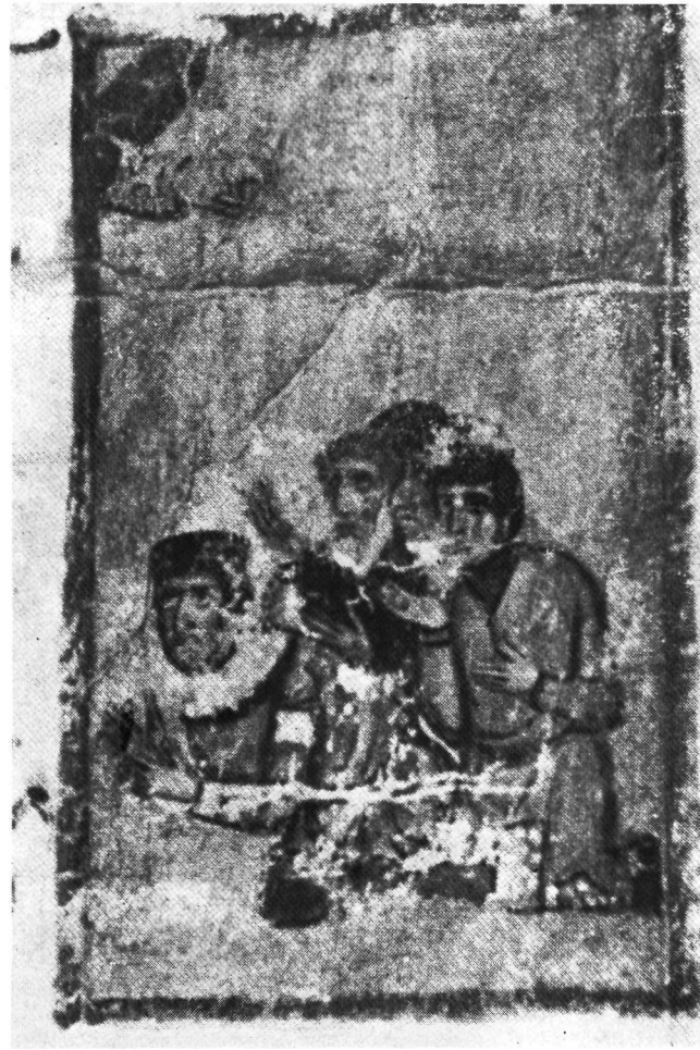
α. Λένινγκραντ, 'Ακαδημία τῶν Ἐπιστημῶν, κῶδ. Ι. β. Λένινγκραντ, 'Ακαδημία τῶν Ἐπιστημῶν, κῶδ. Ι.