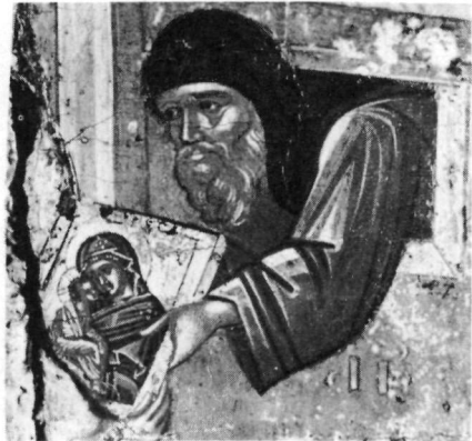
Εἰκ. 3. Λεπτομέρεια τῆς Εἰκ. 1.

ἀπὸ τὴ χαρακτηριστικὴ λιτότητά της καὶ τὴ σίγουρη ἰσορροπία της ἀποδεικνύεται κρητικὴ.