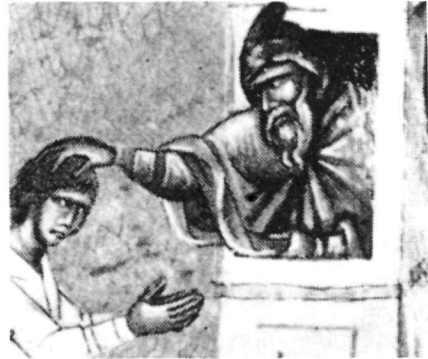
Εικ. 4. Vat. lat. 375, fol. 9.

Μεταλωτισμένα άλλωστε στή δυτική ζωγραφική είναι και μερικά από τά μοτίβα της παράστασης πού προέρχονται από τήν παλιά βυζαντινή εικονογραφία και πού χρησιμοποιούνται άρκετά στά λατινικά χειρόγραφα τοῦ 14ου και 15ου αϊ. Είναι χαρακτηριστική ή συγγένεια τοῦ έρημίτη και τοῦ οικίσκου της εικόνας μας (Εικ. 3) με ανάλογη παράσταση στό fol. 9 τοῦ λατινικοῦ χειρογράφου Vat. lat. 375 τοῦ Παλέρμου 12 . Ντυμένος και εκεί με τό μοναχικό κουκούλιο έρημίτης-άγιος προβάλλει επίσης από όρθογώνιο άνοιγμα παρόμοιο με της εικόνας μας οικίσκου και άρκετά σκυφτός τεντώνει τό δεξί του χέρι για νά τό άκουμπήσει στό κεφάλι νεαρής άνδρικής μορφής πού εικονίζεται γονατιστή κάτω (Εικ. 4). Τό μοτίβο πού είναι μεταφερόμενο από τή βυζαντινή εικονογραφία εντάσσεται έδω σέ ένα καινούριο κλίμα με νεωτερικά στοιχεία πού έρχονται από τή ζωγραφική της Δύσης τοῦ 14ου αϊ.