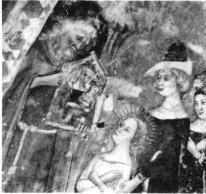
Εἰκ. 2. Ἡ ἅγια Αἰκατερίνα συμβουλευέται τὸν ἐρημίτη. Τοιχογραφία τοῦ Andrea da Bologna στὴ Santa Maria della Rocca στὴν Offida.

Τὴν ἀπουσία παλιότερου προτύπου ἀπὸ τὴν ὀρθόδοξη εἰκονογραφία μαρτυροῦν καὶ τὰ ἑτερογενῆ συνθετικὰ στοιχεῖα τῆς παράστασης. Στὰ ἐπιμέρους μοτίβα παρακολουθεῖ παλιὰ βυζαντινὰ καὶ παλαιολόγια στοιχεῖα, σοφὰ ἐπιλεγμένα καὶ προσαρμοσμένα σὲ μιὰ νέα οἰκονομία σύνθεσης, πού