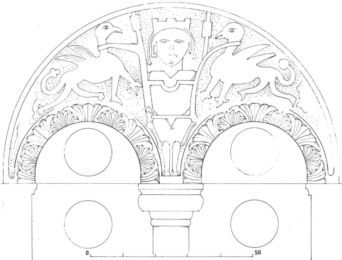
Είκ. 1. Μουσείο Κορυτσᾶς. Τύμπανο διλόβου παραθύρου ἀπὸ τὴν Κούργιανη (Ἰ. Ἀριθ. Εὐρ. 5292).