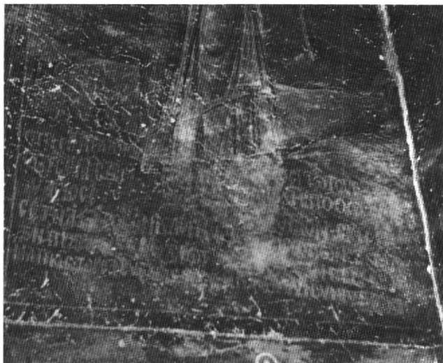
Εἰκ. 1. Ἁγιοὶ Ἀναργυροί, νάρθηκας. Λεπτομέρεια Ἀναλήψεως καί τμήμα επιγραφῆς.

Οἱ ἐπόμενες τρεῖς επιγραφές 16 πού συνοδεύουν τίς παραστάσεις του Θεόδωρου Λημνιώτη 17 καί τῆς οἰκογενείας του, πάλι στό βόρειο κλίτος, εἶναι ξαναγραμμένες μέ διαφορετικό χρῶμα καί στίς παραστάσεις ἔχουν