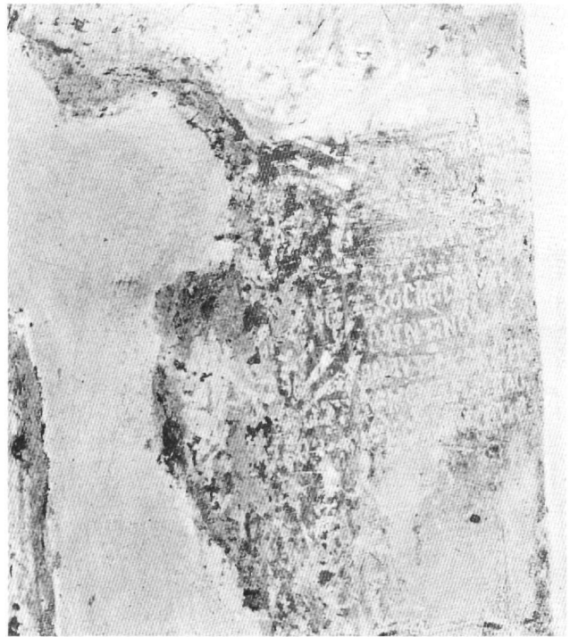
Εἰκ. 5. Ἅγιοι Ἀναργυροί, νότιος τοῖχος ἱεροῦ. Ἐπιγραφή.