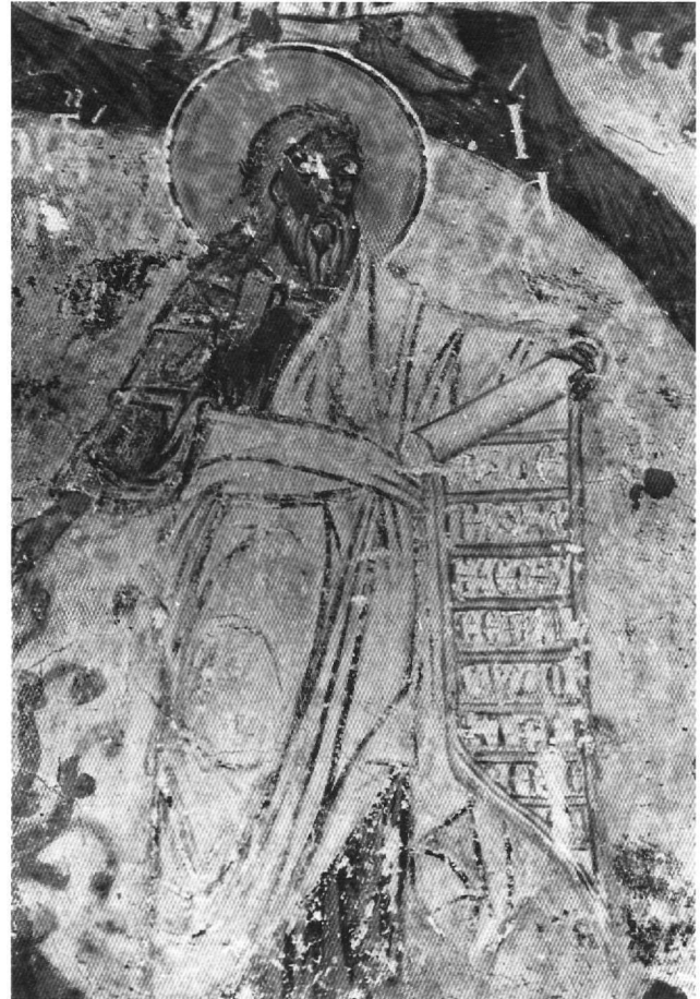
Εικ. 6. Ρίζα Ιεσσαί, ο προφήτης Ησαΐας.

απόστολοι Πέτρος και Παύλος και οι στρατιωτικοί άγιοι Δημήτριος και Γεώργιος, βλ. ό.π., σχέδ. 27.