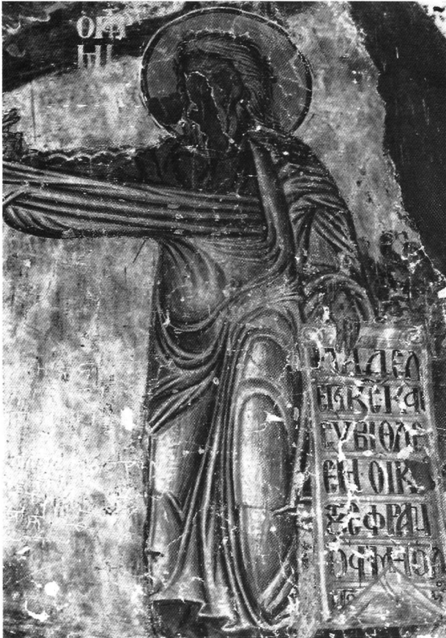
Εικ. 7. Ρίζα Ιεσσαί, ο προφήτης Μιχαίας.