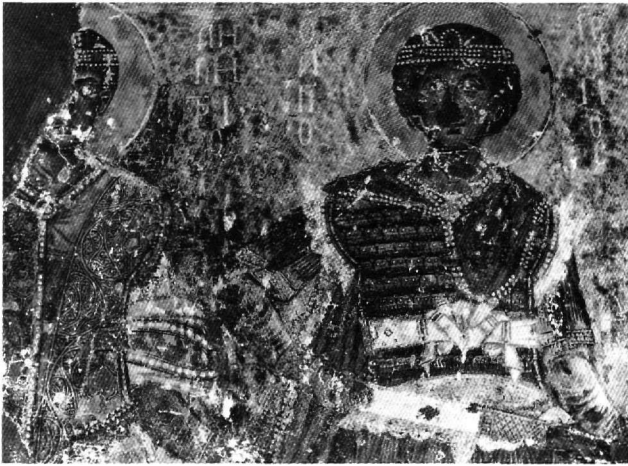
Εικ. 11. Οι στρατιωτικοί άγιοι Γεώργιος και Δημήτριος.