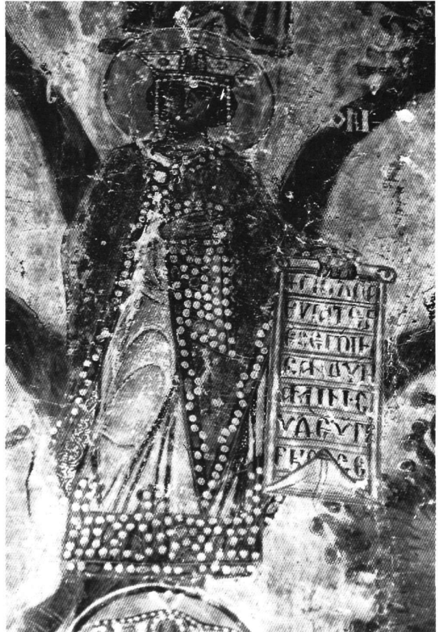
Εικ. 8. Ρίζα Ιεσσαί, ο προφήτης Σολομών.

19. Βλ. Μουτσόπουλος, ό.π. (υποσημ. 1), σ. 34, Πελεκανίδης - Χατζηδάκης, ό.π. (υποσημ. 1), σ. 77.