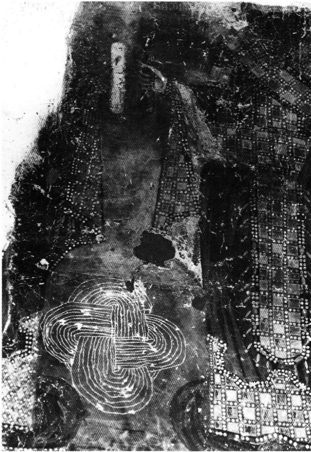
Εικ. 12. Οι αυτοκράτορες Μιχαήλ Παλαιολόγος και Αλέξιος Κομνηνός.

του ίδιου αυτοκράτορα επιχειρώ την παρακάτω συμπλήρωση: [ΜΙΧΑΗΛ ΕΝ ΧΡΙΣΤΩ ΤΩ ΘΕΩ ΠΙΣΤΟΣ ΒΑΣΙΛΕΥΣ ΚΑΙ ΑΥΤΟΚΡΑΤΩΡ ΡΩΜΑΙΩΝ ΚΑΙ ΝΕΟΣ ΚΩΝΣΤΑΝΤΙΝΟΣ ΚΟΜΗΝΙΝΟΣ ΔΟΥΚΑΣ Ο ΠΑΛΑΙΟΛΟΓΟΣ .