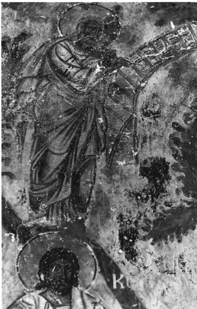
Εικ. 9. Ρίζα Ιεσσαί, ο προφήτης Ιερεμίας.