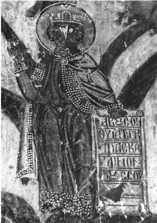
Εικ. 5. Ρίζα Ιεσσαί, ο προφήτης Δαβίδ.