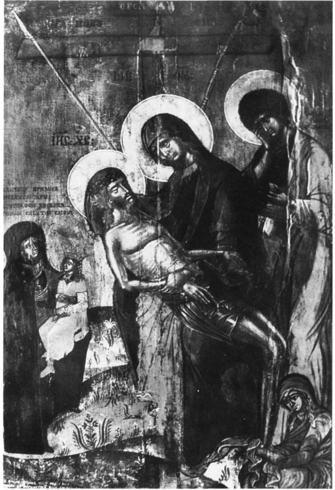
Εικ. 7. Αποκαθήλωση. Βουκουρέστι, Μουσείο Τέχνης.

Το άπλωμα του τοπίου με τα τείχη της Ιερουσαλήμ και το πλατύ άνοιγμα του ορίζοντα στο δάθος της σκηνής, ανάμεσα στα δύο δουνά, υπονοεί κάποια δυτικότερη αίσθηση προοπτικής του χώρου. Τα δύο δουνά στα