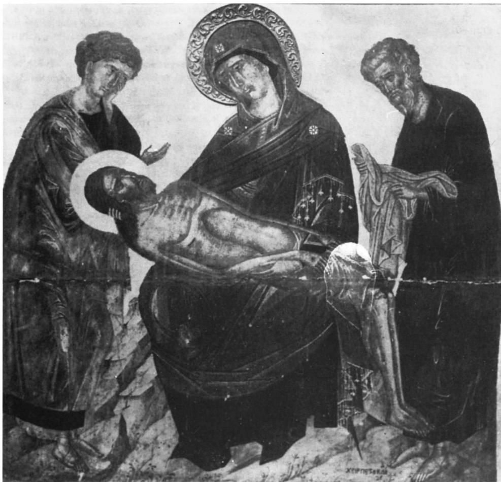
Εικ. 4. Πέτρον Κλάδον: Πιετά με τον άγιο Ιωάννη και τον άγιο Ιωσήφ. Βενετία, ναός Santa Fosca.

γραφία. Ο Ιωσήφ από τη σκηνή της Αποκαθήλωσης και ο Ιωάννης από τη Σταύρωση πλαισιώνουν το σύμπλεγμα της καθιστής Παναγίας με το Χριστό σε μια εικόνα του 15ου αιώνα στο ναό της Santa Fosca στη Βενετία, έργο του Πέτρον Κλάδου 26 (Εικ. 4). Το εικονογραφικό αυτό σχήμα επαναλαμβάνεται και σε μια εικόνα του 16ου αιώνα στα Musei Civici της Πάδοβας, όπου προστίθενται και δύο άγγελοι που θηρούν 27 (Εικ. 5). Στο ίδιο κλίμα κινείται και ο καλλιτέχνης μιας άλλης εικόνας του 16ου αιώνα στην Πράγα, με μόνη διαφορά ότι έχει αντικαταστήσει τη μορφή του Ιωσήφ με τη μορφή της Μαρίας της Μαγδαληνής 28 (Εικ. 6). Σε όλες αυτές τις περιπτώσεις, με εξαίρεση την εικόνα της Πράγας, το εικονογραφικό θέμα της Πιετά είναι απαλλαγμένο τεχνοτροπικά από κάθε δυτική επίδραση.