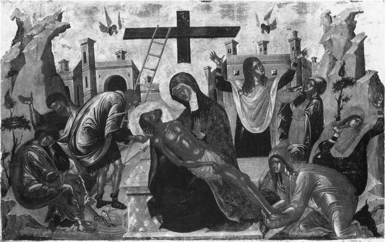
Εικ. 1. Εικόνα με παράσταση του Επιτάφιου Θρήνου. Λονδίνο, Temple Gallery.

γδαληνή κάθετοι η τέταρτη μυροφόρος, μοιρολογώντας σπαρακτικά, χωρίς να κοιτάζει το θλιβερό θέαμα, με υψωμένα τα χέρια και τεντωμένες παλάμες να τονίζουν την οδύνη της. Φορεί ανοιχτό κόκκινο μαφόριο και σκουροπράσινο φόρεμα με καφέ και κίτρινη ταινία στα μανίκια. Ψηλά, δεξιά και αριστερά από το σταυρό, δύο άγγελοι θρηνούν, κρατώντας με τα δύο χέρια το πρόσωπό τους. Κάτω στο έδαφος, δίπλα από τον Ιωάννη, πλεκτό καλάθι με το σφυρί, τα καρφιά και την τανάλια που είχαν χρησιμοποιήσει ο Νικόδημος και ο Ιωσήφ για να βγάλουν τα μπηγμένα στα πόδια του Χριστού καρφιά.