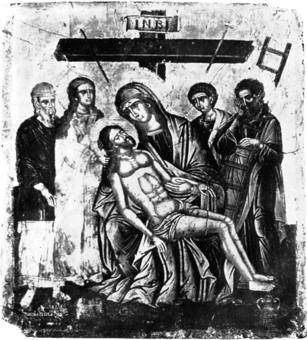
Εικ. 3. Εμμ. Τζάνε: Αποκαθήλωση. Αθήνα, Μουσείο Μπενάκη. (Υπογραφή πλαστή κατά Μ.Χ.).