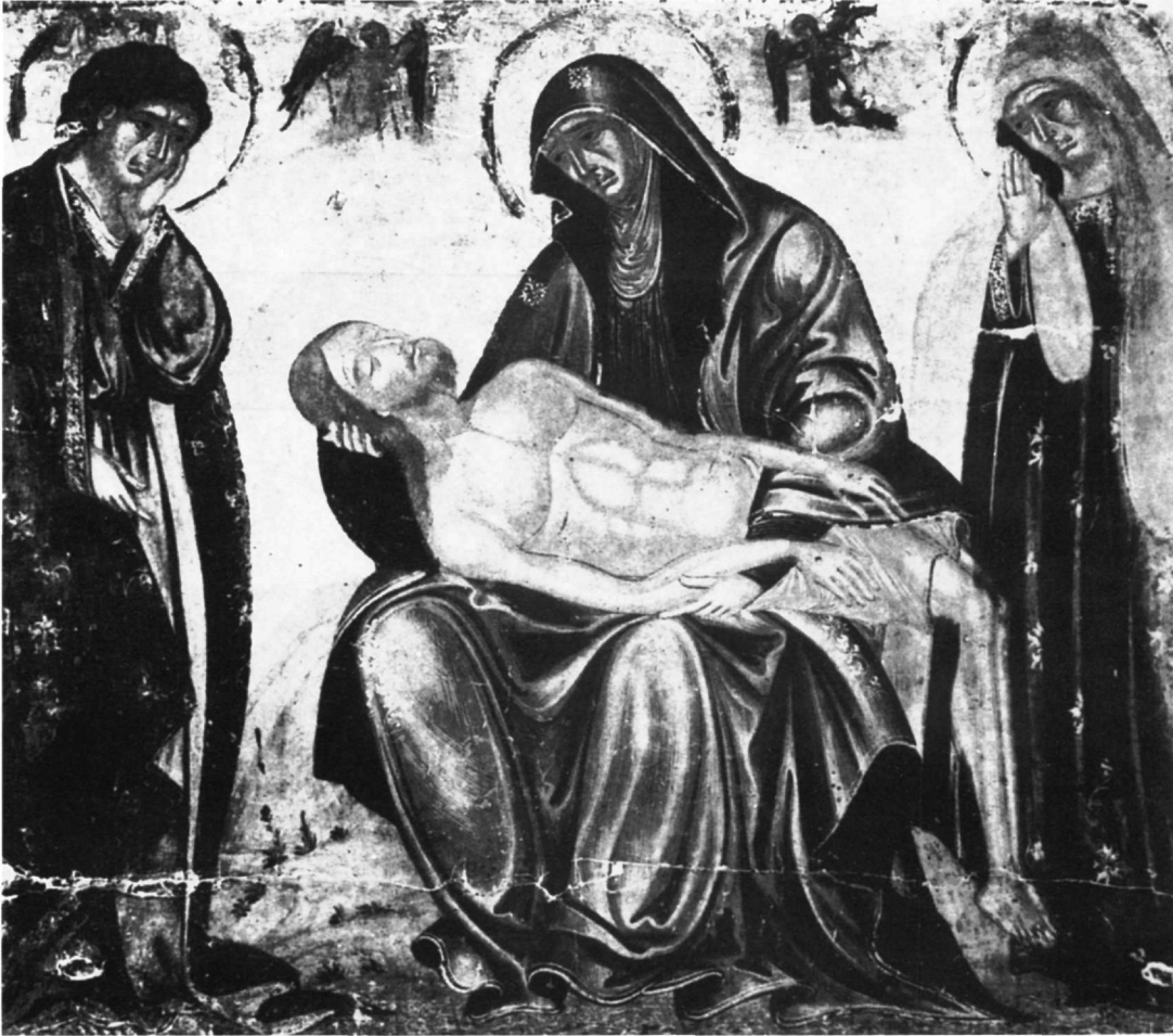
Εικ. 6. Πιετά με τον άγιο Ιωάννη και τη Μαρία τη Μαγδαληνή. Πράγα, Εθνική Πινακοθήκη.

μονής Φιλανθρωπικών στο νησί των Ιωαννίνων, όπως στην εικόνα μας 34 .