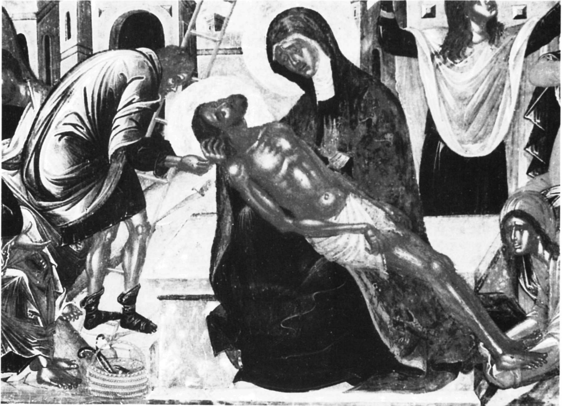
Εικ. 2. Λεπτομέρεια της Εικ. 1.

μπλεγμα της Παναγίας με το Χριστό είναι ακριβής μεταφορά της Πιετά, θέμα ιδιαίτερα προσφιλές στη Δύση 3 που πρωτοεμφανίστηκε στη θεματογραφία των κρητικών ζωγράφων το 15ο αιώνα, στα πρώτα μετά την Άλωση χρόνια 4 .