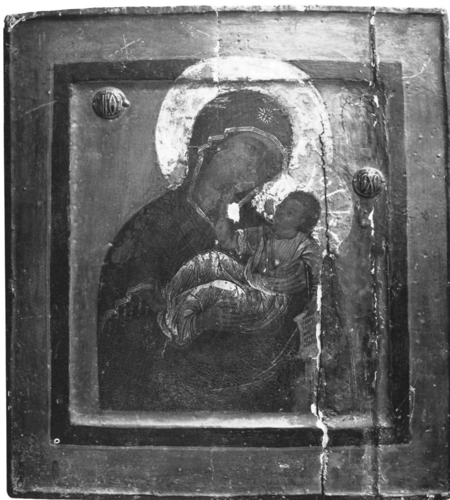
Fig. 1. Laure de Saint-Sabbas. Icône de la Vierge à l'Enfant.