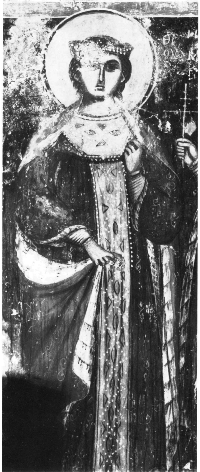
Εικ. 7. Ναός Παναγίας Γκουβερνιώτισσας, Κρήτη. Η αγία Θεοδώρα.