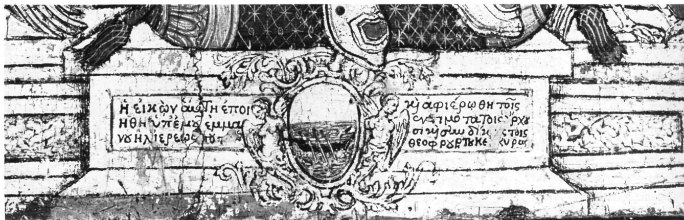
Εικ. 5. Αθήνα. Βυζαντινό Μουσείο. Η αφιερωματική επιγραφή της εικόνας της αγίας Θεοδώρας.