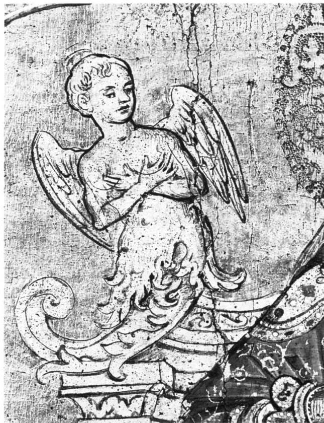
Εικ. 3-4. Αθήνα. Βυζαντινό Μουσείο. Λεπτομέρειες της εικόνας της αγίας Θεοδώρας.

να αποδίδει στο ίδιο έργο την πτυχολογία με διαφορετικό τρόπο 8 , άλλοτε σχηματική, όπως στα ενδύματα της Παναγίας και του Χριστού της εικόνας μας, και άλλοτε ρέουσα, όπως στο μανδύα της αγίας, απαντά κυρίως σε βενετσιάνικα έργα, όπως για παράδειγμα στις εικόνες του αγίου Γοβδελαά και του αγίου Ανδρέα (1658) 9 στη Βενετία. Η λεπτομερής απόδοση των πολυτελών υφασμάτων, που διακοσμούνται με χρυσοκεντήματα και πολύτιμες πέτρες, χαρακτηρίζει έργα της κερκυραϊκής και της ενετικής περιόδου του ζωγράφου· το στοιχείο αυτό απαντά στην εικόνα του αγίου Ιωάννη του Δαμασκηνού στο ναό των Αγίων Ιάσωνος και Σωσιπάτρου (1654) 10 και στην εικόνα του αγίου Βασιλείου στο Ελληνικό Ινστιτούτο της Βενετίας (1677) 11 . Οι στικτοί φωτοστέφανοι απαντούν κυρίως σε έργα της ενετικής περιόδου, όπως στην εικόνα με τον ένθρονο άγιο Ιάκωβο (1683) στη Βενετία 12 και τον άγιο Γοβδελαά. Τέλος, ένα στοιχείο που επαναλαμβάνεται στις εικόνες με μεμονωμένους αγίους είναι η τοποθέτηση της μορφής κάτω από τόξο, το οποίο πλαισιώνει και προβάλλει το κεντρικό θέμα. Τέτοια τόξα βρίσκουμε σε τρεις εικόνες του 1654 στην Κέρκυ-