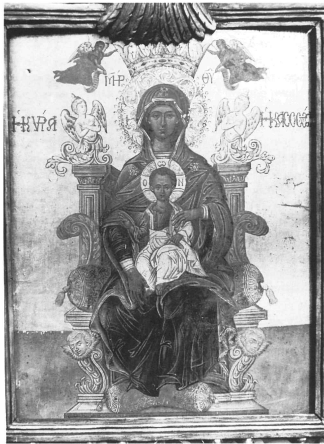
Εικ. 8. Αθήνα. Ιδιωτική Συλλογή. Παναγία η Κασσωπίτρα.

Μετά από αυτές τις παρατηρήσεις γίνεται φανερό ότι ο Τζάνες δημιούργησε μια πρωτότυπη σύνθεση, όχι μόνο στη γενική σύλληψή της, αλλά και στις επιμέρους λεπτομέρειές της, όπου συνεδύασε εύστοχα παραδοσιακά στοιχεία από την εικονογραφία της αγίας αλλά και νεότερα. Επιπλέον, άντλησε στοιχεία και από άλλες συνθέσεις, τα οποία ενσωμάτωσε και προσάρμοσε σε ένα καινούργιο σχήμα, δίνοντάς τους και νέο περιε-