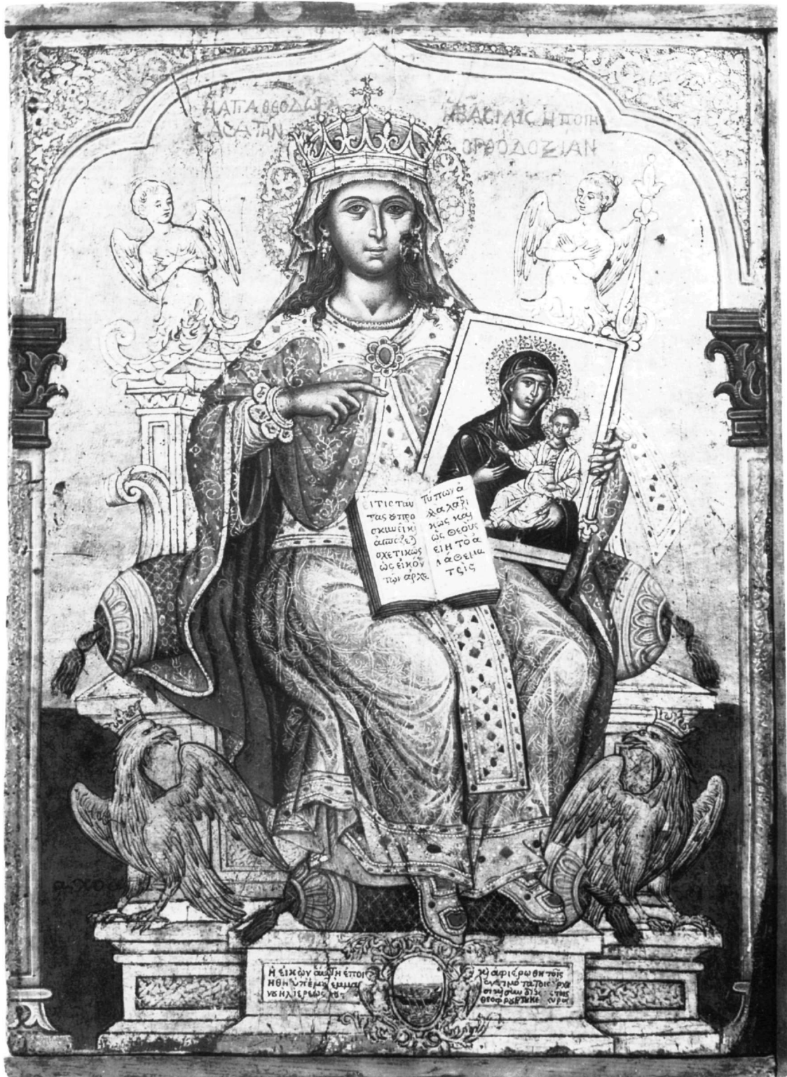
Ειχ. 1. Αθήνα. Βυζαντινό Μουσείο. Η αγία Θεοδώρα.