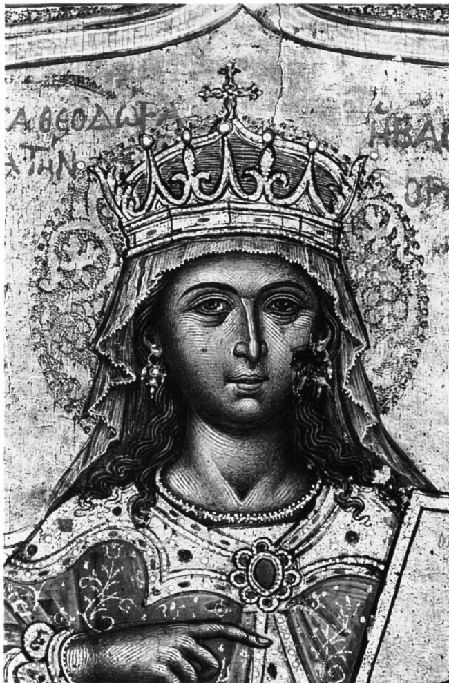
Εικ. 2. Αθήνα. Βυζαντινό Μουσείο. Η αγία Θεοδώρα (λεπτομέρεια).

Ο δυϊσμός που χαρακτηρίζει την καλλιτεχνική παραγωγή του Τζάνε στο σύνολό της, και ιδιαίτερα τα έργα που πραγματοποίησε κατά την παραμονή του στην Κέρκυρα και κατόπιν στη Βενετία, είναι εμφανής και