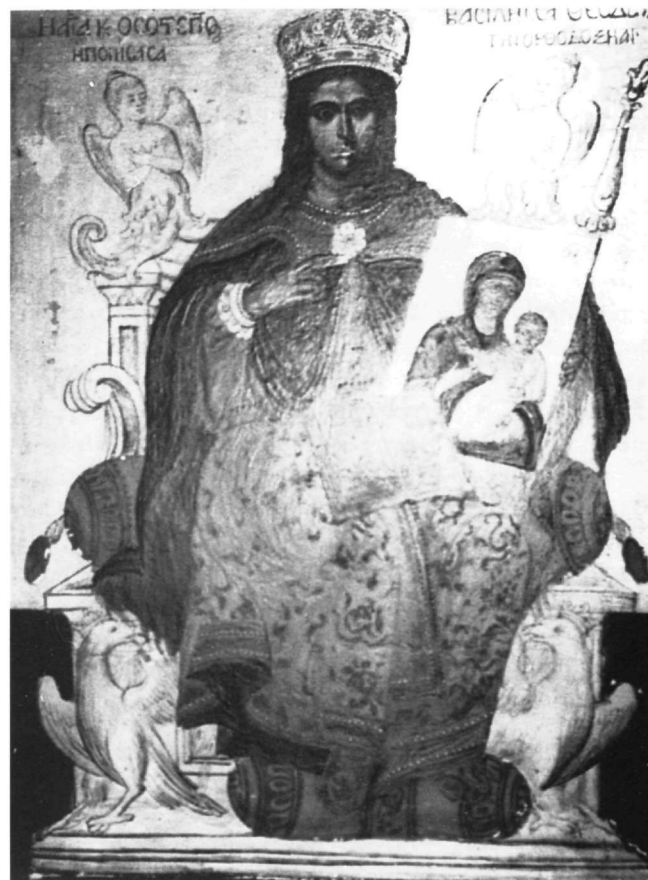
Εικ. 9. Βενετία. Ελληνικό Ινστιτούτο. Η αγία Θεοδώρα.