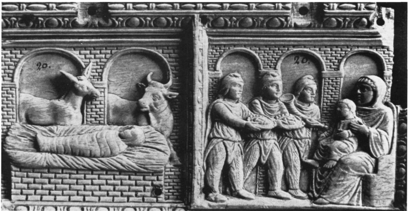
Εικ. 4. Πλακίδιο από ελεφαντοστό με τη Γέννηση και την Προσκύνηση των Μάγων (V. H. Elbern, βλ. υποσημ. 14).