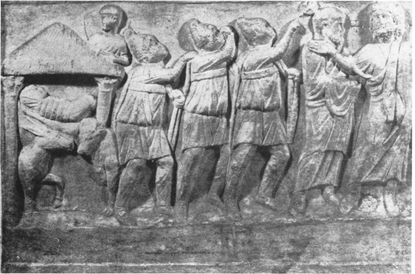
Εικ. 3. Σαρκοφάγος του Μιλάνου. Λεπτομέρεια (Brenk, βλ. υποσημ. 15).