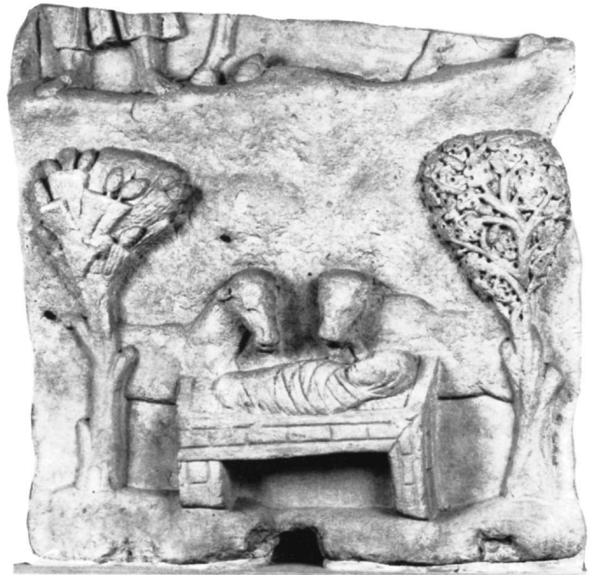
Εικ. 1. Πλάκα Τ. 95 του Βυζαντινού Μουσείου.