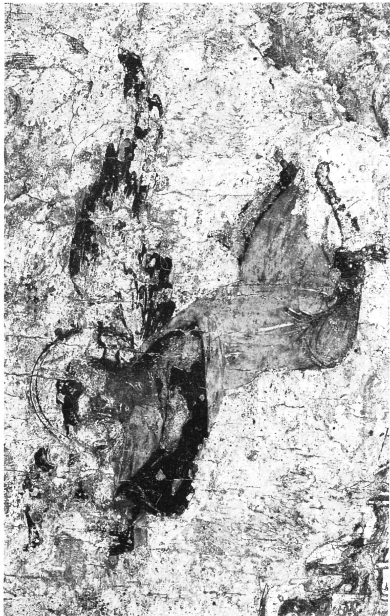
Εικ. 1. Ο αριστερός ιπτάμενος άγγελος. Λεπτομέρεια της εικόνας με την παράσταση της εκκλησίας του Αγίου Γεωργίου των Ελλήνων.

Οι πιο λαμπροί τόνοι της παράστασης είναι το κόκκινο του κιννάβαρι, η κόκκινη λάκα και το πράσινο, που με ισορροπία έχουν κατανεμηθεί μέσα στη σύνθεση. Σήμερα, η ισορροπία αυτή έχει κατά τη γνώμη μας ανατραπεί από την αλλοίωση του πράσινου και τη μετατροπή του σε μαύρο. Πιστεύουμε ότι πρόκειται για τη γνωστή χημική αλλοίωση της πράσινης χρωστικής verdigris, η οποία όταν χρησιμοποιείται σε διάλυμα ρητίνης (copper resinate) έχει την ιδιότητα με την πάροδο του χρόνου να μαυρίζει επιφανειακά και να διατηρεί το χρώμα της μόνο στο βάθος του στρώματος 4 . Έτσι, το ιμάτιο του επιφανιόμενου Χριστού (Εικ. 2), οι χιτώνες των δύο αγγέλων (Εικ. 1), το κλαδί φοίνικα του ενός, ο χιτώνας και τα υποδήματα του αγίου Γε-