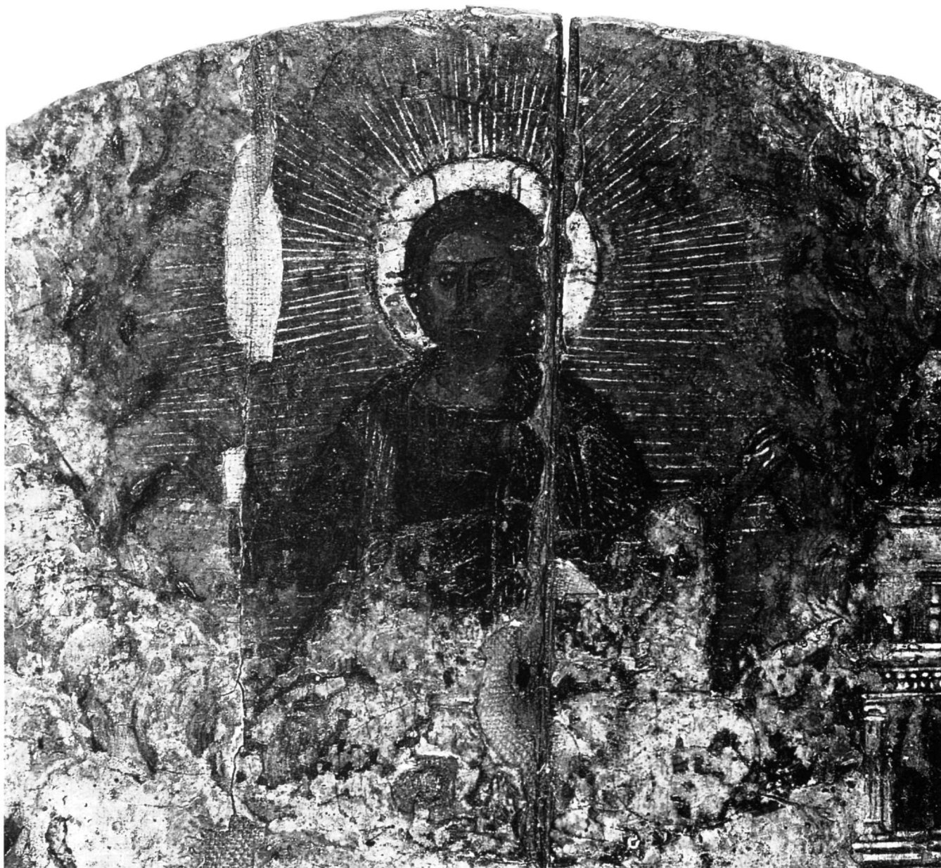
Εικ. 2. Ο Χριστός Παντοκράτωρ. Λεπτομέρεια της εικόνας με την παράσταση της εκκλησίας του Αγίου Γεωργίου των Ελλήνων.

του αγίου Νικολάου και στους χιτώνες του Χριστού και του δεξιού αγγέλου. Ενδιαφέρον παρουσιάζουν και τα μικροσκοπικά αγγελάκια, τα μισοκρυμμένα μέσα στα σύννεφα που περιβάλλουν τον Χριστό, ζωγραφισμένα τα περισσότερα από κόκκινη λάκα κατά τρόπο τελείως σχηματικό. Ο κάμπος της παράστασης είναι από στιλβωτό χρυσό με μπόλο σκούρο πορτοκαλί. Οι άψογα εκτελεσμένες χρυσοκοντυλιές έχουν γίνει με φύλλο χρυσού και την τεχνική της μίχτιον, κατά τον τρόπο πιθανώς που περιγράφεται στην Ερμηνεία του Διονυσίου