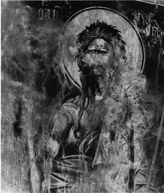
Είκ. 10. Ὁ ἅγιος Ἰωάννης ὁ Πρόδρομος (τοιχογραφία μεταβυζαντινῆ).