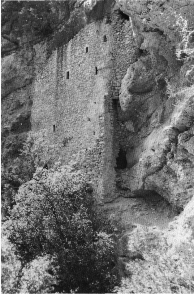
Είκ. 1. Μαρτύριο στο Γεράκι. Τό 'Ασκηταριό.