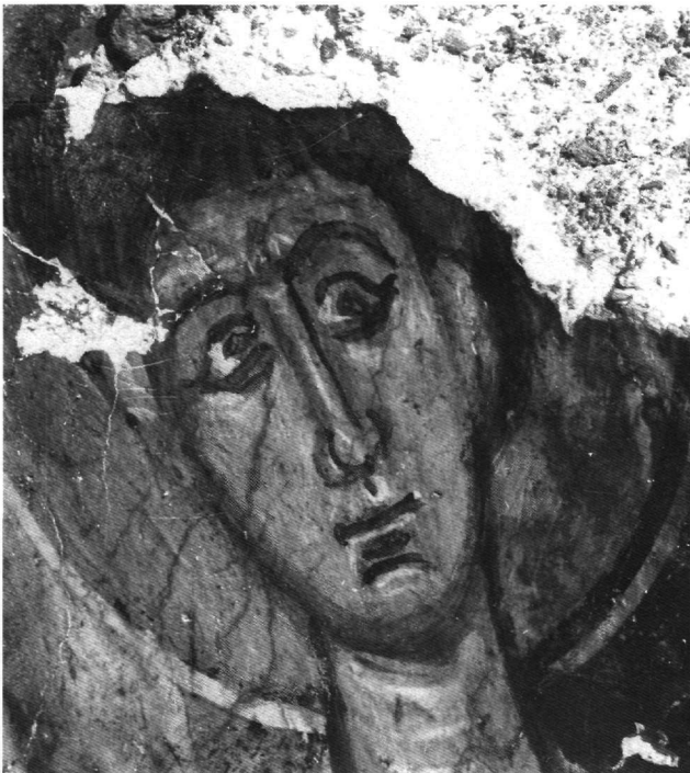
Είκ. 9. 'Ο άγιος Στέφανος, λεπτομέρεια.

ριστικά. 'Ο αρχάγγελος κρατεί μέ τά δύο χέρια κίτρινο ριπίδιο, πού έχει διάκοσμο σέ κερασί χρώμα. 'Ο δεξιός άγγελος (Είκ. 7), τού όποιου δέν σώζεται τό όνομα, προφανώς ό Γαβριήλ, έχει άδρά χαρακτηριστικά, σέ κερασί χρώμα, στιχάρι λευκό μέ κίτρινες γραμμικές σκιές, τραχηλιά καί όράριο κερασί. Στο παχουλό παιδικό πρόσωπό του τά λευκά φώτα λίγες, άραιές, άρκετά πλατιές γραμμές.