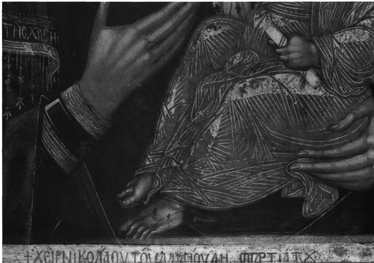
Εἰκ. 7. Ἡ ὑπογραφή τοῦ ζωγράφου.

24. Ὅπως πρὸχ. στήν Περίβλεπτο τῆς Ἀχρίδας καί στήν Ὁδηγήτρια τῆς μονῆς Βλατάδων (ὁ.π.).