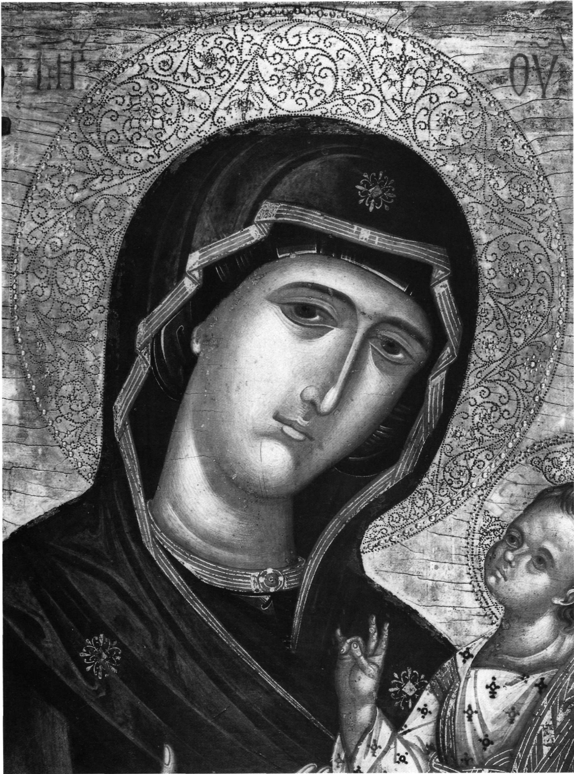
Είκ. 2. Ἡ Παναγία, λεπτομέρεια.