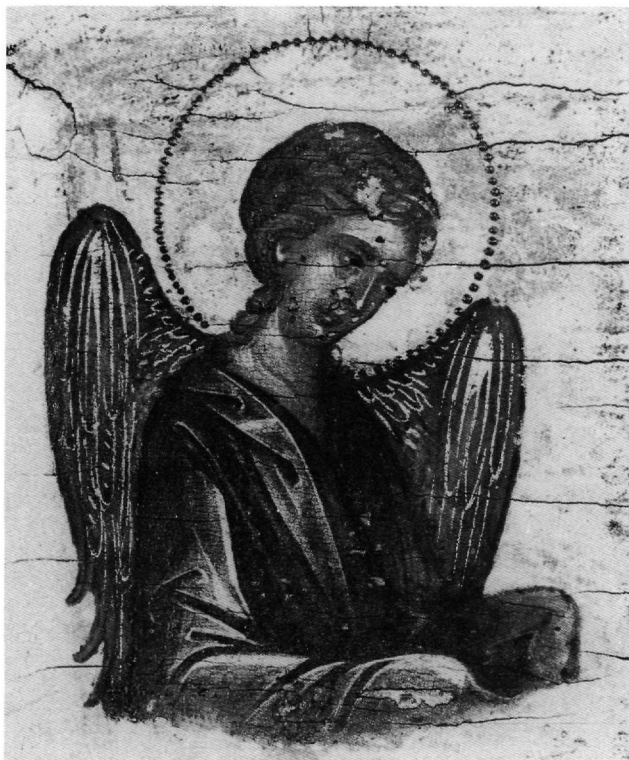
Εικ. 5. 'Ο αρχάγγελος Μιχαήλ.

“Οχι μόνο σ’ αυτό τό σημείο, αλλά σέ πολλές καί ση- μαντικές γιά τό υφος καθόλου του έργου τυπολογικές καί μορφικές λεπτομέρειες, είναι πρόδηλη ή διαφορά ερμηνείας του Σπαρτιάτη ζωγράφου από του ’Ανδρέα Ρίτζου στην ύποδειγματική εικόνα του Βατικανού καί στις αποδιδόμενες καί αναφερόμενες άλλες, πού άκο- λουθούν πιστά τό πρότυπο του Κρητικού ζωγράφου. Τήν έντονότερη στροφή καί κλίση τής Θεοτόκου προς τό παιδί παρακολουθούν, διαφοροποιημένες καί πλου- σιότερες, οί πτυχές τής χρυσογραμμένης παρυφής στο μαφόριο, πού άρμονικά πλαισιώνουν τό πρόσωπο, καί μέ συνακόλουθη κίνηση τό σταυρωτό κλείσιμό του στό στήθος λοξοδρομεί πολύ δεξιότερα (Εικ. 1 καί 2). Τά χρυσά σταυρικά άστρα, σάν περίτεχνα, άκριβά κοσμήματα στο μαφόριο καί τό λιθοποίκιλτο τής παρυφής στο λαιμό του φορέματος, τά πλούσια καί μακριά κρόσσια καί ή διπλή, κοσμημένη παρυφή στο χέρι πού κλείνει τήν έπιγραφή του ψαλμού διαφέρουν έπίσης, έχοντας άνάλογα σέ παλαιολόγια έργα 22 . ’Εγγύτερη στά βυζαντινά πρότυπα είναι καί ή στάση του παιδιού. Τή χαρακτηρίζουν, στον τρόπο πού κάθε- ται, τό άνασήκωμα του δεξιού του ποδιού καί ή σχεδόν παράλληλη θέση των ποδιών κάτω, καί ή κατακόρυφη του δεξιού του χεριού στή χειρονομία τής εϋλογίας, πού δέν άπαντώνται στο κρητικό υπόδειγμα 23 . Στά πα- λαιολόγια στοιχεία του έργου άνήκουν επίσης ή πο-