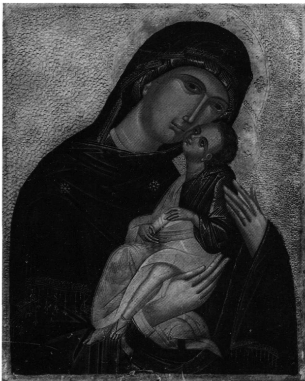
Εικ. 8. Γενεύη, Μουσείο 'Ιστορίας και Τέχνης. Εικόνα της Παναγίας Γλυκοφιλούσας.

αφήνοντας να φανεί μόλις τό σκοτεινόχρωμο πράσινο, όμοιο του κομπού κεφαλόδεσμου, φόρεμα στό λαιμό μέ τήν πολύτιμη πόρπη. Τό ζεστό χρυσαφένιο ίμάτιο του Χριστού και ό λευκορόδινος χιτώνας, μέ δυνατά φωτίσματα, άστράφτουν στό μυστικό φώς τής εικόνας, προβάλλοντας τήν πλαστική, γεροδεμένη μορφή του παιδιού μέ τό χυμώδες ανάγλυφο. Οί στάσεις είναι άβρές και άνετες, οί χειρονομίες άκριβείς και νευρώδεις. Απτή πλαστικότητα που τονίζει τίς στρογγυλότητες γεμάτων προσώπων, έκφραση ήρεμη, προσηνής και μειλίχια· ή γλυκύτητα των άγγέλων μέ τό παλαιολόγιο πλάσιμο των χαριτωμένων μορφών τους (Εικ. 5 και 6) και μία άδιόρατη, δυτικότροπη αισθαντικότητα που προσδίδει κάποια «έκκοσμίκευση» κάλλους στην Παναγία και τονίζει τίς «ύγρές» διαφάνειες στό δεξιό χέρι της αποτελούν επίσης γνωρίσματα ύφους τής εικόνας του Νικολάου Λαμπούδη, που διακρίνεται έξίσου για τή σοφή συμμετρία τής σύνθεσης, στην όποία εντάσσονται όργανικά οί επιγραφές.