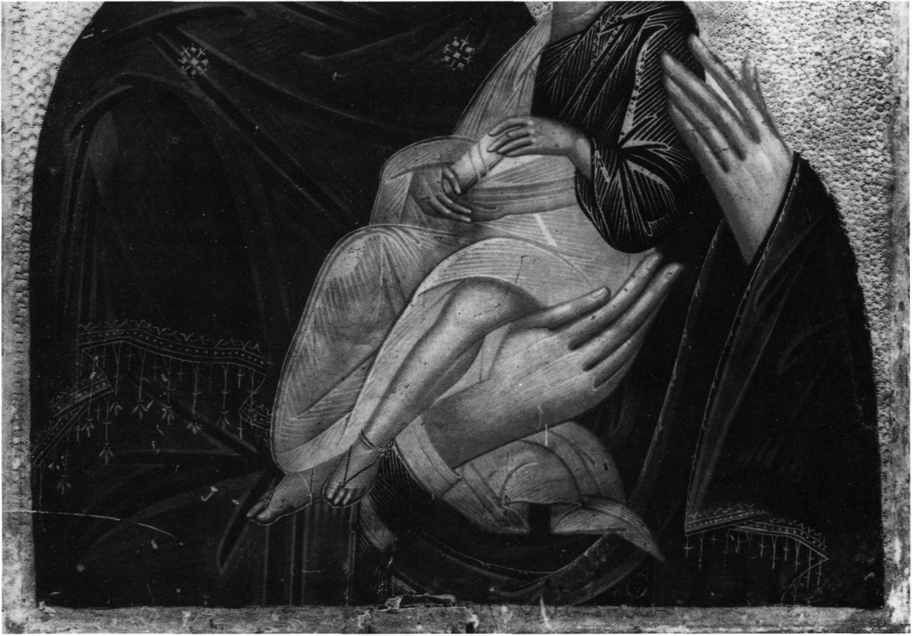
Είκ. 9. Παναγία Γλυκοφιλούσα, λεπτομέρεια τής Είκ. 8.

τριδωνυμικού ΣΠΑΡΤΙΑΤΟΥ φαίνεται άκριβώς νά δηλώνει, όπως στην ανάλογη περίπτωση του ζωγράφου Ξένου Διγενή από τό Μουχλί τής Πελοποννήσου, τήν άπόσταση του Νικολάου Λαμπούδη από τό γενέθλιο τόπο γιά τόν όποιο σεμνύνεται 33 . "Άλλωστε, τά προ-