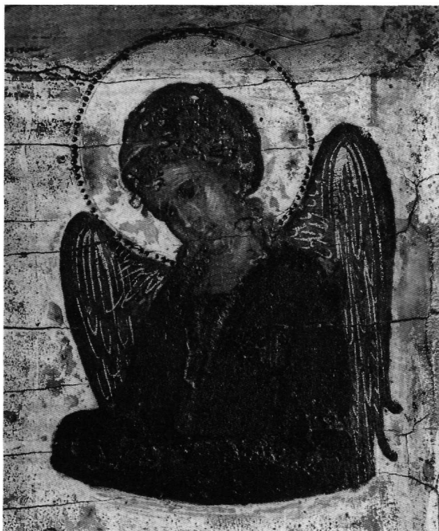
Εικ. 6. 'Ο αρχάγγελος Γαβριήλ.

“Οχι μόνο σ’ αυτό τό σημείο, αλλά σέ πολλές καί ση- μαντικές γιά τό υφος καθόλου του έργου τυπολογικές καί μορφικές λεπτομέρειες, είναι πρόδηλη ή διαφορά ερμηνείας του Σπαρτιάτη ζωγράφου από του ’Ανδρέα Ρίτζου στην ύποδειγματική εικόνα του Βατικανού καί στις αποδιδόμενες καί αναφερόμενες άλλες, πού άκο- λουθούν πιστά τό πρότυπο του Κρητικού ζωγράφου. Τήν έντονότερη στροφή καί κλίση τής Θεοτόκου προς τό παιδί παρακολουθούν, διαφοροποιημένες καί πλου- σιότερες, οί πτυχές τής χρυσογραμμένης παρυφής στο μαφόριο, πού άρμονικά πλαισιώνουν τό πρόσωπο, καί μέ συνακόλουθη κίνηση τό σταυρωτό κλείσιμό του στό στήθος λοξοδρομεί πολύ δεξιότερα (Εικ. 1 καί 2). Τά χρυσά σταυρικά άστρα, σάν περίτεχνα, άκριβά κοσμήματα στο μαφόριο καί τό λιθοποίκιλτο τής παρυφής στο λαιμό του φορέματος, τά πλούσια καί μακριά κρόσσια καί ή διπλή, κοσμημένη παρυφή στο χέρι πού κλείνει τήν έπιγραφή του ψαλμού διαφέρουν έπίσης, έχοντας άνάλογα σέ παλαιολόγια έργα 22 . ’Εγγύτερη στά βυζαντινά πρότυπα είναι καί ή στάση του παιδιού. Τή χαρακτηρίζουν, στον τρόπο πού κάθε- ται, τό άνασήκωμα του δεξιού του ποδιού καί ή σχεδόν παράλληλη θέση των ποδιών κάτω, καί ή κατακόρυφη του δεξιού του χεριού στή χειρονομία τής εϋλογίας, πού δέν άπαντώνται στο κρητικό υπόδειγμα 23 . Στά πα- λαιολόγια στοιχεία του έργου άνήκουν επίσης ή πο-