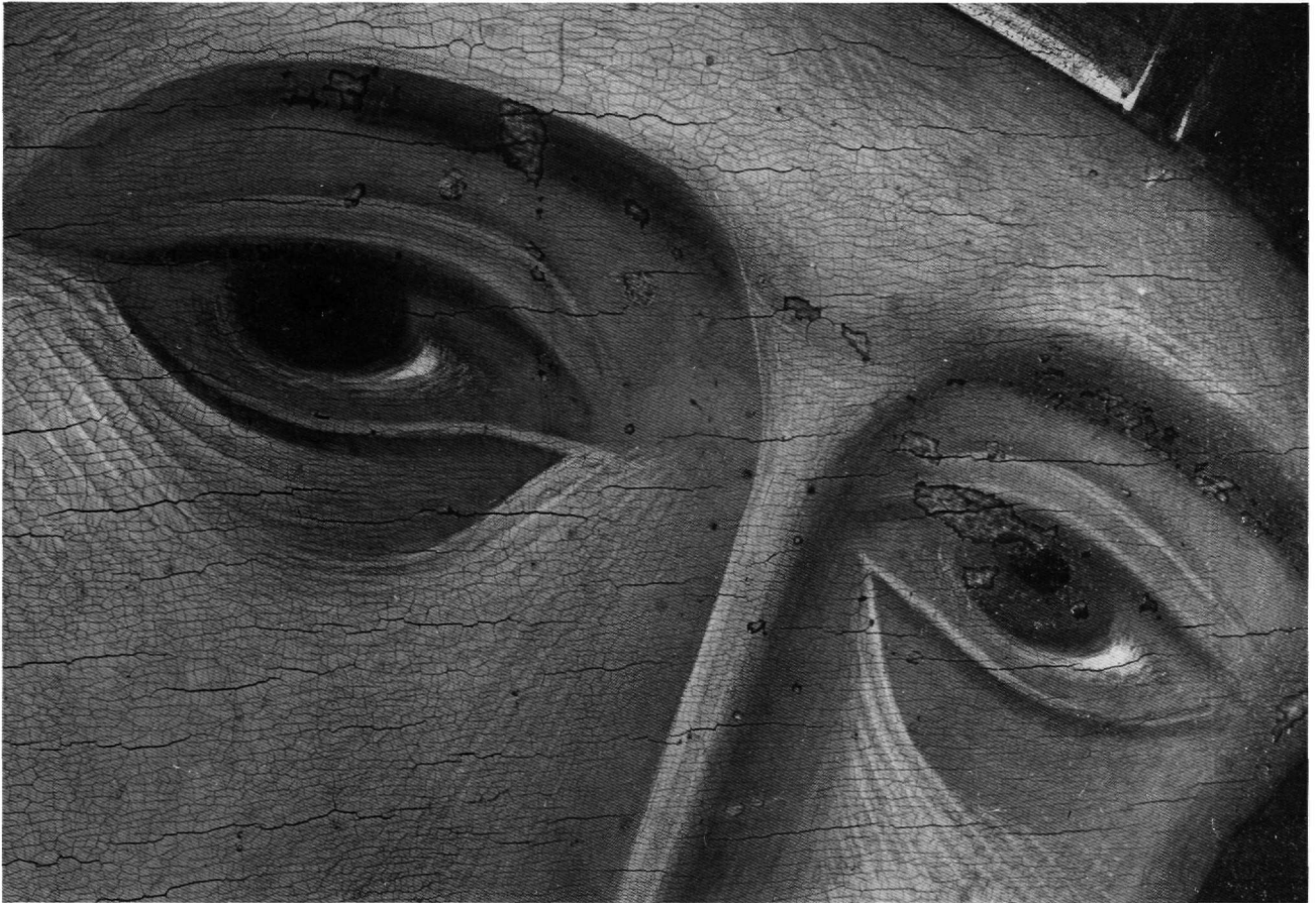
Είκ. 3. Ἡ Παναγία, λεπτομέρεια.

τάδων στη Θεσσαλονίκη 10 και κατόπιν σέ τοιχογραφίες και εικόνες τῆς Θεοτόκου, κατά κανόνα μέ τό παιδί, ζωγραφικῶν ἐργαστηρίων τῶν Ἰωαννίνων και, βορειότερα, τοῦ Prilep 11 . Εἶναι ἀδηλο ἂν ἡ δημιουργία αὐτοῦ τοῦ στοιχείου ἀνήκει στήν Κωνσταντινούπολη ἢ στή Θεσσαλονίκη. Γιά τή σύνδεση μέ τήν Πρωτεύουσα, μπορεῖ νά εἶναι ἐνδεικτική ἡ στενή εἰκονογραφική σχέση τῆς Παναγίας στό δίπτυχο τῶν Ἰωαννίνων πού βρίσκεται στήν Guenca τῆς Ἰσπανίας — ὅπου ἡ ἀναγραφή ἀπό τόν ψαλμό 12 — μέ τή σύγχρονη, ἀπό τήν Κωνσταντινούπολη, εἰκόνα τῆς λεγόμενης Παναγίας τοῦ Pimen στή Ρωσία 13 , ὅσο και ἡ παρουσία ἐπιγραφῆς ἢ ψευδοεπιγραφῆς στήν ἴδια θέση στό μαφόριο τῆς λεγόμενης Παναγίας τοῦ Don στή Ρωσία, ἀπό τούς ἴδιους, ὕστερους τοῦ 14ου αἰ. χρόνους, ἡ ὁποία ἀποδίδεται στόν μεγάλο Κωνσταντινουπολίτη ζωγράφο Θεοφάνη τόν Ἕλληνα 14 . Γιά τήν ἐνδεχόμενη, ἐξάλλου, σύνδεση τοῦ ὄψιμου, δογματικῆς και κοσμητικῆς σημασίας στοιχείου — ἀλληγορικῆς και πραγματικῆς — μέ τήν ἡσυχαστική θεωρία τῆς ἐποχῆς, και εἰδικότερα μέ τή διδασκαλία τοῦ ἁγίου Γρη-