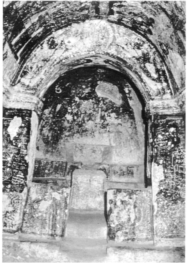
Εικ. 4. Karabas kilise, άποψη της αψίδας (1060-1061).

Στους τοίχους του Ιερού εκτυλίσσεται κυρίως ο δογματικός κύκλος, με σκηνές ιδιαίτερα συμβολικές, όπως η Μετάληψη και η Μετάδοση των αποστόλων 61 ή η νοητή παρουσία των ιεραρχών στον χώρο γύρω από την αγία τράπεζα 62 , ενώ αντίθετα, στους τοίχους και στους θόλους του κυρίως ναού προβάλλονται οι κατά κύριο λόγο αφηγηματικές σκηνές από τον χριστολογικό και από τον θεομητορικό κύκλο. Έτσι, ανάμεσα στους δύο χώρους υπάρχει ένα νοητό «χάσμα», το οποίο έρχεται να γεφυρώσει στα παραπάνω μνημεία η σκηνή του Ευαγγελισμού, για να άρει την αυτονομία των δύο χώρων και να δείξει ότι τα εικονογραφικά τους προγράμματα αποτελούν ενιαίο σύνολο. Η σκηνή αυτή επομένως, που πλέον απλώνεται και δεσπάζει στον χώρο, αποβαίνει ο συνδετικός κρίκος ανάμεσα στους δύο κύκλους, αφού φαντάζει να μετέχει και στο πρόγραμμα του Βήματος και σ' εκείνο του κυρίως ναού.