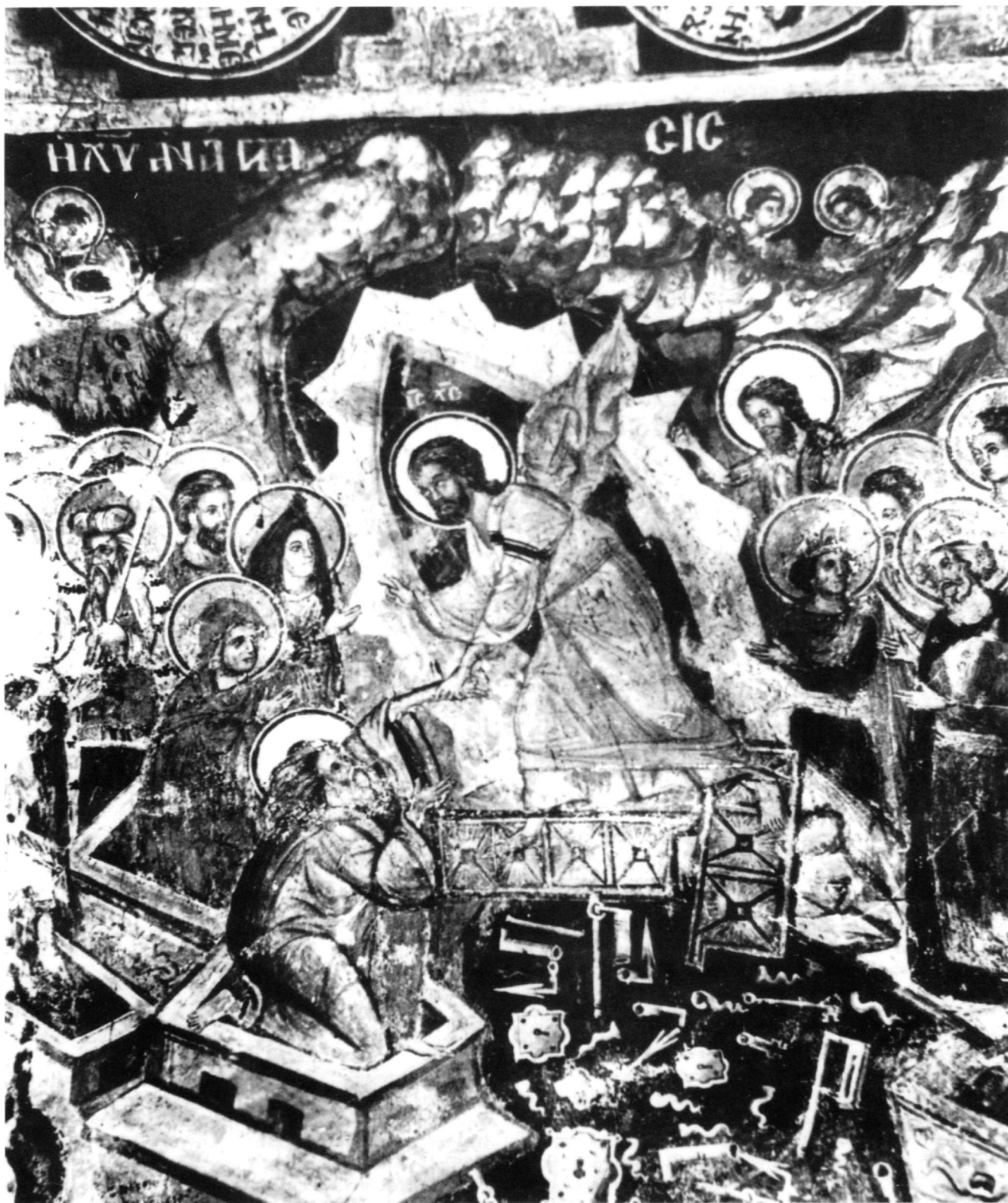
Εικ. 8. Μετέωρα. Μονή Μεταμορφώσεως (1483).