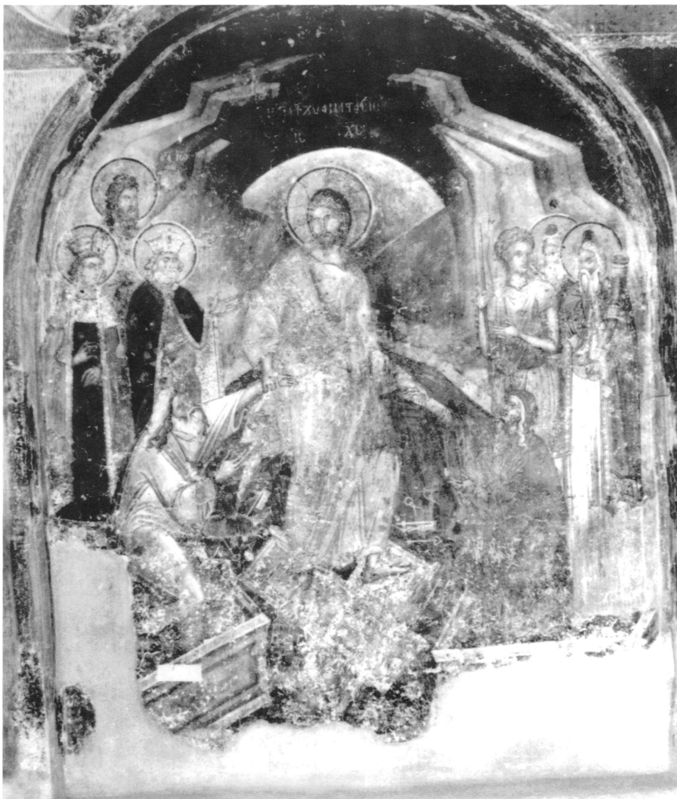
Εἰκ. 2. Βέροια. Ναὸς τοῦ Χριστοῦ (1314-15).