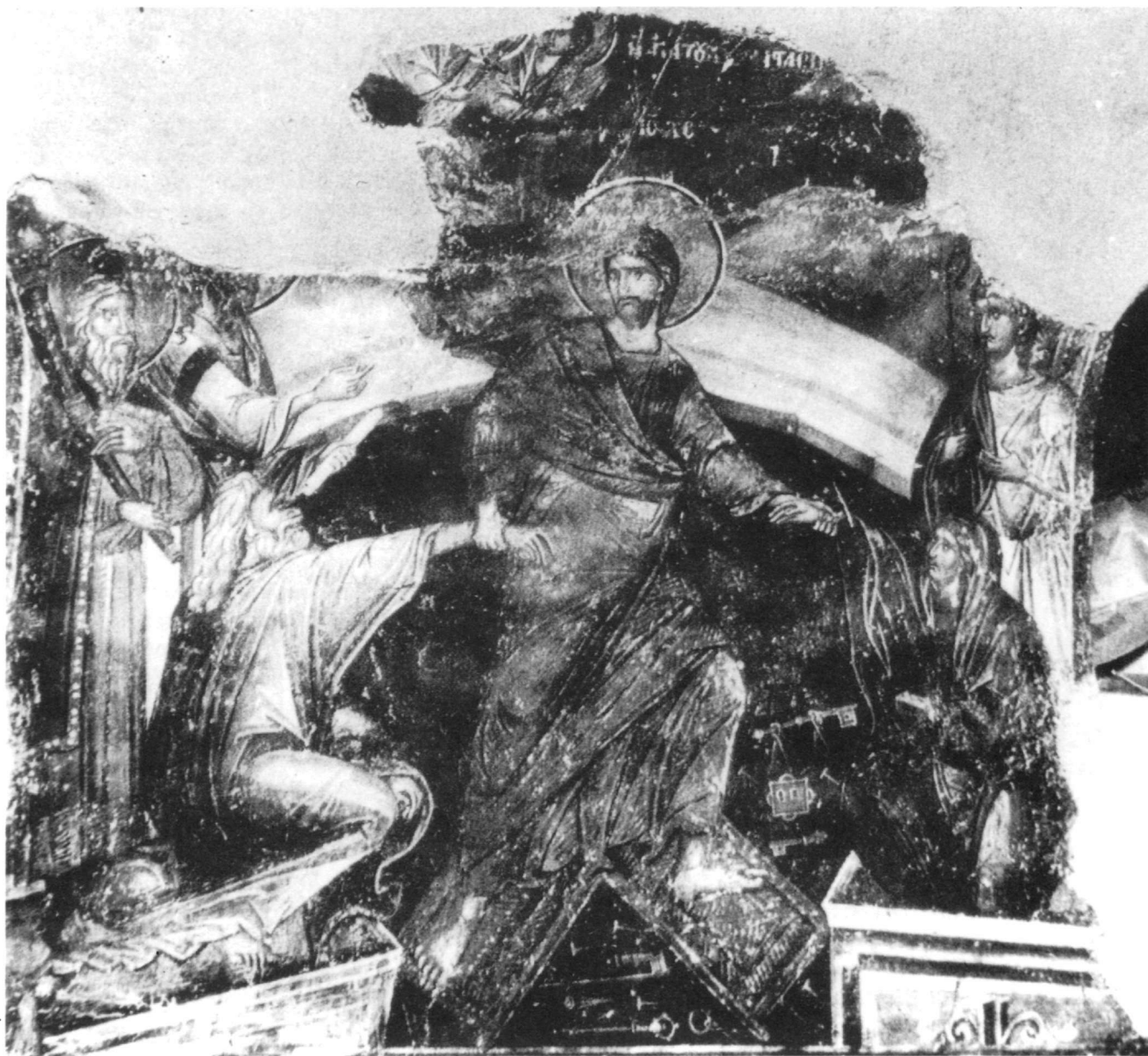
Εἰκ. 5. Θεσσαλονίκη. Ναὸς Ἁγίου Νικολάου Ὁρφανοῦ (πρώμος 14ος αἰ.).