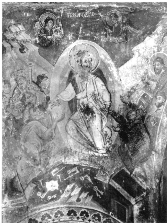
Εἰκ. 4. Ἀχρίδα. Ναὸς Ἁγίου Νικολάου Bolnicki (1480-1).