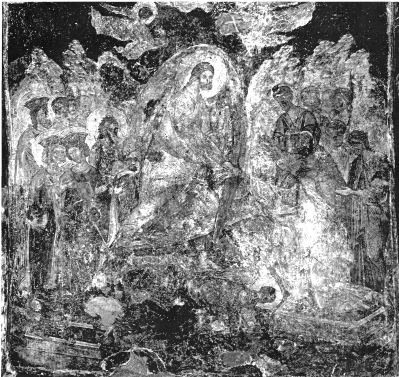
Εἰκ. 7. Μυστρᾶς. Μονὴ Περιβλέπτου (τρίτο τέταρτο 14ου αἰ.).

Καβαλαριανὰ Καντάνου, στὸν Ἅγ. Μάρμα στὸν Τριχινιάκο Καντάνου, στὸν Προφήτη Ἡλία Τραχινιάκου Καντάνου, στὸν Ἅγ. Ἰωάννη τὸν Θεολόγο στὸν Τραχινιάκο Καντάνου καὶ σὲ ἄλλους ναοὺς (προσωπικὴ παρατήρηση).