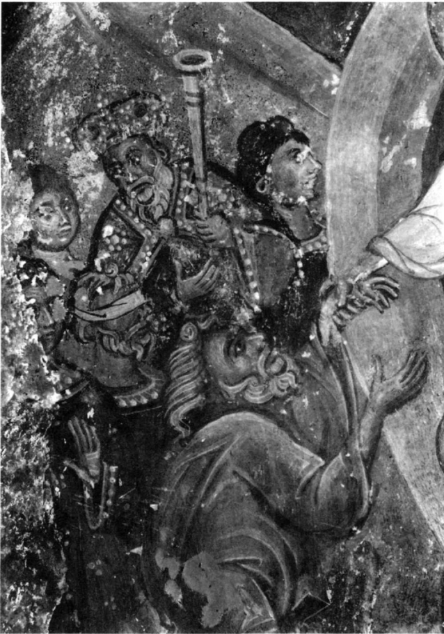
Εικ. 6. Ἀρχίδα. Ναὸς Ἁγίου Νικολάου Bolnicki (1480-1), λεπτομέρεια τῆς εἰκ. 5.

Σὲ ὀρισμένες ὑστεροβυζαντινὲς παραστάσεις, ὅπως στὴν Παναγία Ἐλεούσα τῆς Μεγάλης Πρέσπας (1409-10) 48 , στὸν Ἅγ. Ἀνδρέα (Ροσοῦλη) τῆς Καστοριάς (15ος αἰ.) 49 καὶ σὲ ἄλλες εἰκονίσσεις μεταβυζαντινῶν μνημείων 50 , παριστάνονται ἀδιάγνωστοι ἱερεῖς τῶν Ἑβραίων ποὺ κρύβονται μερικῶς πίσω ἀπὸ τὰ κύρια πρόσωπα τῆς σύνθεσης. Ἐνδιαφέρον εἶναι ὅτι σὲ ἀρκετὲς παραστάσεις στὴν Κρήτη 51 εἰκονίζεται μεταξὺ τῶν ἀνισταμένων ἀνυπόγραφος γέροντας ἢ μεσήλικας ποὺ φορᾶ ἓνα χαρακτηριστικὸ ὑφασμάτινο σκούφο, παρόμοιο μὲ αὐτὸν τοῦ Ἁγ. Κυρίλλου Ἀλεξανδρείας 52 . Νομίζω ὅτι στὶς παρα-