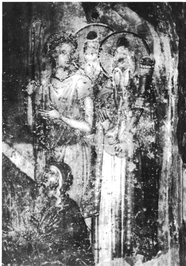
Εἰκ. 3. Βερόια. Ναὸς τοῦ Χριστοῦ (1314-15) (λεπτομέρεια τῆς εἰκ. 2).

Ἄπὸ τοὺς τρεῖς ἱερεῖς συχνότερα εἰκονίζεται ὁ ἱερεὺς Σαμουὴλ, προφανῶς ἐπειδὴ ἀναφέρεται στὸ Α' Βασ. 28, 3-25. Τὸν Σαμουὴλ, ἐνῶ βρισκόταν στὸν Ἄδη, καλεῖ ὁ βασιλεὺς Σαοὺλ διὰ μέσου τῆς ἐγγαστρομύθου καὶ τὸν ἐρωτᾷ γιὰ τὶς ἐπιθέσεις τῶν ἐχθρῶν τοῦ Ἰσραὴλ. Ὁ Ὠριγένης καὶ ἄλλοι ἐκκλησιαστικοὶ συγγραφεῖς θεωροῦν τὸν Σαμουὴλ «κατάσκοπον καὶ θεωρητὴν τῶν μυστηρίων τῶν καταχθονίων» 27 . Ἐκτὸς ἀπὸ τὸν Σαμουὴλ εἰκονίζεται ὁ Ἀαρὼν μετὰ τὴν βλαστήσασα ράβδου του 28 καὶ ὁ Μωϋσῆς μετὰ τὴν ράβδου ποὺ ἐκτύπησε τὴν Ἐρυθρὰ θάλασσα. Ἡ θαυματουργικὴ διάβαση τῆς Ἐρυθρᾶς θάλασσας ἀπὸ τοὺς Ἰσραηλίτες καὶ ἡ βλαστήσασα ρά-