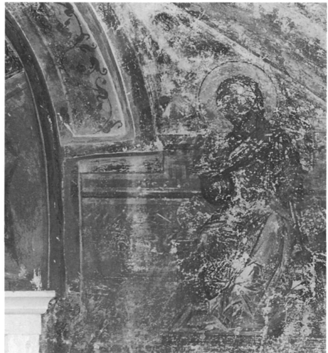
Εικ. 2-3. Ο Ευαγγελισμός της Παναγίας.

αναβιώνουν στη ζωγραφική έργων της κρητικής τέχνης. Έτσι, η πλούσια πτυχολογία του μανδύα που ανεμίζει, η περίτεχνη στρατιωτική ενδυμασία με τους θώρακες και τις μεταλλικές λάμες που τους συγκρατούν, οι ταινίες με τις οποίες τυλίγουν το κάτω μέρος των ποδιών και η ασπίδα με τη μάσκα απαντούν σε φορητές εικόνες κρητικής τέχνης του 15ου αιώνα 10 , οι οποίες είναι έργα του ζωγράφου Άγγελου ή συνδέονται με το εργαστήριο του Ανδρέα Ριτζου.