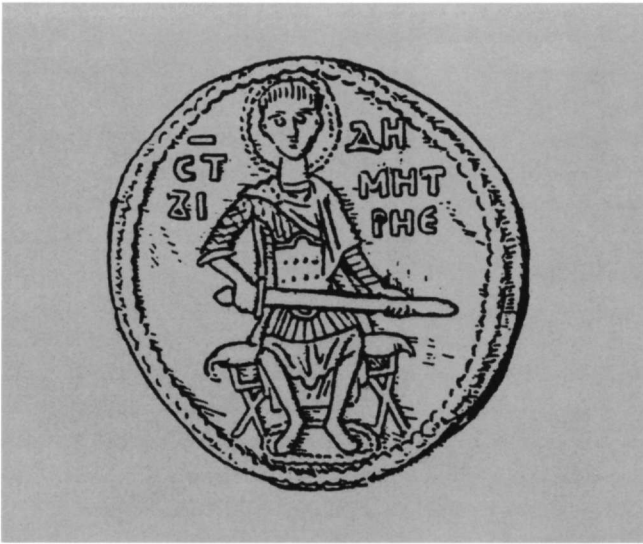
Εικ. 10. Άγιος Δημητρίος ένθρονος. Χρυσή σφραγίδα του βούλγαρου ηγεμόνα Ίβαν Ασάν Β'. 1230.