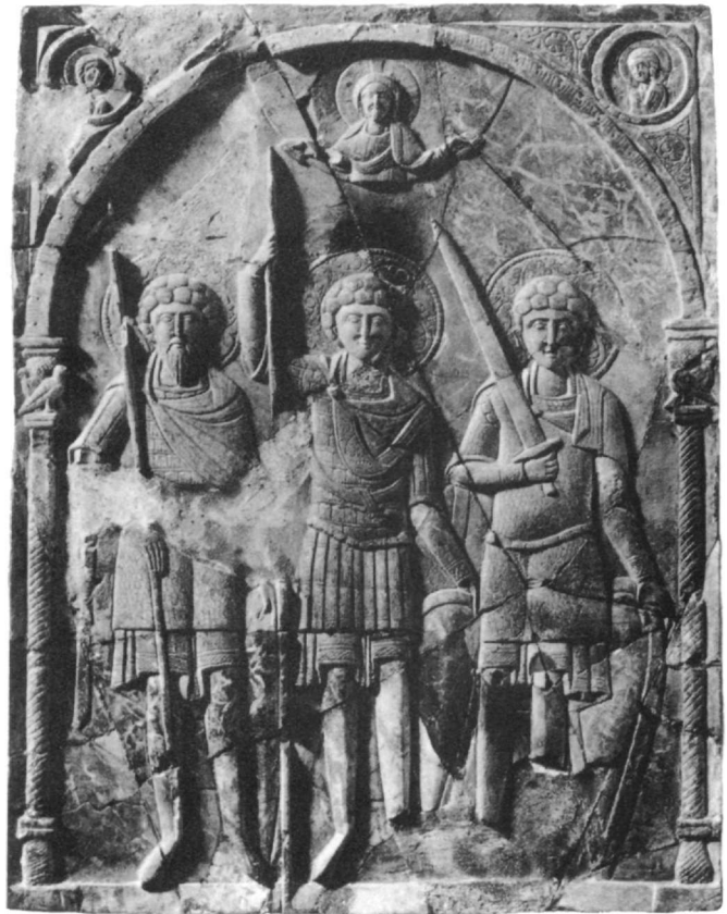
Εικ. 2. Άγιοι Θεόδωρος, Γεώργιος και Δημήτριος. Βυζαντινό πλακίδιο από στεατίτη. Μουσείο Χερσώνας, 12ος αι.

εικονίσεις του ο άγιος εικονίζεται έφιππος, δηλώνοντας την ευγενή καταγωγή του και συνδέοντας την αρετή του με την άρχουσα τάξη. Η μετατροπή του αγίου Θεοδώρου από πεζό στρατιώτη σε έφιππο, που συ-