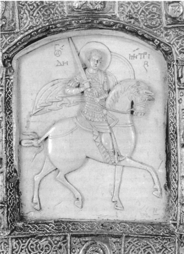
Εικ. 6. Άγιος Δημήτριος έφιππος. Βυζαντινό πλακίδιο από στεατίτη. Μόσχα, Κρεμλίνο. 14ος αι.

έγγράφεται προϋποθέτει ότι ο άγιος ήταν ντυμένος με υπατική ενδυμασία, η οποία άλλωστε χαρακτήριζε την κοινωνική του θέση έως την Εικονομαχία 51 .