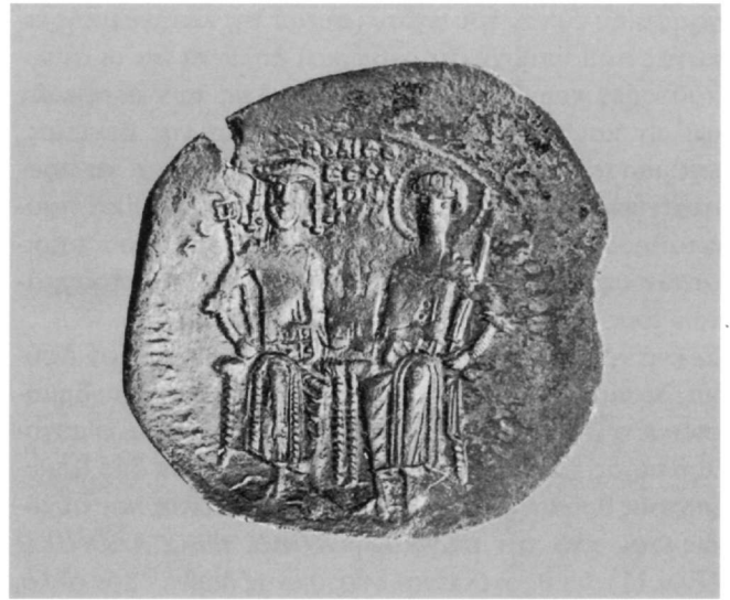
Εικ. 11. Ο δεσπότης της Θεσσαλονίκης Μανουήλ Άγγελος Κομνηνός Δούκας και ο άγιος Δημήτριος. Νόμισμα. 1230-1238.

Αντίθετα, οι δύο μικρασιάτες στρατιωτικοί άγιοι, Θεόδωρος και Γεώργιος, αναπτύσσουν σχέσεις με διάφορες γεωγραφικές περιοχές, αλλάζουν κοινωνική στάθμη (πάντοτε βέβαια μέσα στους κόλπους του στρατού) και μεταβάλλουν το χαρακτήρα τους, που μπορεί να κλιμακώνεται από το ύψιστο ιπποτικό ιδεώδες μέχρι το επίπεδο ταπεινών οικονομικών συναλλαγών. Νομίζω πως η πρωτεύϊκή τους προσωπικότητα ερμηνεύεται από το γεγονός ότι τόσο ο Γεώργιος όσο και ο Θεόδωρος κατάγονται από επαρχιακές πόλεις της Μικράς Ασίας και είναι αρχικά χαμηλής κοινωνικής προέλευσης, έστω και αν με την πάροδο του χρόνου τους διεκ-