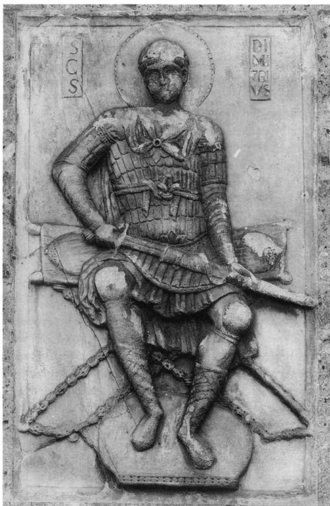
Εικ. 8. Άγιος Δημητρίος ένθρονος. Βυζαντινή μαρμαρίνη ανάγλυφη εικόνα. Άγιος Μάρκος Βενετίας. 12ος αι.

Δημήτριος εικονίζεται μια φορά πάνω στα τείχη να σκοτώνει τους πολιορκητές και μια δεύτερη φορά να επιδιορθώνει πεσμένα τμήματα του τείχους.