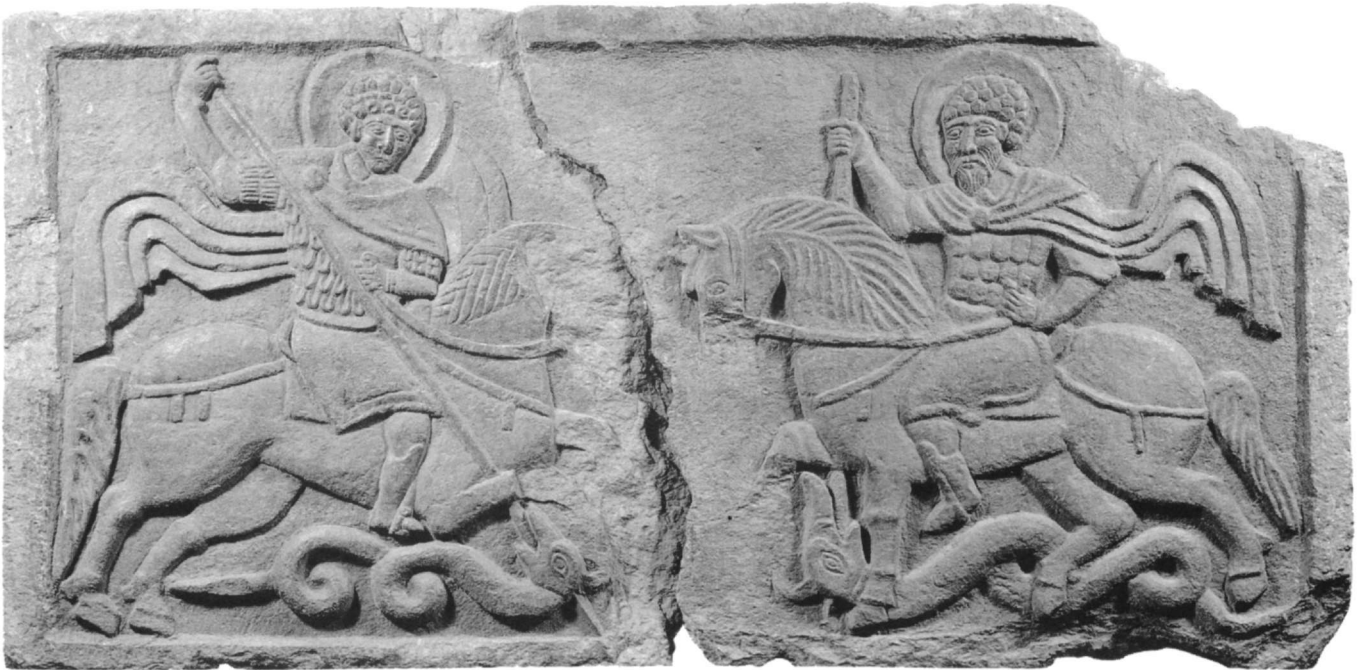
Εικ. 4. Άγιοι Θεόδωρος και Γεώργιος. Βυζαντινό ανάγλυφο. Μουσείο Ουκρανικής Τέχνης Κιέβου. 11ος αι.

Θεόδωρον πρὸ τῆς μαρτυρίας αὐτοῦ δι' ἐκείνης τῆς ὁδοῦ διέρχεσθαι· καὶ ἰδὼν αὐτὸν ὁ δράκων, συρρίζων ἔδραμεν ἐπ' αὐτόν. Ὁ δὲ γενναῖος στρατιώτης τοῦ Χριστοῦ κατασφραγισάμενος καὶ ρίψας τὴν λόγχην αὐτοῦ ἔπηξεν εἰς τὴν κεφαλὴν αὐτοῦ καὶ ἐφόνευσεν αὐτόν καὶ ἠλευθερώθη πᾶσα ἡ ὁδὸς ἀπὸ τῆς ἡμέρας ἐκείνης.