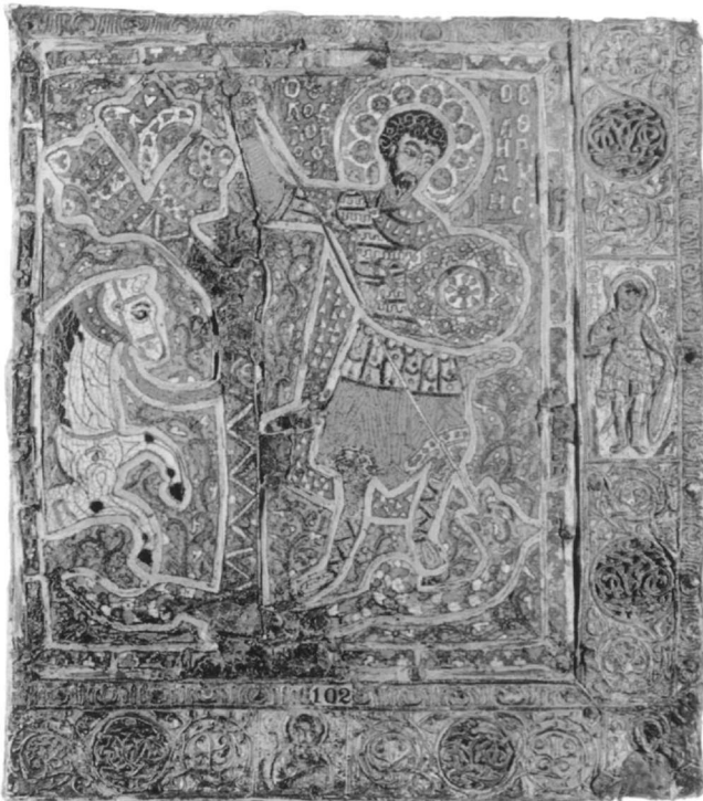
Εικ. 5. Άγιος Θεόδωρος ο Βαθυρριάκης. Βυζαντινή εικόνα από σμάλτο. Αγία Πετρούπολη, Μουσείο Ermitage. 12ος αι.

Η τρίτη παραλλαγή περιέχεται στο βατικανό κώδικα αριθ. 1993 που χρονολογείται στα τέλη του 11ου ή τις αρχές του 12ου αιώνα και αναφέρεται στον άγιο Θεόδωρο το Στρατηλάτη 16 . Εδώ, ο ήρωας-άγιος διαθέτει τα παρακάτω ατομικά χαρακτηριστικά. Είναι νέος, ωραίος, με ευγενή καταγωγή, μορφομένος και ανδρείος, αρετές που τον εξαιρούν μεταξύ των κοινών θνητών: Οὗτος ἦν τὰ μὲν ἐκ φύσεως τὴν ὥραν τε κάλλιστος, τὴν γλῶτταν δὲ ἄμαχος, τὸ γένος ἐπιφανέστατος, τὴν ἡλικίαν νεώτατος, καὶ τοῖς χερσὶν ἀήττητος· ἃ δὴ τὸ μὲν αὐτὸν ἢ ῥώμῃ τῶν λόγων ἐν τοῖς βασιλικαῖς σχολαστικαῖς ἐνέγραφε, τὸ δ' ἢ ἀνδρία τῶν ἔργων στρατηλάτην ἐν ταῖς μεγίσταις τῶν ῥωμαϊκῶν ἐδείκνυ δυνάμεισι καὶ τὰ μὲν ἐς ὄψιν τε καὶ τέχνην καὶ γένος καὶ ῥώμην τοιοῦτος, ψυχὴ δὲ σωφρονεστάτη καὶ παμφοροτάτη τὴν ἀρετὴν· ὑπὲρ ὧν δὴ καὶ τοῖς καλλίστοις τῶν πλεονεκτημάτων ὑπὲρ τῶν καλλίστων ἐφαίνετο χρώμενος. Ο δράκοντας με τη σειρά του περιγράφεται με πολλές φοβερές λεπτομέρειες, τεράστιος στο μέγεθος, παντο-