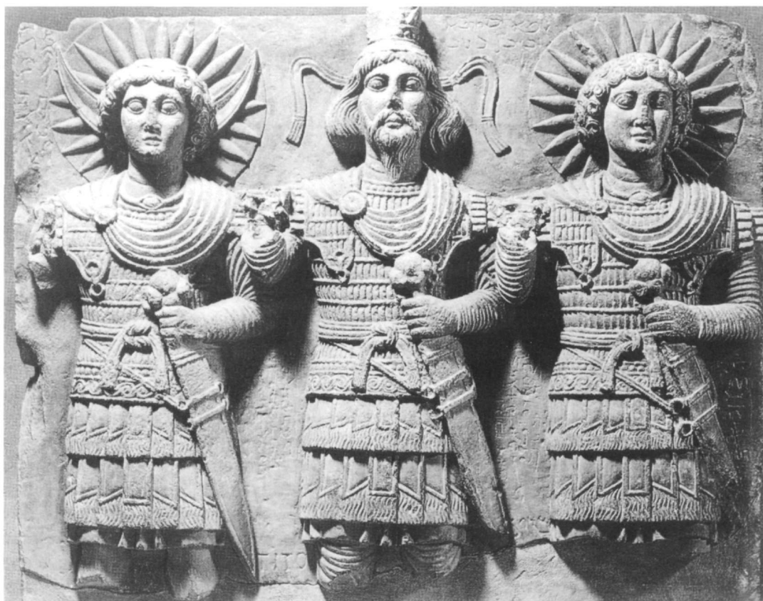
Εικ. 1. Ρωμαϊκό ανάγλυφο από την Παλμύρα. Παρίσι, Μουσείο Λούβρου. 1ος αι. μ.Χ.

νει το δράκοντα, εμφανίζεται συχνά, τόσο στη βυζαντινή λογοτεχνία όσο και στη βυζαντινή τέχνη. Παρόλο που ο πυρήνας της ιστορίας προέρχεται από παλαιότερο μυθικό υλικό 4 , στο Βυζάντιο το σχήμα δράσης γίνεται συγκεκριμένο με πρωταγωνιστή έναν άγιο από την τάξη των στρατιωτικών. Ένα χαρακτηριστικό δείγμα που εικονίζει μαζί τους δύο παλαιότερους δρακοντοκτόνους αγίους, τον Θεόδωρο και τον Γεώργιο, αποτελεί το ανάγλυφο στο Μουσείο Ουκρανικής Τέχνης του