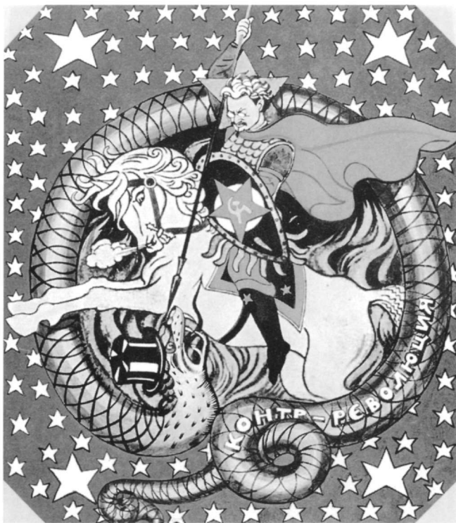
Εικ. 3. Λέων Τρότσκυ. Ρωσική αφίσα. 1918.

νεπάγεται και αλλαγή στην κοινωνική του θέση, φαίνεται καθαρά στις παραλλαγές του Βίου του, που περιλαμβάνουν το επεισόδιο της δρακοντοκτονίας και που θα εκτεθούν στη συνέχεια.