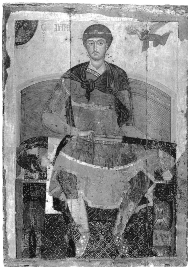
Εικ. 9. Άγιος Δημήτριος ένθρονος. Φορητή εικόνα. Μόσχα, Πινακοθήκη Tretiakov. Αρχές 13ου αι.

Θα πρέπει, εν κατακλείδι, να επισημάνουμε ότι ο άγιος Δημήτριος διατηρεί πάντοτε την αποκλειστική σχέση με την πόλη της Θεσσαλονίκης, την υψηλή του κοινωνική υπόσταση και το θετικό χαρακτήρα της προσωπικότητάς του. Από τη στιγμή που εμφανίζεται στην ιστορία είναι ήδη ριζωμένος σε ένα από τα μεγαλύτερα αστικά κέντρα της αυτοκρατορίας και φέρει το αξίωμα του υπά-