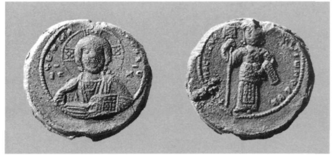
Εικ. 5. Μολυβδόβουλλο Κωνσταντίνου Γ' (1060-1067 μ.Χ.) (Αθήνα, Νομισματικό Μουσείο: Κωνσταντόπουλος, αριθ. 281).

Η παράσταση του έθρονου Χριστού, η οποία στα νομίσματα εμφανίζεται παράλληλα και εναλλάσσεται κανονικά με αυτή της προτομής ήδη από το 1025, καθιερώνεται στα μολυβδόβουλλα με τη βασιλεία του Νικη-