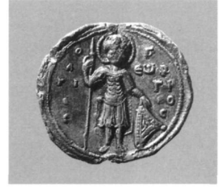
Εικ. 20. Μολυβδόβουλλο Αδριανού Κομνηνού πρωτοσεβάστου και μεγάλου δομέστικου πάσης Δύσεως (Αθήνα, Νομισματικό Μουσείο: Κωνσταντόπουλος, αριθ. 337).