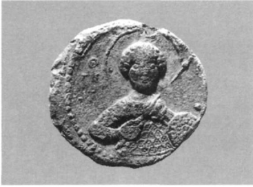
Εικ. 19. Μολυβδόβουλλο Ιωάννη Κομνηνού Κουροπαλάτη (Αθήνα, Νομισματικό Μουσείο: Κωνσταντόπουλος, αριθ. 386).

οικογένειας των Κομνηνών. Οι σφραγίδες του Ισαακίου Α' Κομνηνού, πριν γίνει αυτοκράτορας, όπως και οι σφραγίδες του αδελφού του Ιωάννη Κομνηνού, πατέρα του μετέπειτα αυτοκράτορα Αλεξίου Α', απεικονίζουν τον άγιο Γεώργιο 86 (Εικ. 19). Αντίθετα, ο Ισαάκιος, ο μεγαλύτερος αδελφός του μετέπειτα αυτοκράτορα Αλεξίου, διαφοροποιώντας τις σφραγίδες του από αυτές του ομώνυμου θείου του, προτίμησε την απεικόνιση του αγίου Θεοδώρου 87 . Η εικόνα του αγίου Γεωργίου, ολόσωμου αυτή τη φορά, επανεμφανίζεται στα μολυβδόβουλλα του Αδριανού Κομνηνού, νεότερου αδελφού του αυτοκράτορα Αλεξίου Α' Κομνηνού 88 (Εικ. 20), καθώς και άλλων μελών της οικογένειας (Εικ. 21).