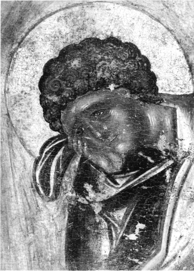
Εἰκ. 8. Σταύρωση. Λεπτομέρεια τοῦ ἁγίου Ἰωάννου τοῦ Θεολόγου.

περίζωμα, δεμένο χαμηλά με κόμπο, με δύο κόκκινες κάθετες ταινίες και με μίμηση αραβικής επιγραφής στην παρυφή. Οἱ πτυχές εἶναι καστανές, τό ἴδιο και τό περίγραμμα. Ἐφθονο αἷμα τρέχει ἀπό τήν πλευρά, τά χέρια και τά πόδια, και στάζει ἀπό τούς πήχεις.