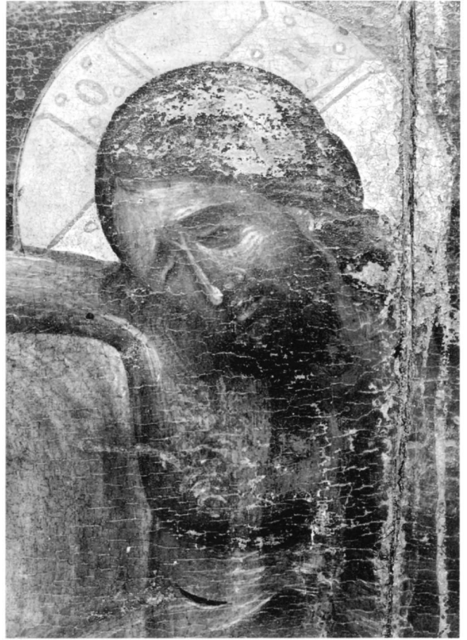
Εικ. 7. Σταύρωση. Λεπτομέρεια τοῦ Χριστοῦ.

εὐλογεῖ μέ τά δύο χέρια. Ἀριστερά καί δεξιά δύο ἄγγελοι σεβίζουν. Στά πλάγια οἱ ἀπόστολοι, σέ προτομή, κρατοῦν κλειστά βιβλία ἢ εἰλητάρια. Ἀριστερά εἰκονίζονται οἱ ἀπόστολοι Πέτρος, Ματθαῖος, Μάρκος, Ἀνδρέας, Ἰάκωβος καί Φίλιππος, δεξιά οἱ Παῦλος, Ἰωάννης, Λουκάς, Σίμων, Βαρθολομαῖος καί ἓνας ἀγένειος πού εἶναι προφανῶς ὁ Θωμᾶς.