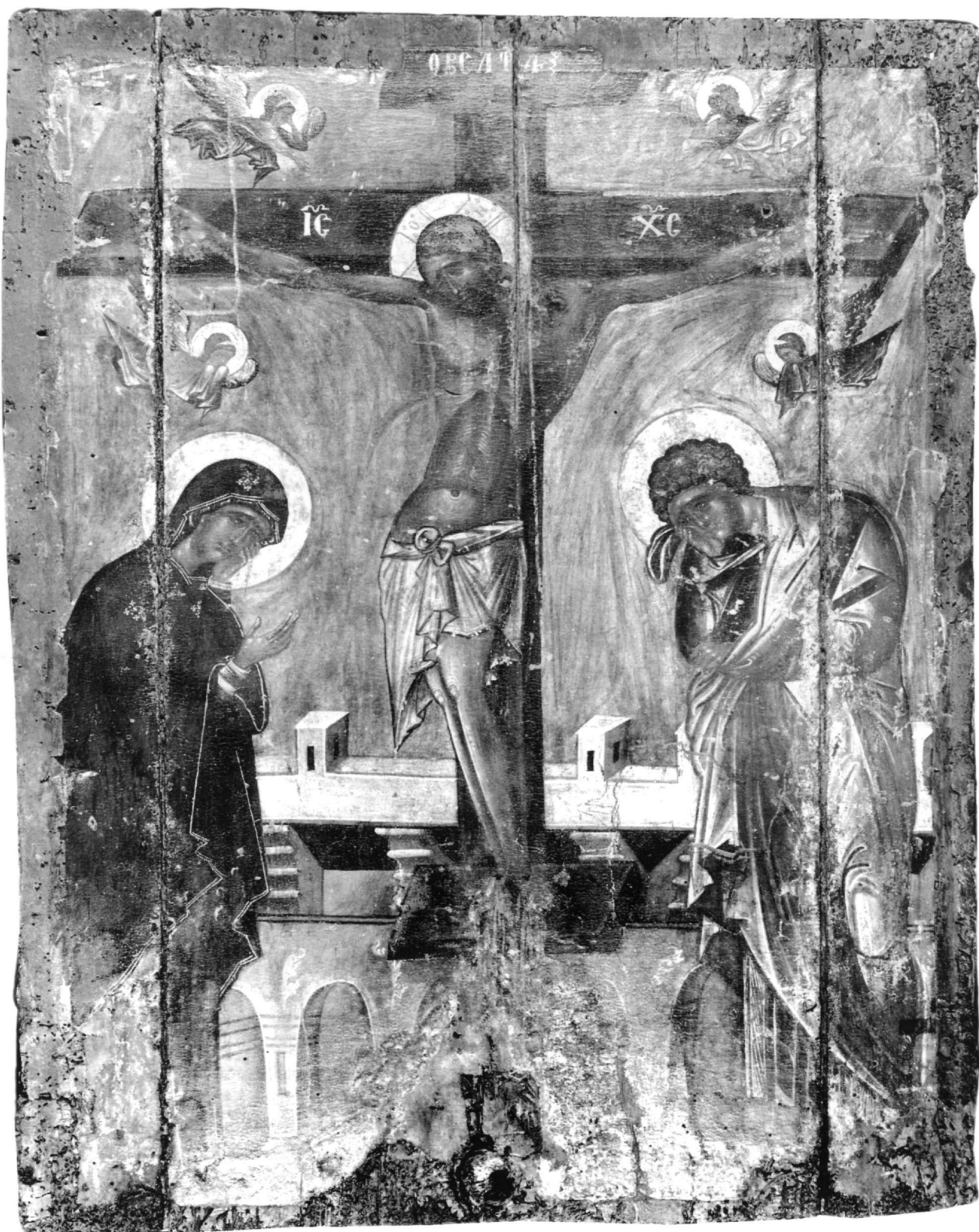
5. Η Σταύρωση.