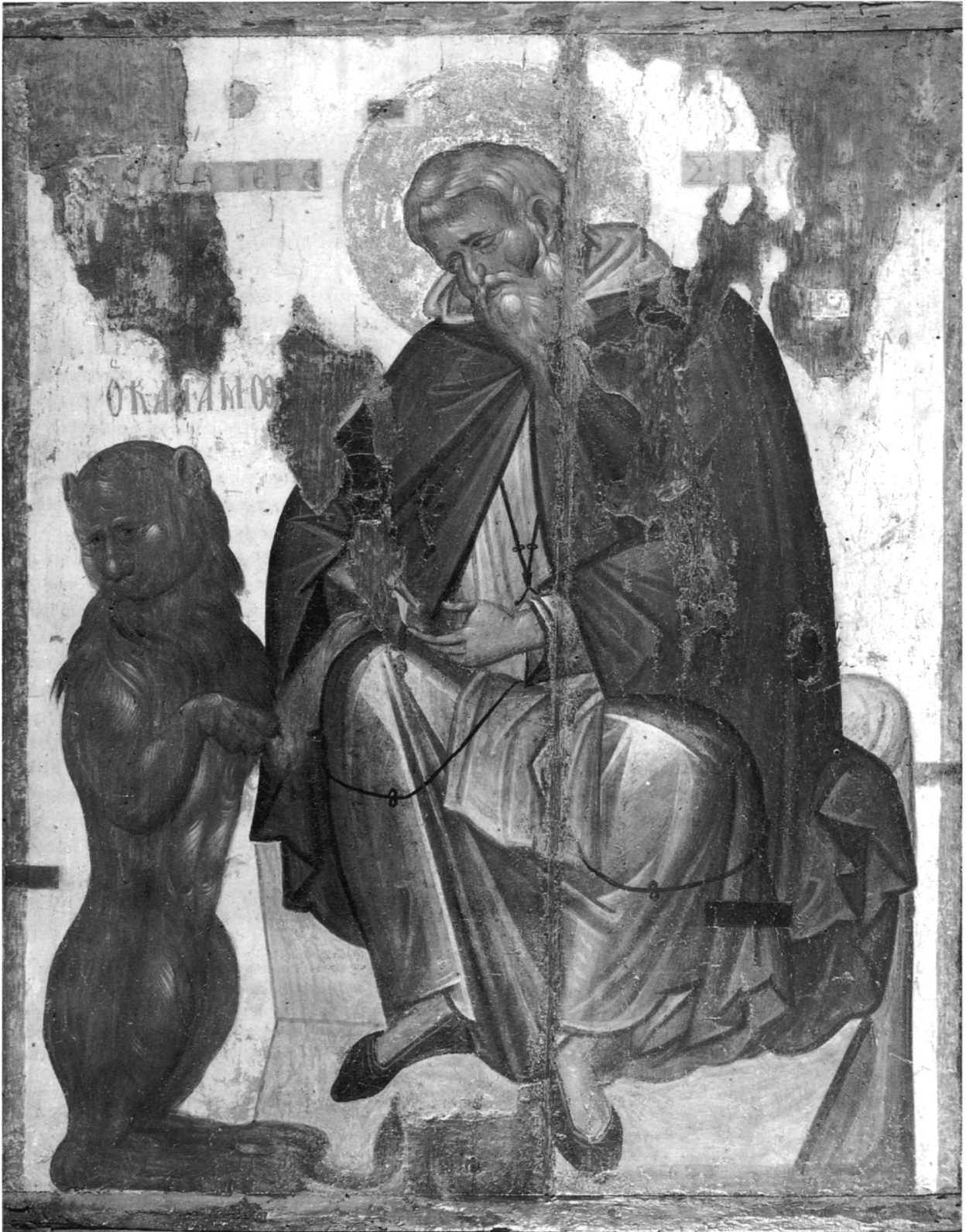
Εικ. 2. Ὁ ἅγιος Γερόσιμος καί τό λιοντάρι.