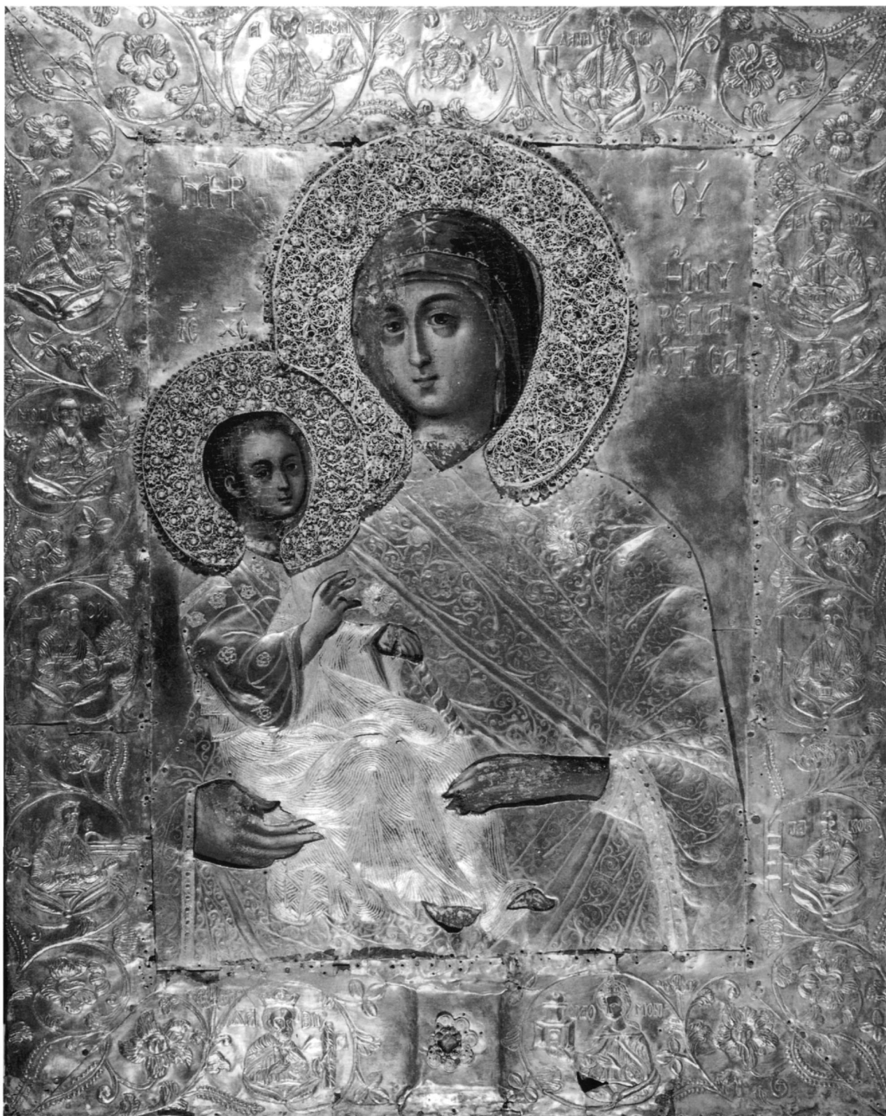
Εἰκ. 1. Θεοτόκος Δεξιοκρατοῦσα ἢ Μυρελαιώτισσα.