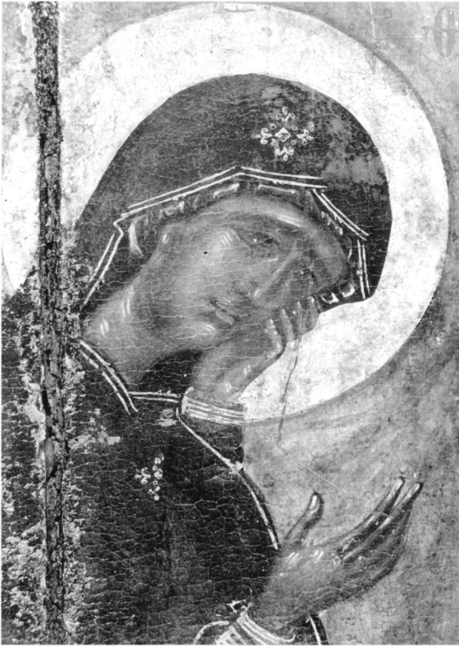
Εικ. 6. Σταύρωση. Λεπτομέρεια της Θεοτόκου.

κάτω τμήματος του χιτώνας του επαναλαμβάνει αυτήν του υποκειμένου στρώματος, ή αρχική παράσταση θά μπορούσε να χρονολογηθεί στον 12ο ή στον 13ο αιώνα. Ο ανοικτοπράσινος κάμπος καλύπτει τον αρχικό, πού είναι χρυσός. Η Παναγία φορεί καλύπτρα κάτω από το μαφόριο και στέφεται από χαμηλό φράγκικο στέμμα. Στην χρυσή παρυφή του κόκκινου μαφορίου της Παναγίας είναι γραμμένες οι ακόλουθες επιγραφές: Χαῖρε ὅτι ὑπάρχεις βασιλέως καθέδρα. Χαῖρε... Χαῖρε ὅτι βασιτάξεις τόν βασιτάζοντα πάντα. Χαῖρε... Χαῖρε σκυνή του Θεοῦ Λόγον. (Χαῖ)ρε ἡ κλεις της παρθενίας. (Χαῖ)ρε ἀστέρος ἀδύτου Μήτηρ. Τό χρυσό βάθος ἔχει διατηρηθεῖ στό πλαίσιο. Ἐπάνω ὁ ἔνθρονος Χριστός