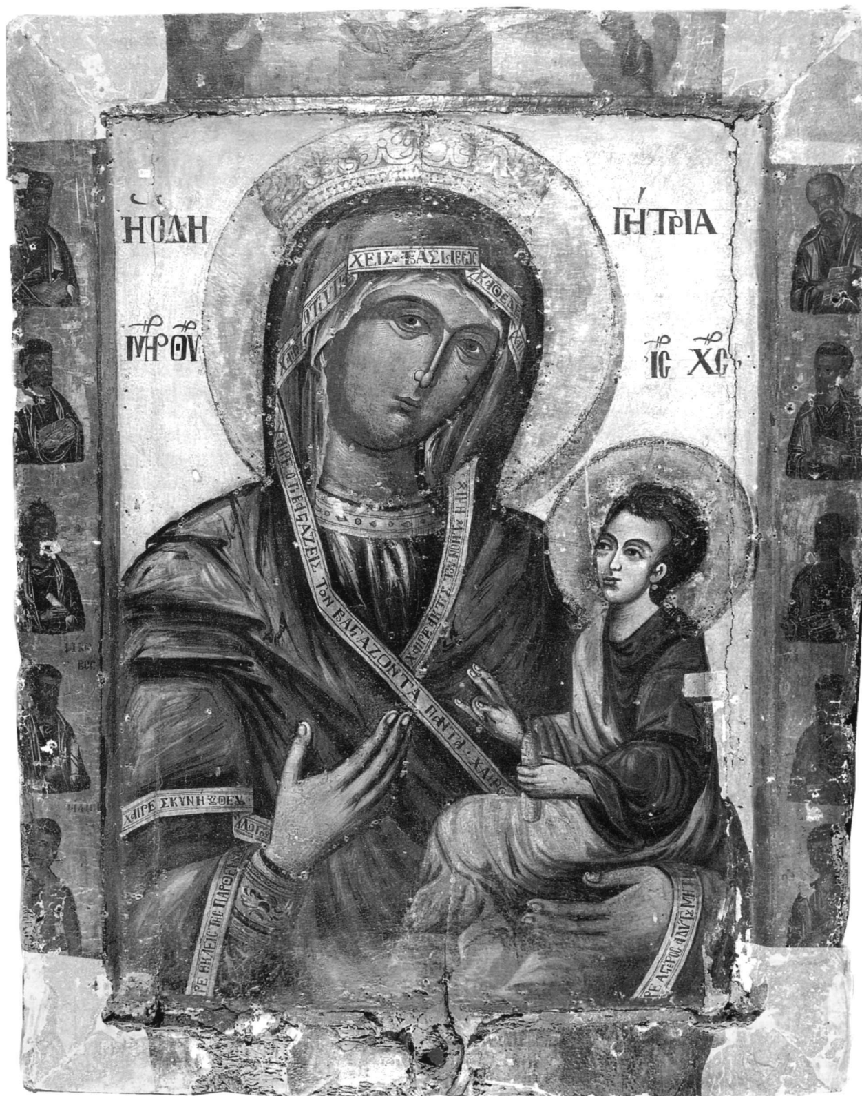
Εἰκ. 4. Ἡ Θεοτόκος Ὁδηγήτρια.