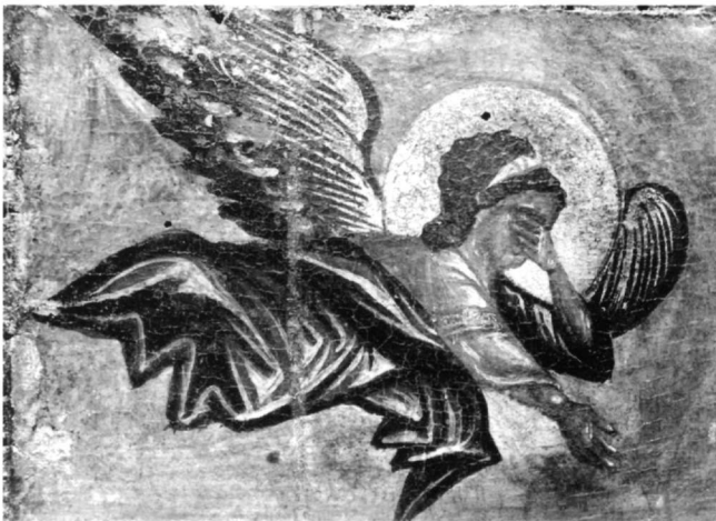
Εικ. 9. Σταύρωση. Ὁ ἐπάνω ἀριστερά ἄγγελος.

ὕψωνουν τό δεξι χέρι στό πρόσωπο. Ἡ χειρονομία αὐτή, πού ἀπαντᾷ καί σέ ἀρχαία ἐπιτύμβια 36 , χρησιμοποιεῖται συχνά στό Βυζάντιο γιά τήν δήλωση λύπης σέ σκηνές ὅπως ἡ Σταύρωση, ἡ Ἐγερση τοῦ Λαζάρου, ἡ Ἀνάληψη, ἀλλά καί ἡ Ὑπαπαντή καί τό Δεῖπνον εἰς Ἐμμαούς 37 . Ἡ παραλλαγή, στήν ὁποία ἡ Θεοτόκος σκύβει τό κεφάλι, σπανιότερη ἀπό ἐκείνη ὅπου ἀτενίζει τόν Ἐσταυρωμένο, μαρτυρεῖται πολύ ἐνωρίς, π.χ. σέ εἰκόνα τῆς Μονῆς Σινᾶ τήν ὁποία ὁ Weitzmann τοποθετεῖ στόν 7ο ἢ 8ο αἰώνα 38 . Ὁ Ἰωάννης ἔχει τετράγωνους ὤμους καί σκύβει ἔντονα τό κεφάλι σέ μερικές