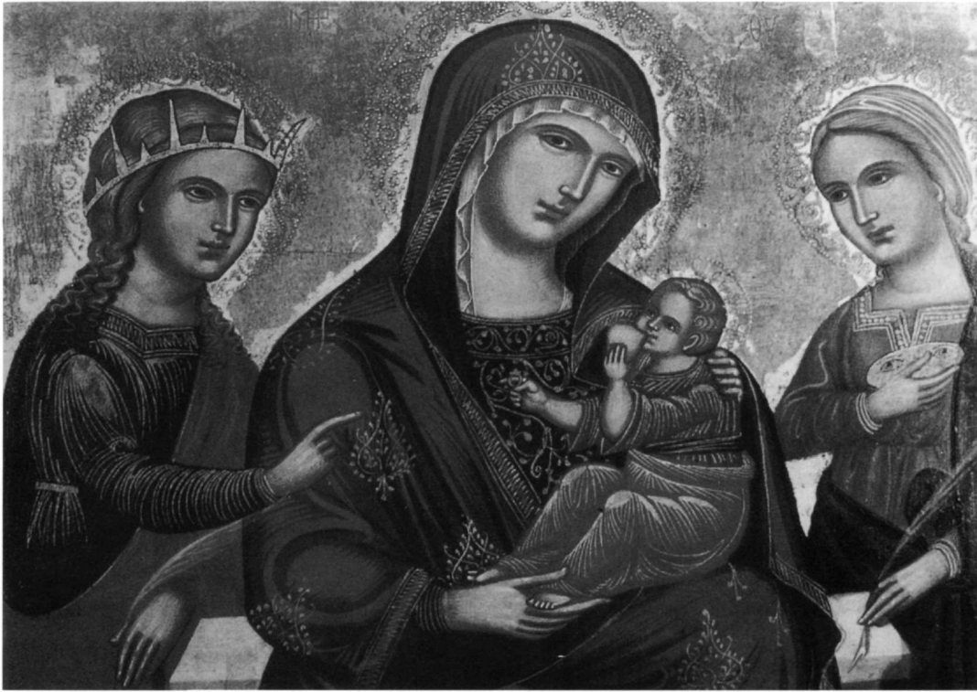
Εἰκ. 2. Ραβέννα, Museo Nazionale. Εἰκόνα Ἱερῆς Συνομιλίας μετὰ τὴν μνηστεία τῆς ἁγίας Αἰκατερίνης.

πρέπει νὰ ξένισε ὑπερβολικὰ τοὺς κατοίκους τῶν Δραμεσιῶν, δεδομένης ἄλλωστε τῆς λατρείας τῆς ἁγίας στὴν Ἠπειρο (Εἰκ. 3) καὶ τῶν σχέσεων μετὰ τὸ Σινᾶ 36 . Ἡ μορφή τῆς ἐπίσης ἐστεμμένης ἁγίας στὴ δεξιά, πᾶριση πλευρά, ἐπίσης δὲν θὰ προκαλοῦσε ἰδιαίτερες δυσκολίες ταύτισης: ὅπως στὴ Δύση 37 , ἔτσι καὶ στὴν Ἀνατολή ἢ – κατὰ τὴν παράδοση καὶ τὴν εἰκονογραφία – βα-