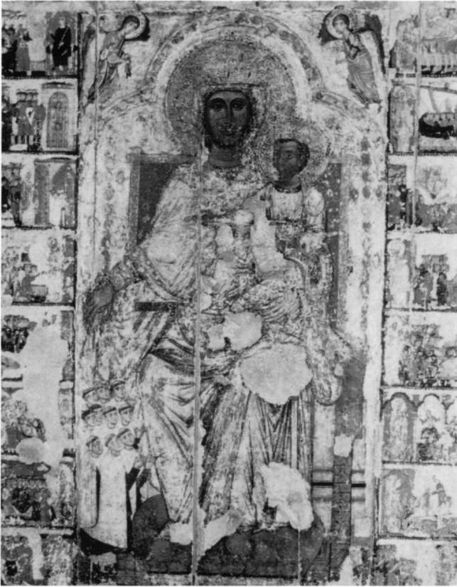
Εἰκ. 6. Κύπρος, Λευκωσία. Εἰκόνα ἔνθρονης, ἑστεμμένης Βρεφοκρατούσας με σκηνές τοῦ βίου της καὶ δεόμενους Καρμηλίτες μοναχοῦς.

Mater Misericordiae (ἡ τελευταία ἐπέχει θέση Andachtsbild): Chr. Belting-Ihm, Sub matris tutela. Untersuchungen zur Vorgeschichte der Schutzmantelmadonna , Χαϊδελβέργη 1976· λ. Schutzmantelschaft, Schiller, IChrK , 4, στ. 128 κ.έ. (J. Seibert)· L. Kretzenbacher, Schutz- und Bittgebärder der Gottesmutter , Μόναχο 1981· H. Belting, Bild und sein Publikum im Mittelalter , Βερολίνο 1981, σ. 43, 51· ὁ ἴδιος, Bild und Kult κτλ., Μόναχο 1993 2 , σ. 398 κ.έ.· Schiller, IChrK , ὅ.π., σ. 195 κ.έ.· M. Gebarowicz, Mater Misericordiae Pokrow. Mater Misericordiae in the Art and Legend of East-Central Europe (πολωνικά με ἀγγλ. περίληψη), Wrocław 1986· λ. Schutzmantel, Lex. Mittel. , 7, στ. 1597 κ.έ. (G.M. Lerchner)· λ. Maria, RbK 6, στ. 48 κ.έ. (G. M. Lerchner). Παράδειγμα μεταβυζαντινῶ, προϊόν τῆς Κρητικῆς Σχολῆς, προσφέρει ἡ Ν. Χατζηδάκη, Εἰκόνας Κρητικῆς Σχολῆς, 15ος-16ος αἰώνας , Κατάλογος ἐκθέσεως, Μουσεῖο Μπενάκη, Ἀθήνα 1983, ἀριθ. 41, ὅπου καὶ μνεῖα ἄλλων δειγμάτων.