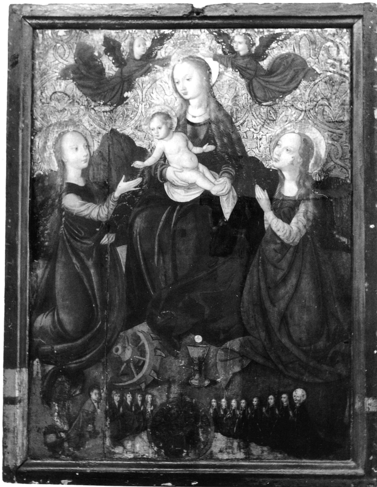
Εἰκ. 1. Δραμεσιοὶ Ἰωαννίνων, Μονὴ Γενεσίου τῆς Θεοτόκου. Εἰκόνα «Παναγίας Λαμποβίτισσας».