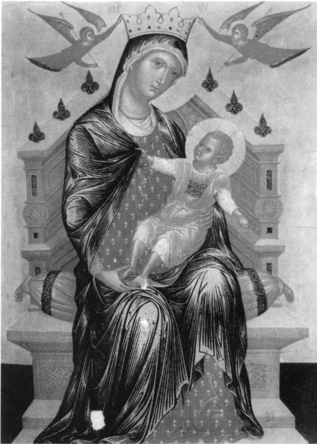
Εἰκ. 4. Βενετία, Museo Correr. Εἰκόνα στεφομένης, ἔνθρονης Βρεφοκρατούσας.

41. Ὁ λόγος ἐδῶ γιὰ τὴν αὐτόνομη παράσταση τῆς στεφομένης Θεοτόκου καὶ ὄχι στὰ πλαίσια ἄλλων σκηνῶν (λ.χ. Κοίμησης/ Μετάστασης, Ἀκαθίστου Ὕμνου, Ρίζας Ἰεσοαὶ κ.ἄ.).