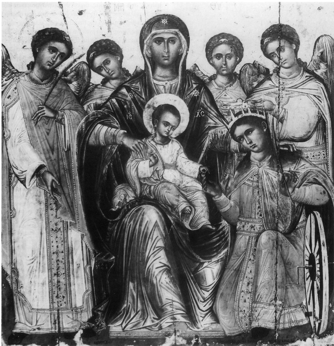
Εἰκ. 3. Ἄρτα. Εἰκόνα μνηστείας τῆς ἁγίας Αἰκατερίνης, ἔργο Γεωργίου Κλόντζα.

Majestas Mariae in Late Greek and Russian Icons, στό M. van Rijn (ἐπιμ.), Icons and East Christian Works , Amsterdam 1980, σ. 7 κ.έ., ἰδι- αίτερα 14 κ.έ.· Παπαδάκη, ὀ.π. (ὑπόσημ. 35), σ. 154· Ὑπουργεῖο Πολιτισμοῦ καί Ἱερά Μητρόπολις Κερκύρας, Παξῶν καί Διαπο- ντίων Νήσων (ἐκδ.), Ὁ περίπλους τῶν εἰκόνων. Κέρκυρα, Κατά-