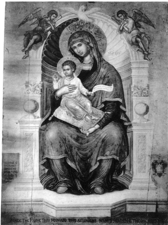
Εἰκ. 5. Συλλογή Λοβέρδου, Βυζαντινό Μουσείο Ἀθηνῶν. Εἰκόνα Παναγίας Λαμποβίτισσας, ἔργο Ἐμμανουήλ Τζάνε.

Τό κάτω μέρος τῆς εἰκόνας-πίνακα, μέ τήν προοπτική τοποθέτηση τῶν προσευχομένων προσώπων, δημιουργεῖ μεγαλύτερες ἀντιστάσεις ἔνταξης. Ροῦχα, στάση καί τοποθέτηση στόν χῶρο δέν συμβαδίζουν μέ τά καθιερωμένα στήν ὀρθόδοξη εἰκονογραφία, πέρα ἀπό τήν – ἀδιάγνωστη σήμερα – σχέση τους μέ τό κατεστραμμένο ἀντικείμενο ἀνάμεσα στά δύο ἡμιχόρια. Ἐν πάσῃ περιπτώσει ἡ πλησιέστερη, κατά τή γνώμη μου, συγγένεια θά ἦταν μέ τίς σπανιότατες βυζαντινές – κυρίως σέ ἔργα τῆς περιφέρειας κάτω ἀπό δυτική ἐπίδραση, ὅπως στήν Κύπρο (Εἰκ. 6) 49 – παραστάσεις τῆς Θεοτόκου-Σκέπτης ἢ τίς κάπως συχνότερες μεταβυζαντινές κρητικές παραστάσεις τοῦ ἴδιου τύπου 50 . Ὡστόσο, ἡ ἀπουσία ἐδῶ τοῦ χαρακτηριστικοῦ ἀπλωμένου μανδύα τῆς Θεοτόκου, πού καλύπτει προστατευτικά τοὺς πιστούς, καί ἡ σπανιότητα τοῦ τύπου στή μεταβυζαντινή ζωγραφική μετατρέπει τήν εἰκασία σέ ὑπόθεση ἐργασίας εὐλογημέν, ἀναπόδεικτη δέ. Κατά συνέπεια ὁ ἀκριβής μηχανισμός πρόσληψης δέν εἶναι ἐδῶ ὁρατός.