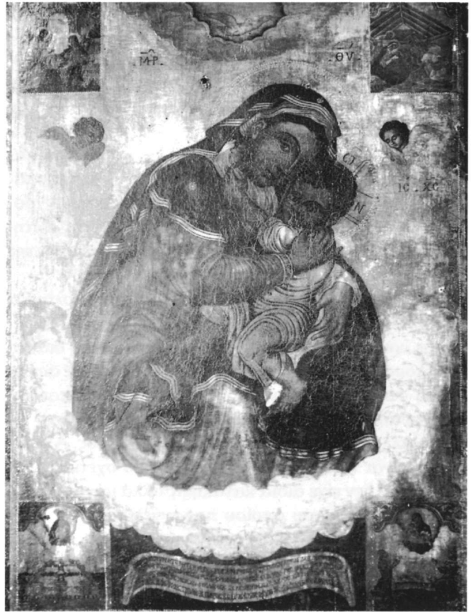
Εικ. 6. Βυζαντινό Μουσείο, Φωτογραφικό Αρχείο Λαμπάκη. Παναγία Γλυκοφιλούσα και τέσσερις σκηνές (αριθ. 347).

Στα Επτάνησα και ιδιαίτερα στην Κέρκυρα σώζονται αρκετές αναθηματικές εικόνες, που έγιναν με αφορμή