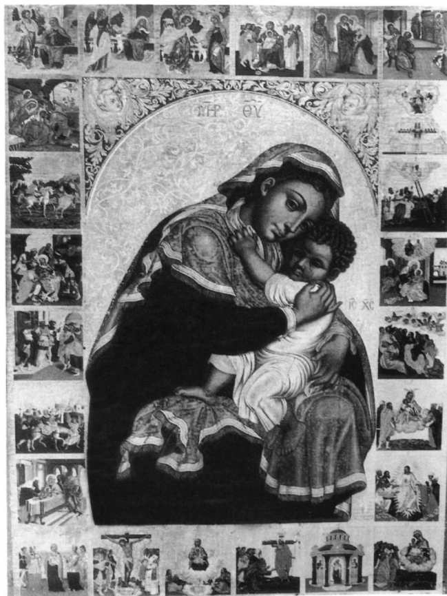
Εικ. 4. Κεφαλονιά. Μονή Σισίων. Στέφανου Τζανκαρόλα: Παναγία η Γλυκοφιλούσα και σκηνές του Ακαθίστου Ύμνου (1700).

Από τις εικόνες που εντοπίζονται στην Κεφαλονιά ιδιαίτερο ενδιαφέρον παρουσιάζει η εικόνα της Σάμης, που αποτελεί και ένα από τα σημαντικότερα κει-