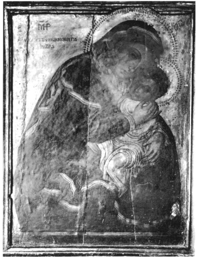
Εικ. 7. Βυζαντινό Μουσείο, Φωτογραφικό Αρχείο Λαμπάκη. Παναγία Γλυκοφιλούσα (αριθ. 350).

Θα προσπαθήσουμε, τέλος, να ανιχνεύσουμε τον τόπο παραγωγής και ίσως παραμονής της εικόνας του Βυζαντινού Μουσείου έως το 1992. Σύμφωνα με την προφορική μαρτυρία του προηγούμενου κατόχου, κ. Ψημενάτου, η εικόνα αποτελούσε οικογενειακό κειμήλιο της μητέρας του, το γένος Βικάτου, που καταγόταν από το Κάστρο του Αγίου Γεωργίου. Το Κάστρο ήταν η παλαιά πρωτεύουσα της Κεφαλονιάς έως το 1757, οπότε μεταφέρθηκε στο Αργοστόλι, και επομένως ήταν το μεγαλύτερο οικονομικό και πνευματικό κέντρο του νησιού 30 . Εκεί λειτουργούσε, ήδη από τα τέλη του 16ου αιώνα, το μοναδικό δημόσιο σχολείο της Κεφαλονιάς. Στις αρχές του 18ου αιώνα, και συγκεκριμένα κατά τα έτη 1703, 1705, 1708, 1712-1714, δάσκαλος του σχολείου