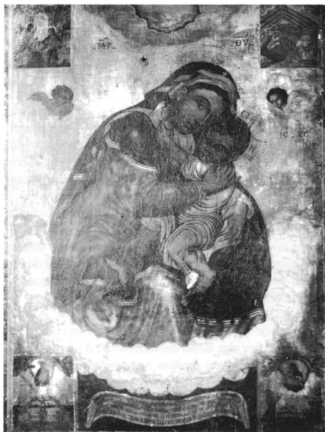
Εικ. 6. Παναγία Γλυκοφιλούσα και τέσσερις σκηνές (αριθ. 347).

Στα Επτάνησα και ιδιαίτερα στην Κέρκυρα σώζονται αρκετές αναθηματικές εικόνες, που έγιναν με αφορμή