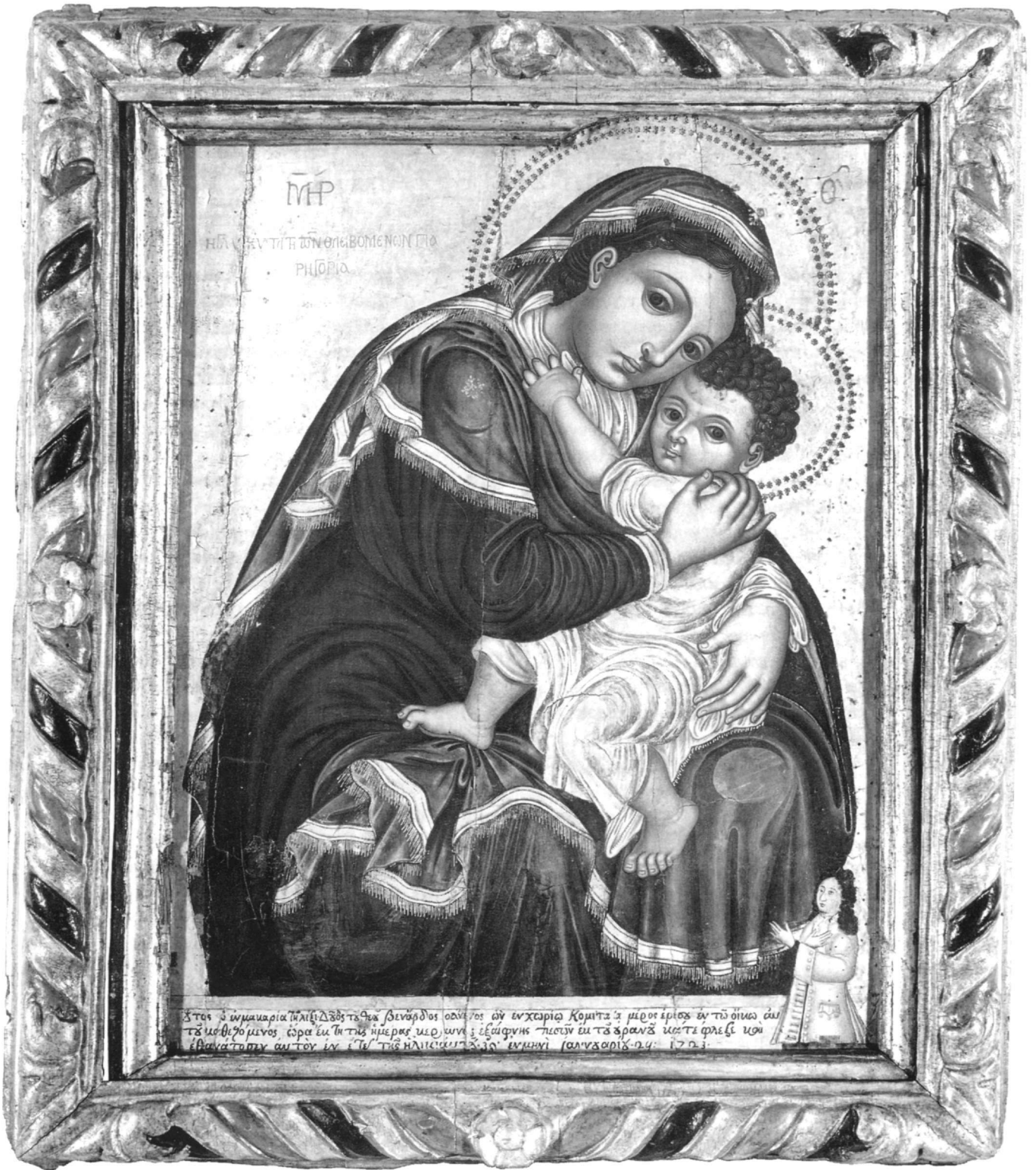
Εικ. 1. Βυζαντινό Μουσείο, Παναγία Γλυκοφιλούσα (1723).