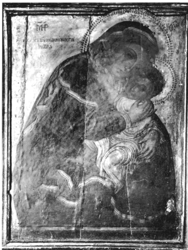
Εικ. 7. Βυζαντινό Μουσείο, Φωτογραφικό Αρχείο Λαμπάκη. Παναγία Γλυκοφιλούσα (αριθ. 350).

Θα προσπαθήσουμε, τέλος, να ανιχνεύσουμε τον τόπο παραγωγής και ίσως παραμονής της εικόνας του Βυζαντινού Μουσείου έως το 1992. Σύμφωνα με την προφορική μαρτυρία του προηγούμενου κατόχου, κ. Ψημενάτου, η εικόνα αποτελούσε οικογενειακό κειμήλιο της μητέρας του, το γένος Βικάτου, που καταγόταν από το Κάστρο του Αγίου Γεωργίου. Το Κάστρο ήταν η παλαιά πρωτεύουσα της Κεφαλονιάς έως το 1757, οπότε μεταφέρθηκε στο Αργοστόλι, και επομένως ήταν το μεγαλύτερο οικονομικό και πνευματικό κέντρο του νησιού 30 . Εκεί λειτουργούσε, ήδη από τα τέλη του 16ου αιώνα, το μοναδικό δημόσιο σχολείο της Κεφαλονιάς. Στις αρχές του 18ου αιώνα, και συγκεκριμένα κατά τα έτη 1703, 1705, 1708, 1712-1714, δάσκαλος του σχολείου