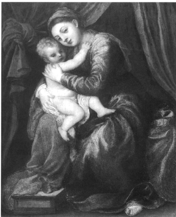
Εικ. 5. Μαδρίτη. Συλλογή Thyssen-Bornemisza. Τισιανός: Παναγία βρεφοκρατούσα (περ. 1545).

τη μικρογράμματη επιγραφή: ραφαήλ ιερομόναχος άννινος και ηγούμενος ικετεύει 1736. Τη χρονιά αυτή ο Ραφαήλ Άνινος, γόνος της ίδιας οικογενείας με τον Βερνάρδο, ήταν ηγούμενος της, εγκαταλελειμμένης σήμερα, μονής των Αγίων Φανέντων, όπου και αφιέρωσε την εικόνα 17 . Η μονή, που βρίσκεται ΝΑ. της Σάμης, ήταν σημαντική εστία πνευματικής, θεολογικής και καλλιτεχνικής δραστηριότητας, με ακτινοβολία στην ευρύτερη περιοχή 18 .