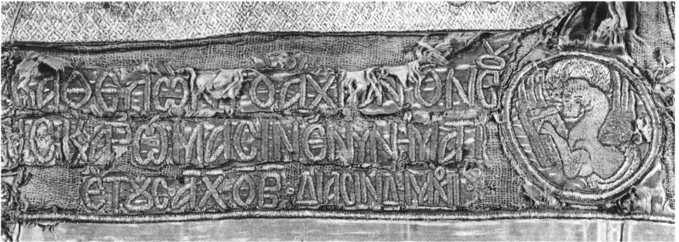
Εικ. 2. Λεπτομέρεια του επιταφίου με τμήμα επιγραφής.

χείο του τελετουργικού της Μεγάλης Παρασκευής 4 και αποκτά επιπλέον την ονομασία επιτάφιος, όπως πρώτος αναφέρει ο Συμεών Θεσσαλονίκης 5 . Η προέλευση και χρήση του επιταφίου είναι στοιχεία καθοριστικά και για τον εικονογραφικό του διάκοσμο. Η εικονογραφία του σχετίζεται αφ' ενός, όπως στον αέρα 6 , με την παράσταση του ευχαριστιακού συμβόλου του αμνού, που εξαίρει το λειτουργικό περιεχόμενο της σταυρικής θυσίας, και αφ' ετέρου, το κεντρικό αυτό θέμα μπορεί να εμπλουτίζεται με στοιχεία ιστορικά 7 , εικόνες δραματικές, εμπνευσμένες από την ψαλμωδία του Επιτάφιου Θρήνου. Έτσι, στους επιταφίους, η σκηνή του Θρήνου 8 διατηρεί συνήθως τους βασικούς χαρακτήρες διαμό-