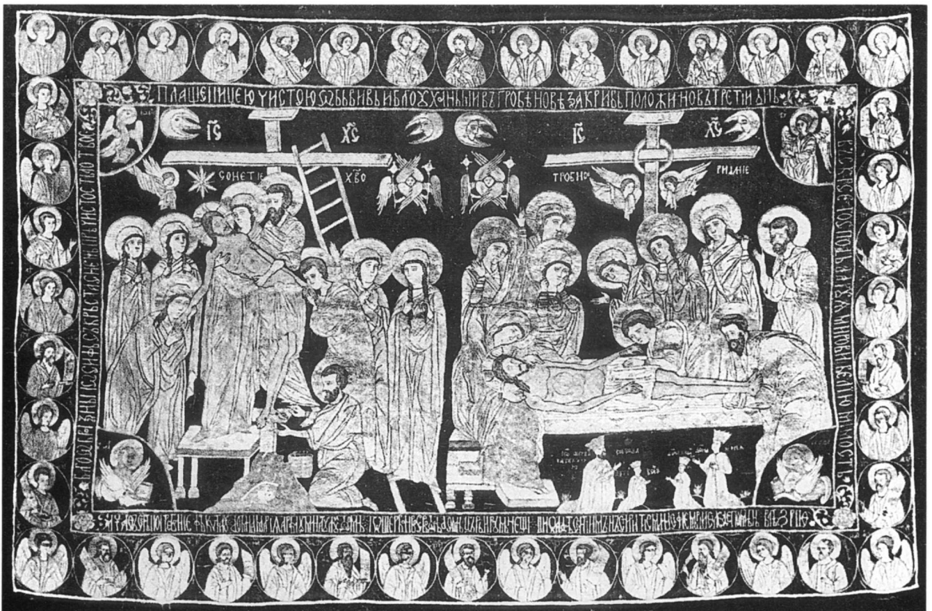
Εικ. 5. Επιτάφιος του πρίγκιπα Σέριμπαν Καντακουζηνού (1681). Μουσείο Τέχνης, Βουκουρέστι.

υπάρχει συνέπεια στην τήρηση των αναλογιών. Όλα τα πρόσωπα δεν αποδίδονται στην ίδια κλίμακα. Όσα πρόσωπα έχουν συμβολική-λειτουργική υπόσταση, όπως ο Χριστός-Αμνός και οι δορυφορούντες άγγελοι, αποδίδονται στην πιο μεγάλη κλίμακα. Στις αφηγηματικές σκηνές το μέγεθος των προσώπων είναι ανάλογο με τη σπουδαιότητά τους στην αφήγηση ή το βαθμό αγιότητάς τους 28 . Στο Θρήνο η Παναγία, η Μαγδαληνή, ο Ιωάννης και ο Ιωσήφ απεικονίζονται μεγαλύτεροι από τις μυροφόρους. Στην Αποκαθήλωση ο Ιωσήφ είναι μεγαλύτερος από τα υπόλοιπα πρόσωπα. Η διαφορά των μεγεθών, η διάταξη των προσώπων και των