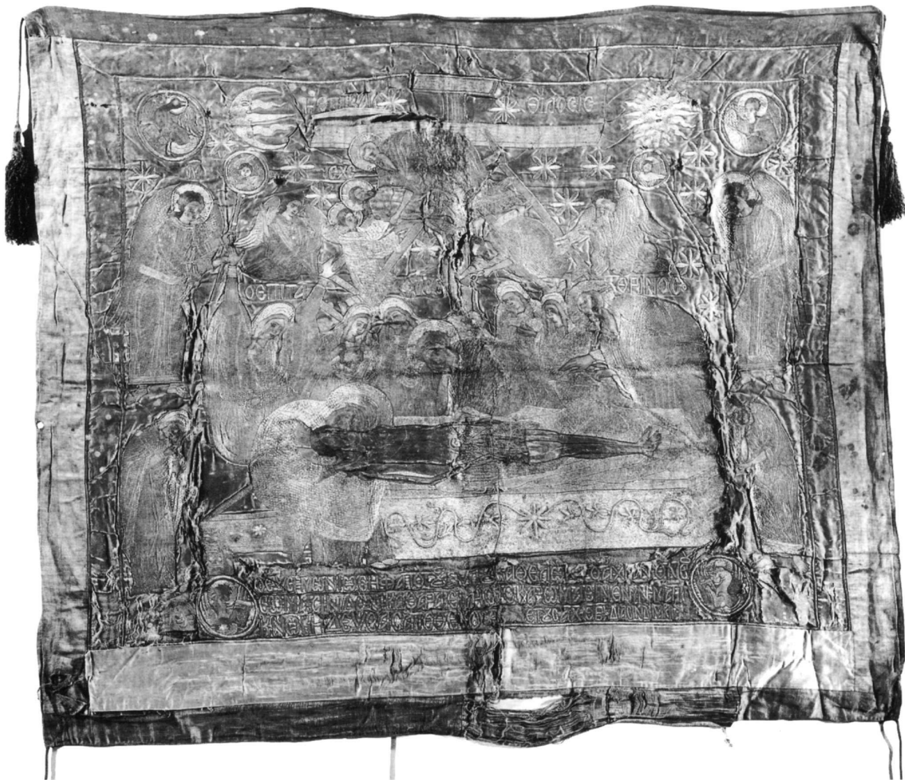
Εικ. 1. Επιτάφιος (1672). Βυζαντινό Μουσείο, Αθήνα, αριθ. BM 7047.

αποδίδεται με τη δύσκολη «βερέρικη» βελονιά. Άλλοι φωτοστέφανοι και ως επί το πλείστον οι φτερούγες γεμίζουν με «καμάρες». Στα πλάγια της σαρκοφάγου διακρίνονται περίτεχνοι ρόμβοι, τα «κοτσάκια», ενώ η κυματοειδής ταινία με τα άστρα αποδίδεται έξεργη με