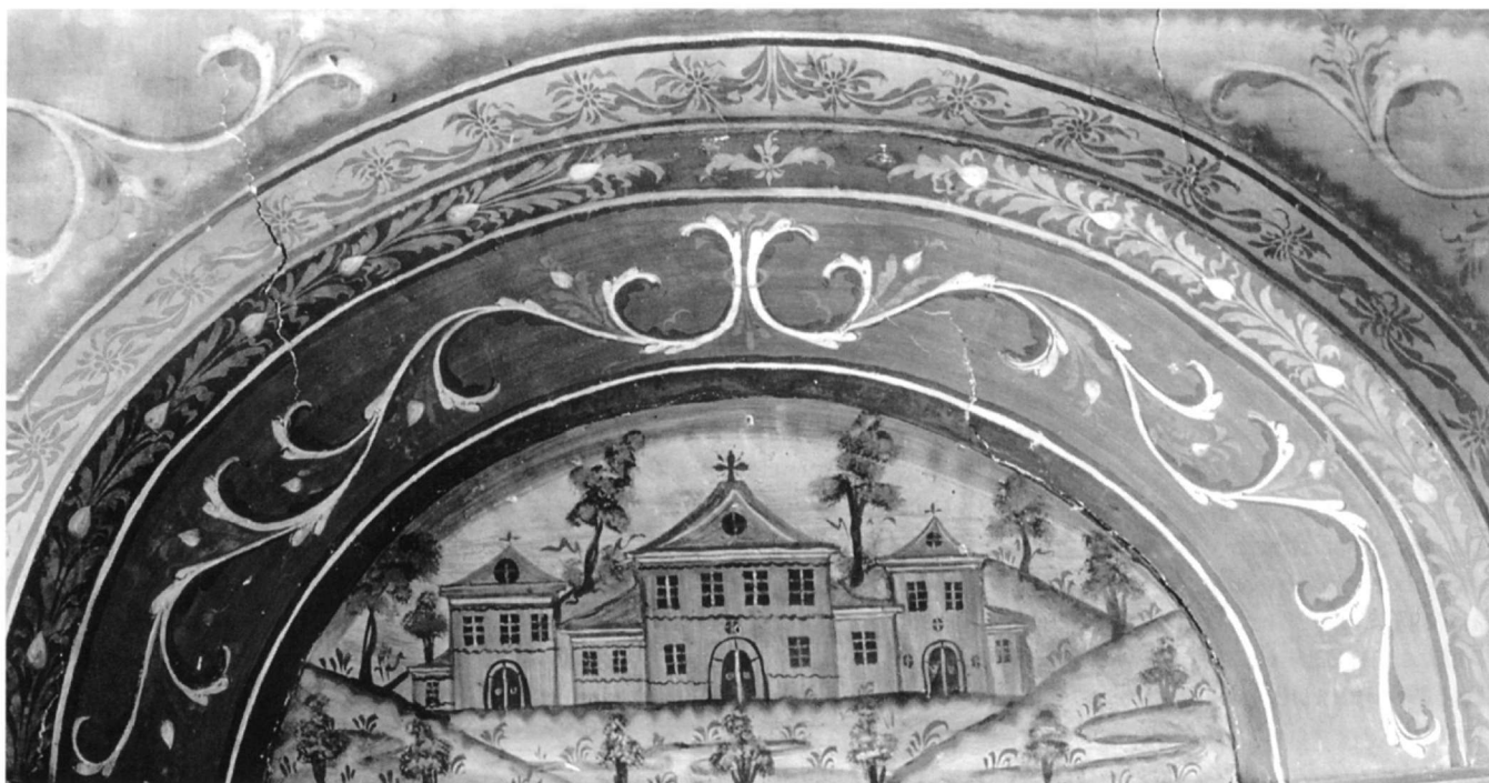
Εικ. 5. Καπέσοβο. Λαϊκή διακόσμηση εσωτερικού οικίας (λεπτομέρεια).

καθαρά θρησκευτικούς λόγους, αλλά περισσότερο αποτελεί δείγμα της πνευματικής συγκρότησης των φορέων αυτών, μεσ' απ' την οποία έβλεπαν την εθνική απελευθέρωση και την πορεία του ελληνισμού» 35 . Εξάλλου, ελάχιστη είναι η επαφή με την επίσημη Εκκλησία των Ιωαννίνων, αφού η χορηγία στέλνεται απευθείας στους επιτρόπους, οι οποίοι και τη διαχειρίζονται.