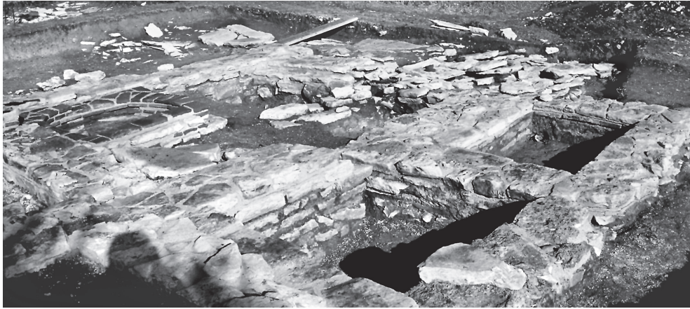
Εικ. 3. Άποψη του frigidarium από νοτιοανατολικά.