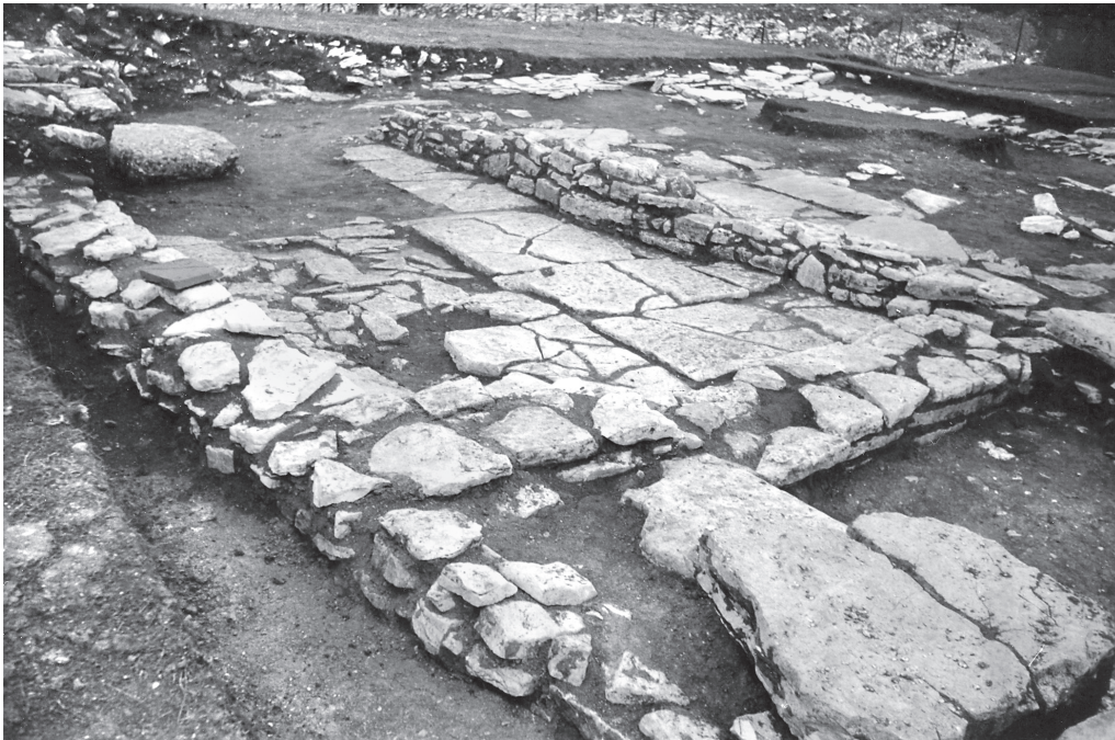
Εικ. 8. Αποψη του νότιου τμήματος του υπαίθριου χώρου (αρχείο 8ης Ε.Β.Α.).

ακολουθήθηκε αυτό το απλούστερο και ιδιαίτερα δια- δεδομένο σύστημα θέρμανσης των τοίχων 22 .