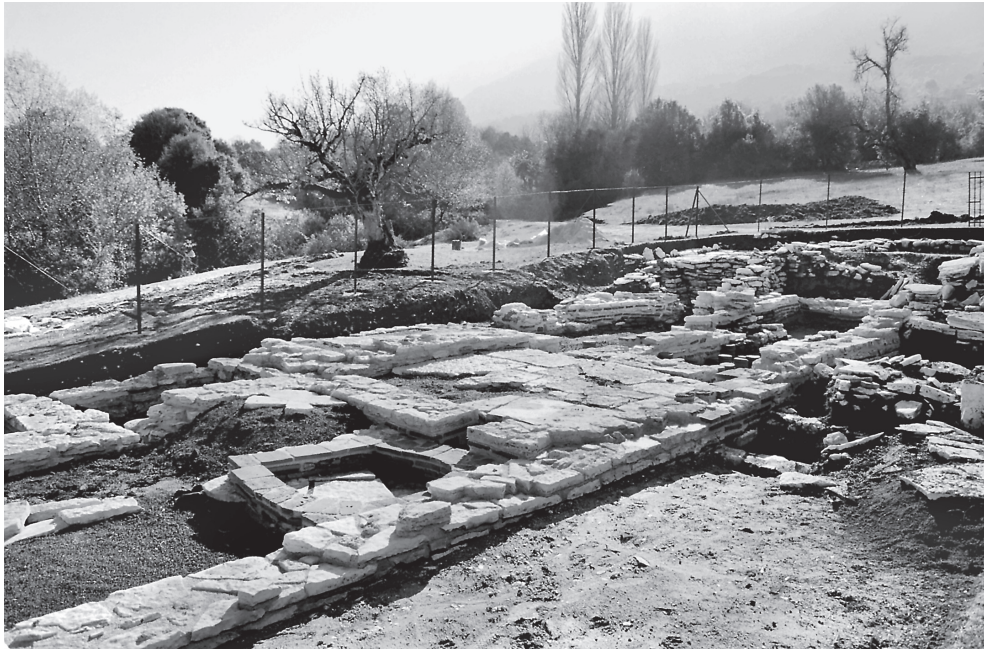
Εικ. 4. Άποψη του frigidarium και του tepidarium από βορειοδυτικά.

περίπου 0,30 μ. μεταξύ τους. Ενδιαφέρον προκαλεί το δάπεδο των υποκαύστων. Η πρώτη σειρά στηριγμάτων