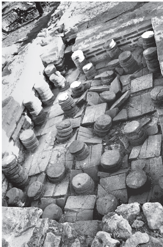
Εικ. 6. Η δυτική αίθουσα του caldarium , από νότια.

Από τους χώρους του caldarium προέρχονται αρκετά