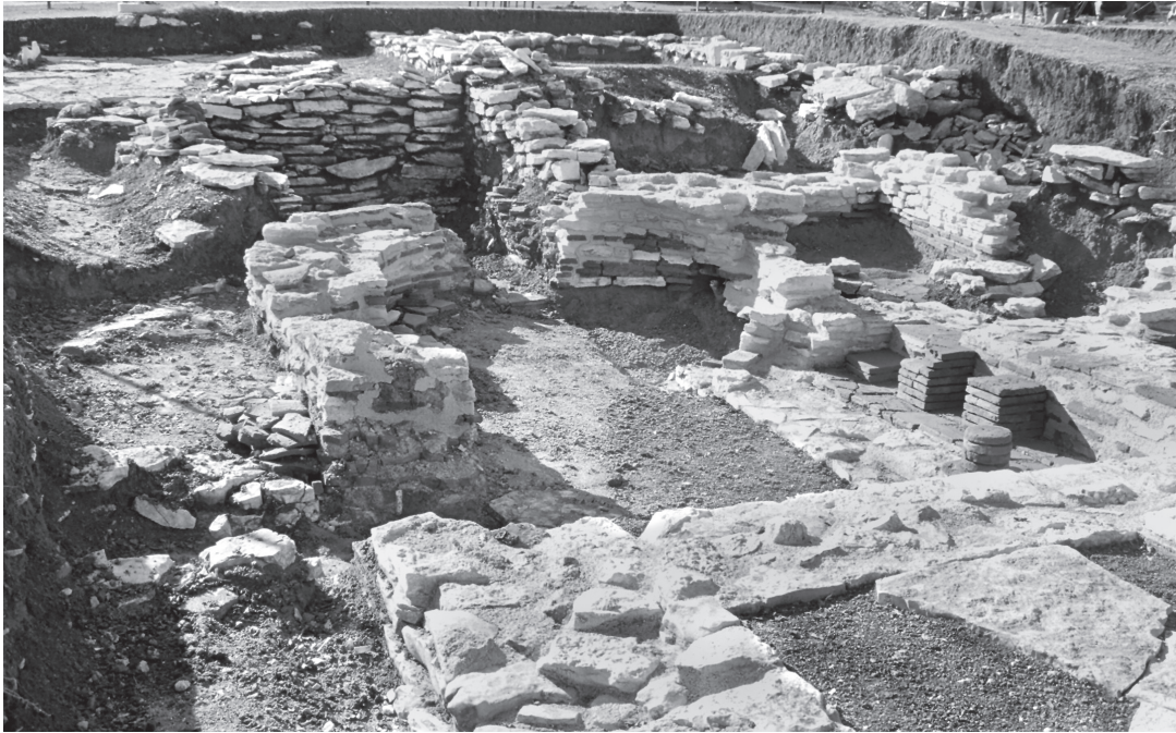
Εικ. 7. Η ανατολική αίθουσα του caldarium , από βόρεια.

στάσεις 1,80×1,70 μ. Η πρόχειρη κατασκευή, η άμεση σύνδεση του χώρου με το praefurnium και η παρουσία στρώματος στάχτης στο εσωτερικό του οδηγεί στο συμπέρασμα ότι πρόκειται για τον βοηθητικό χώρο που στέγαζε την εστία, το προπνιγείον 19 , του λουτρού. Δύο εστίες θέρμαιναν την ανατολική αίθουσα του caldarium , μία στον ανατολικό τοίχο, στρωμένη με μεγάλη ασβεστολιθική πλάκα, και μία στο νότιο τοίχο, στον αφιδωτό χώρο, κάτω από την εκεί κατά πάσα πιθανότητα τοποθετημένη πύελο , στρωμένη με πλίνθους. Παραμένει αδιευκρίνιστο αν ο χώρος νότια της αφίδας, ο