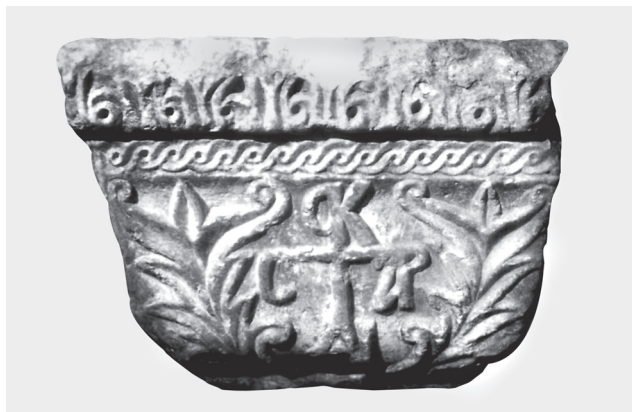
Fig. 5. Troisième côté du chapiteau: monogramme (O KAICAP).