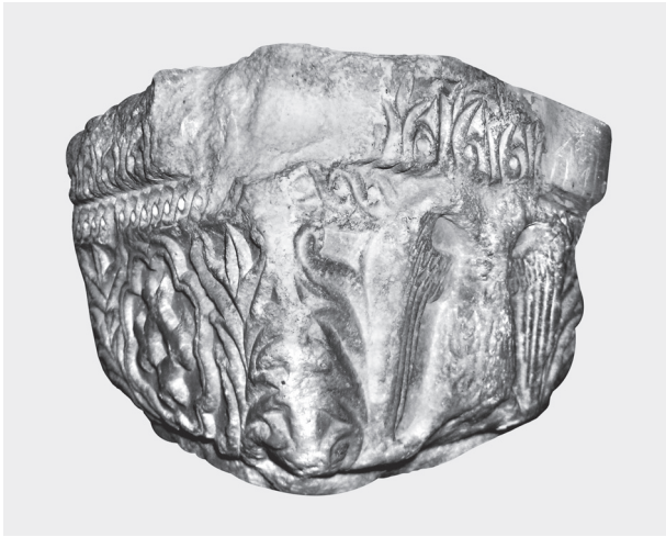
Fig. 1. Crypte de la basilique de Saint-Démétrios à Thessalonique. Chapiteau avec emblèmes impériaux des Paléologues.