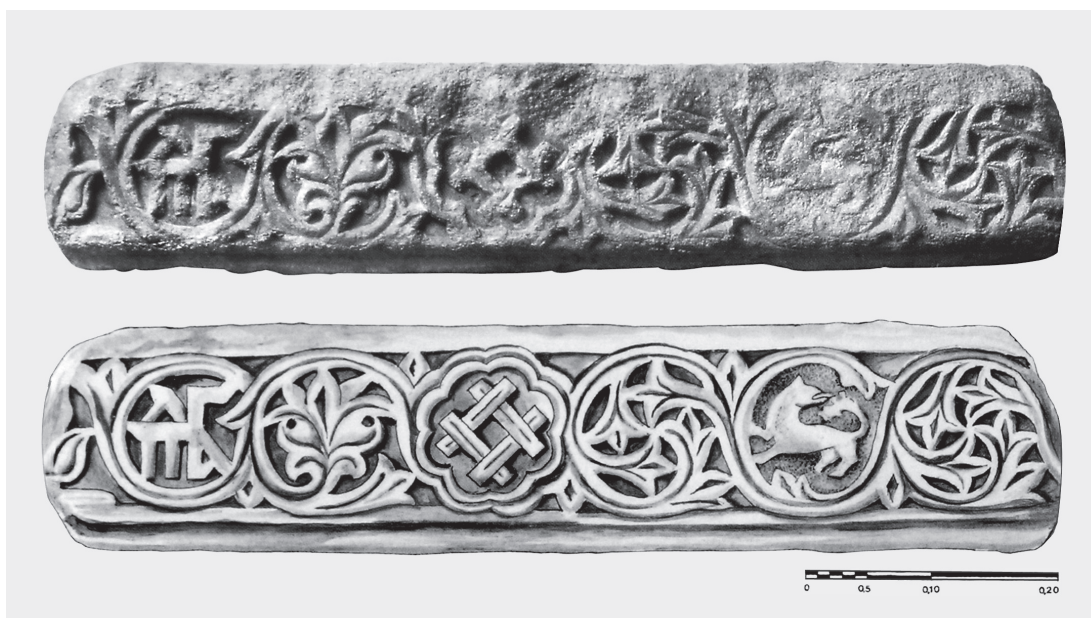
Fig. 7. Musée de la Culture Byzantine de Thessalonique. Épistyle du XIVe siècle (A. Tzitzibassi).

tion. Une rosace à huit lobes identique à celles du chapiteau est sculptée, tant sur l'épistyle du Musée Byzantin de Thessalonique publié par Tzitzibassi (Fig. 7) 28 et sur les impostes de chapiteau des fenêtres bilobées du côté ouest du déambulatoire de l'église des Saint-Apôtres à Thessalonique. Les deux rosaces (Fig. 8) renferment les monogrammes du patriarche Niphon, fondateur de l'église (1310-1314) 29 . Le type de la rosace qui porte le monogramme des Paléologues et les quatre barres pourrait être plus au moins contemporain ou un peu postérieur à ceux des Saints-Apôtres. Le même type de rosace enferme les mêmes emblèmes sur d'autres objets qui sont généralement attribués au XIVe siècle et à la première moitié du siècle suivant 30 .