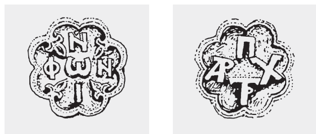
Fig. 8. Déambulatoire de l'église des Saint-Apôtres à Thessalonique. Médailles à huit lobes renferment les monogrammes du patriarche Niphon, fondateur de l'église ( Η Θεσσαλονίκη και τα μνημεία της , Thessalonique 1985, 100).

Le premier fut Jean, fils aîné de l'empereur Andronic II Paléologue et de son deuxième épouse (1284) Irène (Yolande de Montferrat, fille de Guillaume VII, marquis de Montferrat) 32 . Tout récemment - et contrairement à d'autres chercheurs qui plaçaient sa naissance en 1286 - A. Failler proposa 1289 comme date de naissance de Jean 33 . Irène (1274-1317) entretenait des liens familiaux avec la ville de Thessalonique, car la maison lombarde de Montferrat 34 revendiquait ses anciens droits dans la ville qui les avait obtenus depuis le temps de sa domination latine 35 . L'impératrice, dans l'intérêt de ses fils réclama (selon Nicéphore Grégoras) un partage du territoire impérial entre tous les princes impériaux, d'après le modèle féodal occidental 36 . Andronic II, qui favorisait l'unité de l'empire grec, repoussa obstinément la proposition et rejeta les prétentions de son épouse. Le refus de l'empereur fut l'origine d'une grave brouille; Irène quitta la capitale et se rendit en automne de 1305 à Thessalonique 37 , où elle a résidé jusqu'à sa mort à Drama, en 1317. Avec l'arrivée d'Irène à Thessalonique, commence une autre période de gouverne-