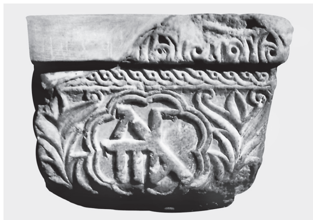
Fig. 4. Côté suivant du chapiteau. Monogramme des Paléologues.