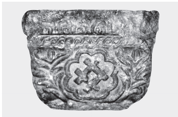
Fig. 6. Quatrième côté. Motif des barres parallèles.

moiries à ses sujets. Celles-ci étaient de libre adoption, laissées aux choix du possesseur. De plus, l'ancienne emblématique familiale et locale, généralement stable quant au symbole choisi, ne s'est jamais pliée aux exigences de la loi des émaux et des métaux du blason occidental, pour ne pas parler des meubles de l'écu qui, bien des fois, présentaient un aspect des plus insolites et hétéroclites du point de vue des normes héraldiques classiques 7 .