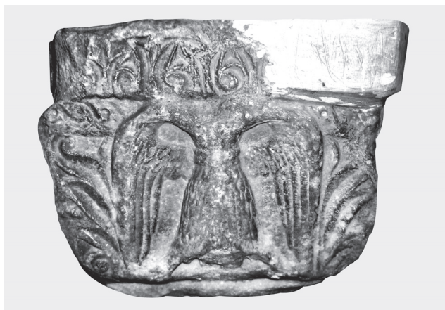
Fig. 3. Chapiteau. Aigle bicéphale.